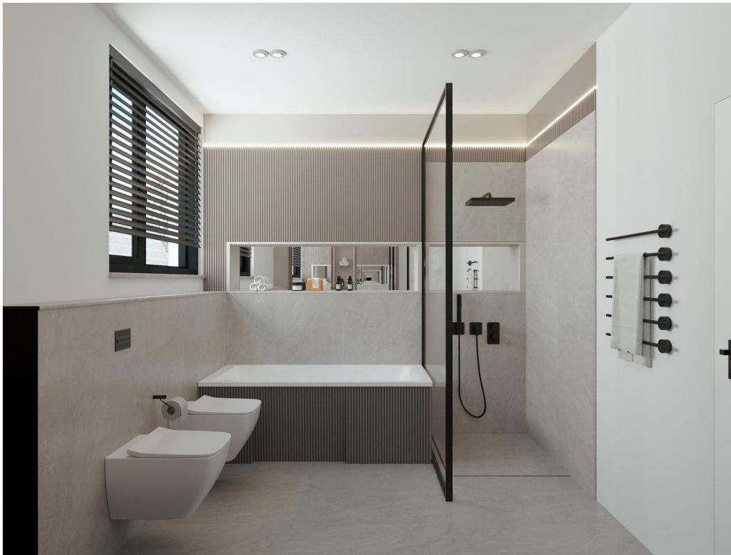
Visualisierung - Bad 1