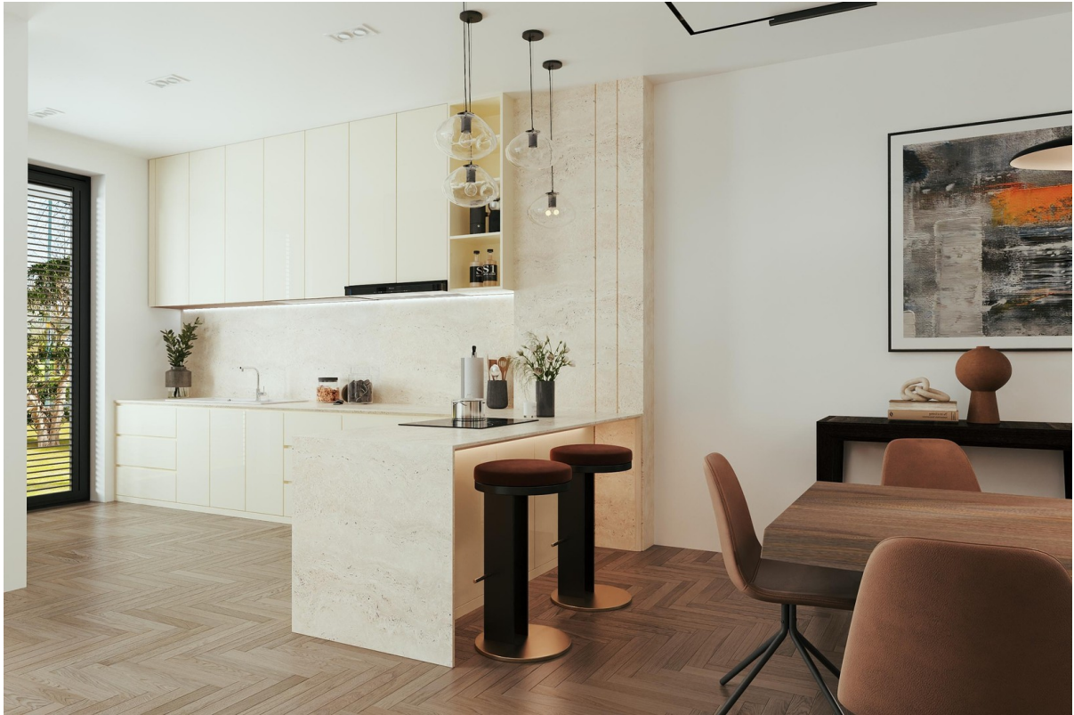
Visualisierung - Küche