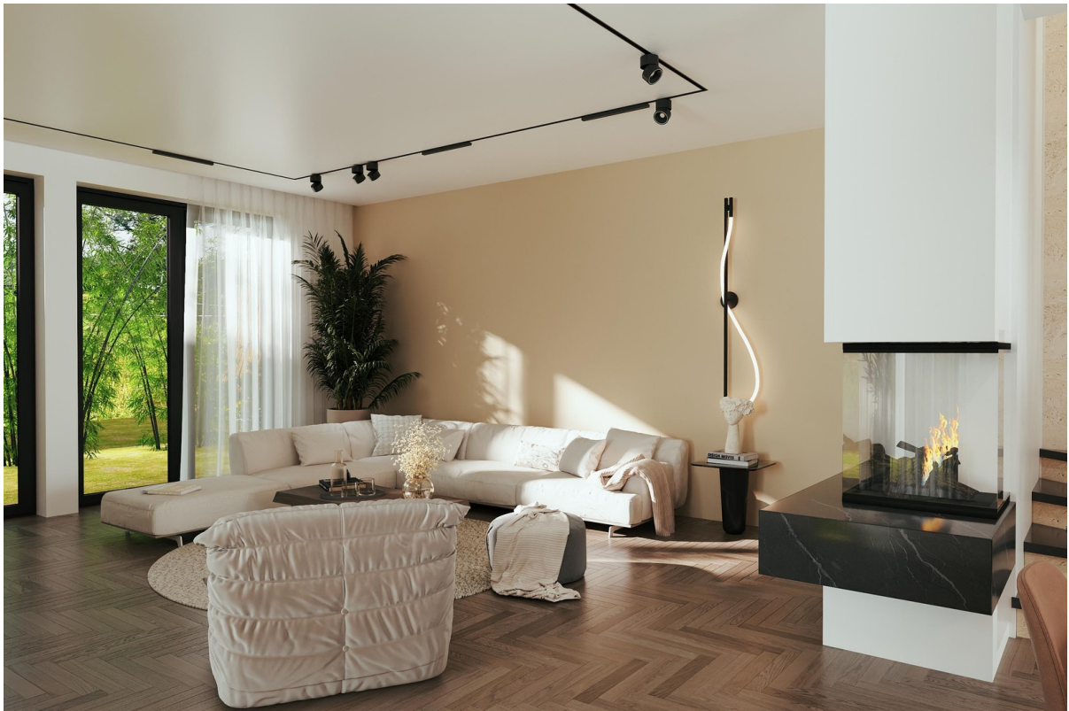
Visualisierung - Wohnb.1