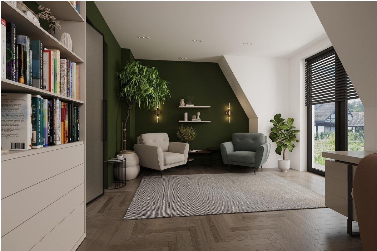
Visualisierung - Arbeitszi. 2