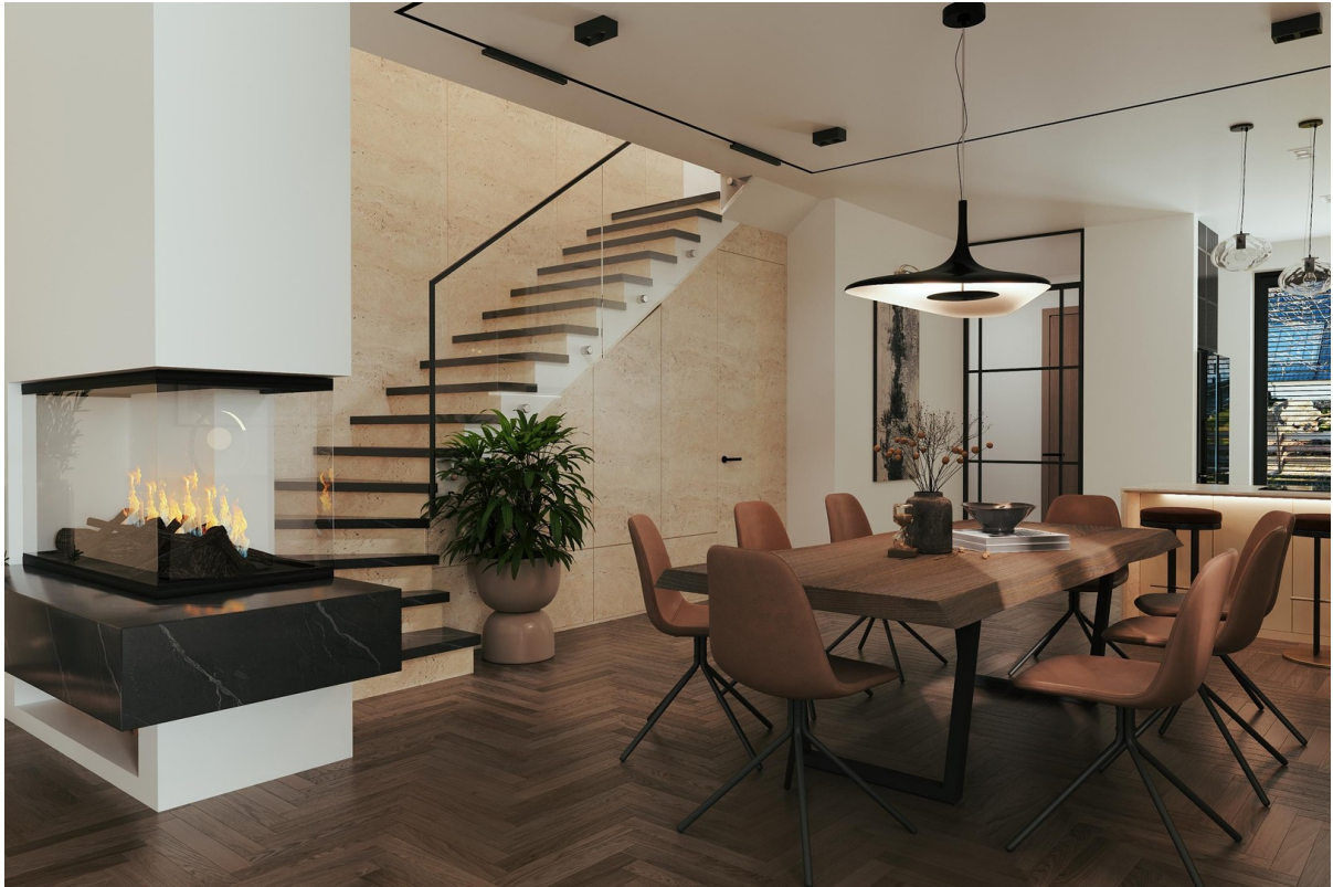
Visualisierung - Aufgang