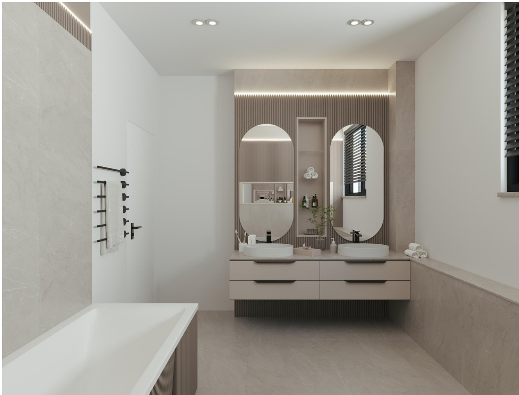
Visualisierung - Bad 2