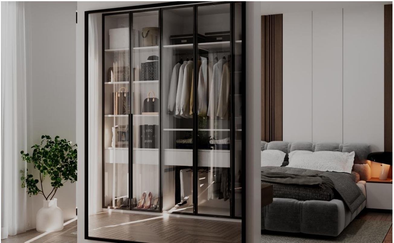
Visualisierung - Schlafzi. 2