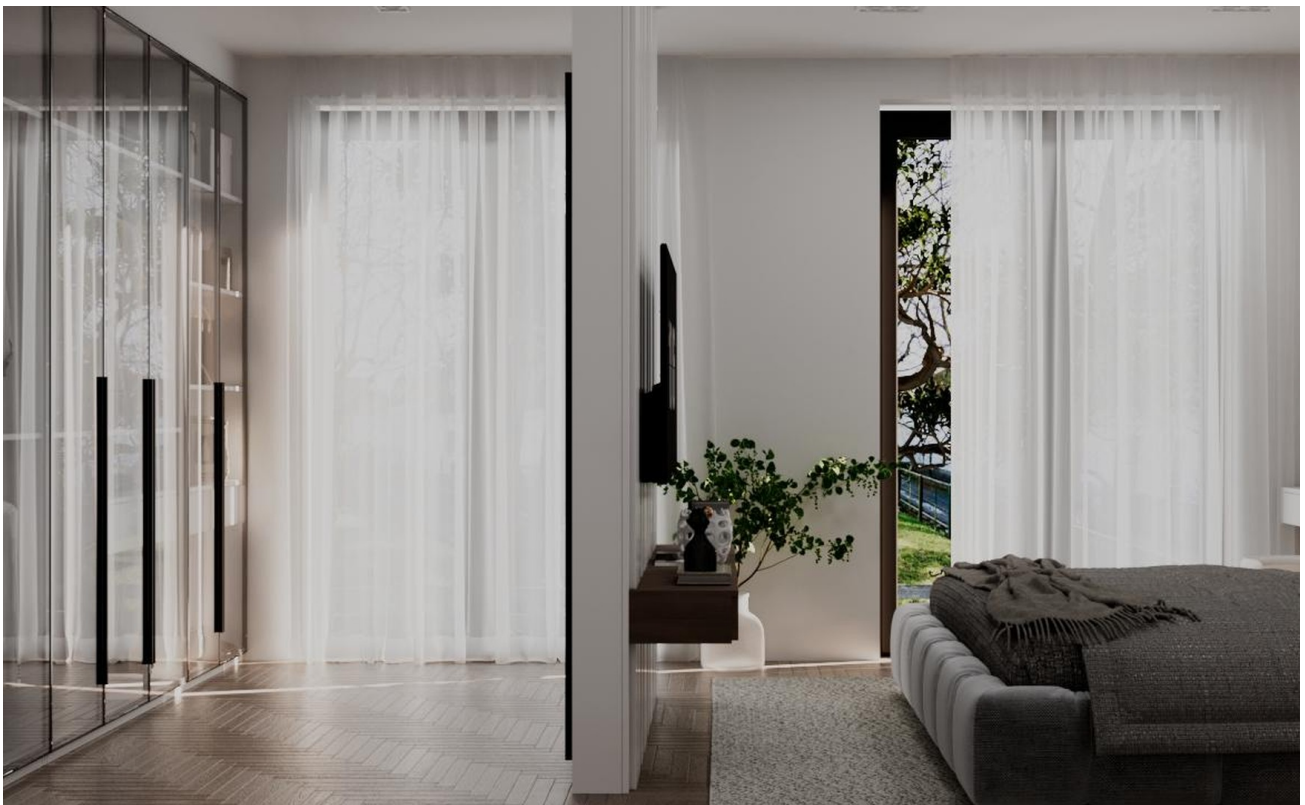
Visualisierung - Schlafzi. 1