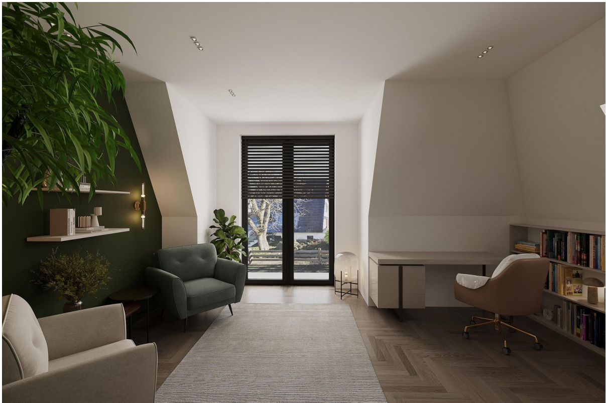
Visualisierung - Arbeitszi. 1