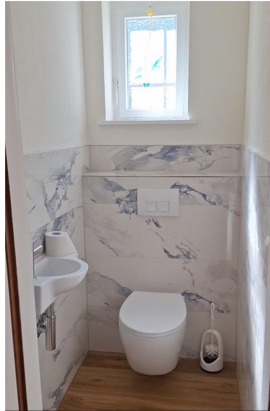
Gaste WC EG