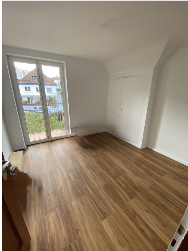
2. Schlafz. OG m. Einbauschr.