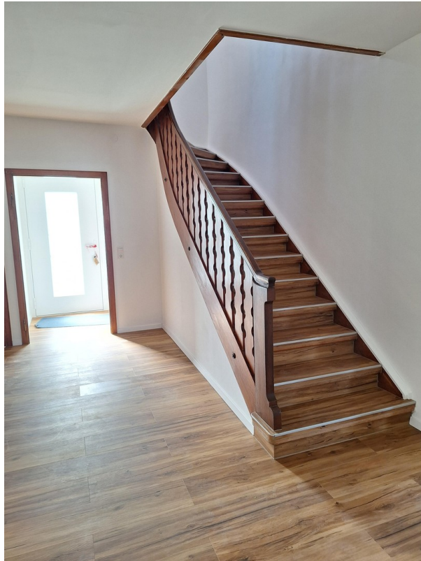
Entree mit Treppe