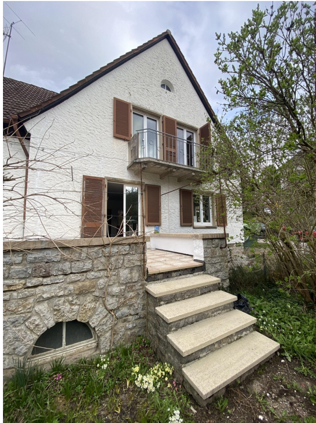
Treppe v. Terrasse zum Garten