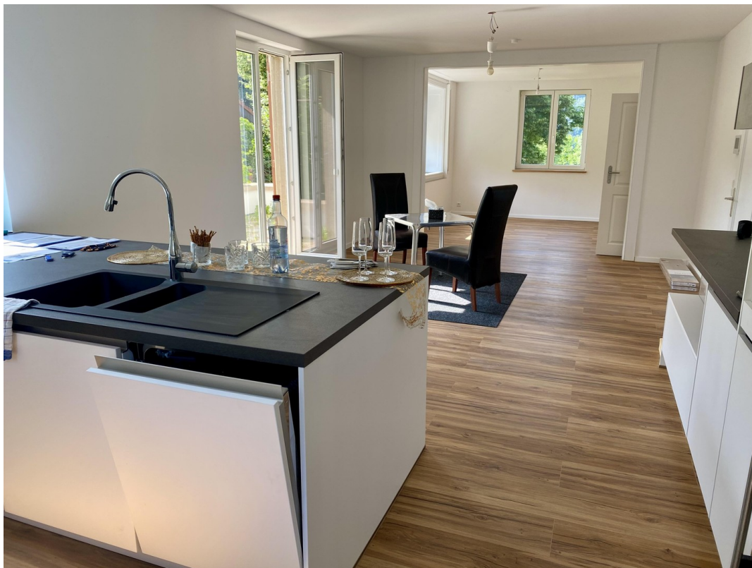
offene Küche zum Wohnen