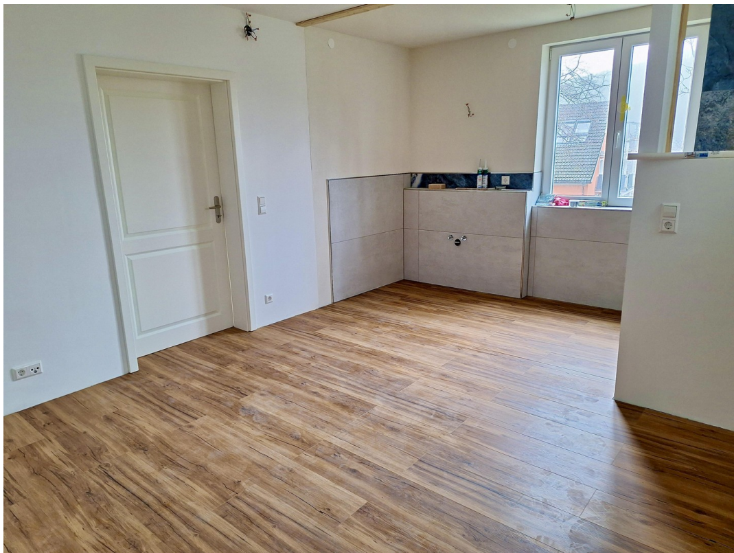
Schlafen EG m. integrie. Bad