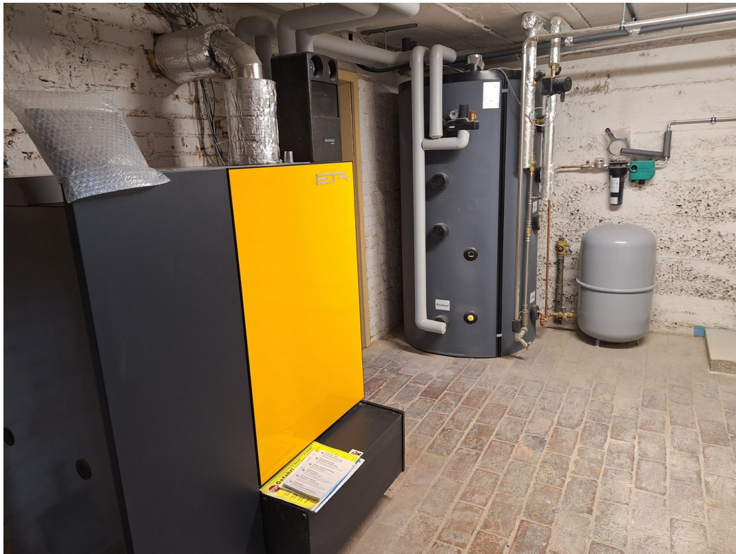
ETA Pelletheizung + WWSpeicher