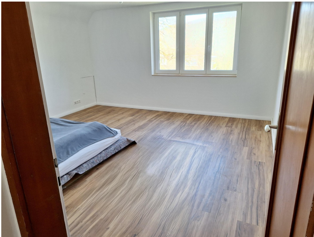
3. Schlafzimmer OG