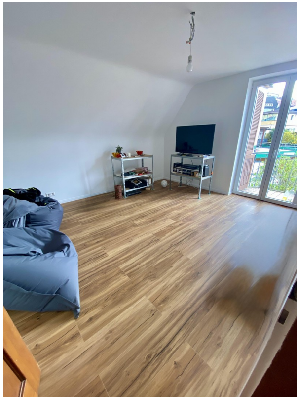
1. Schlafzimmer OG