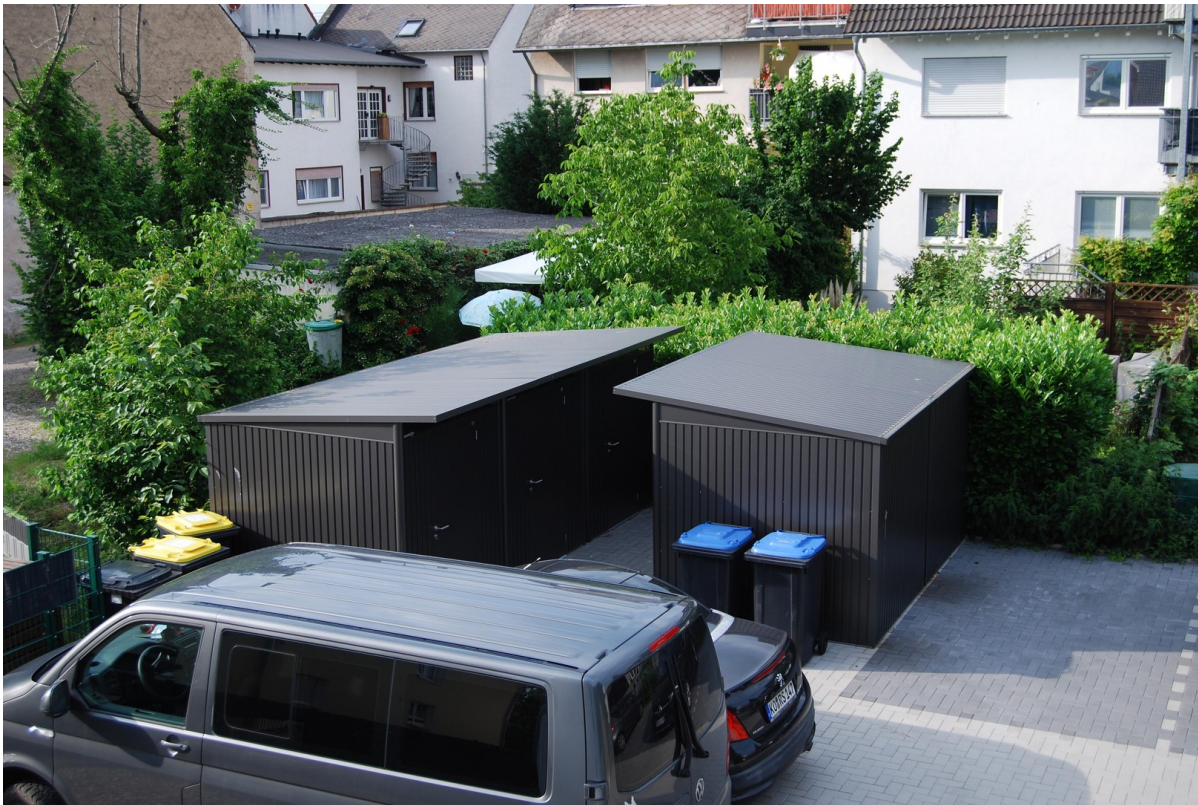
Stellplätze und Abstellräume