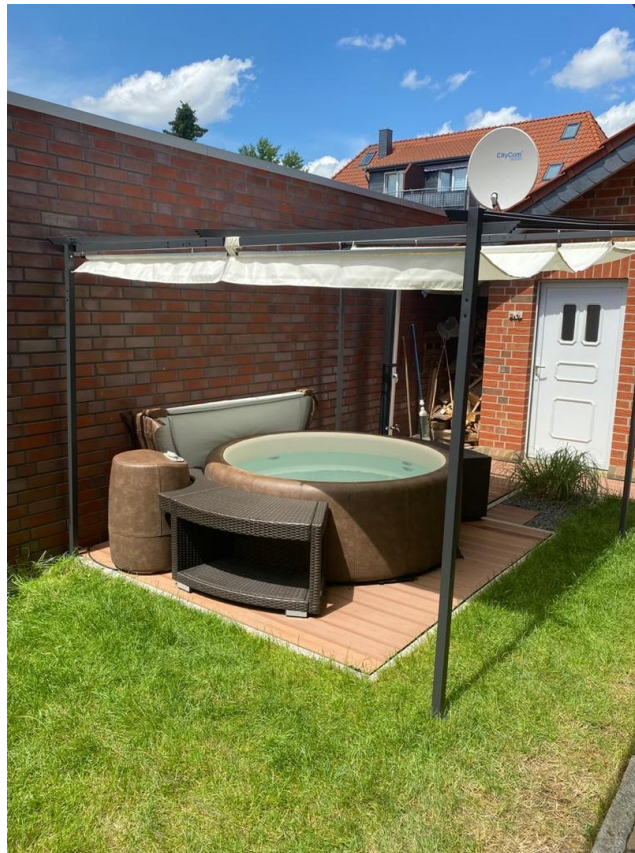
Whirlpool/ Sauna u Außendusche