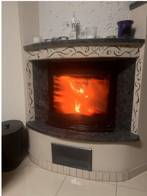
Kamin Wohnzimmer EG