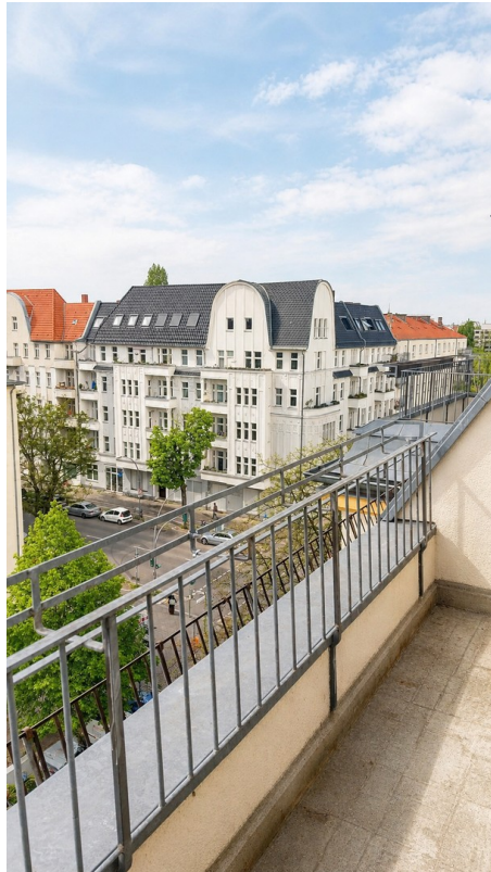
View from terrace