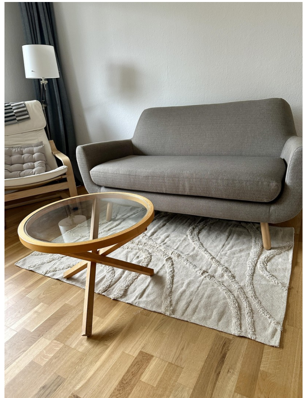
Wohnzimmer / Couch