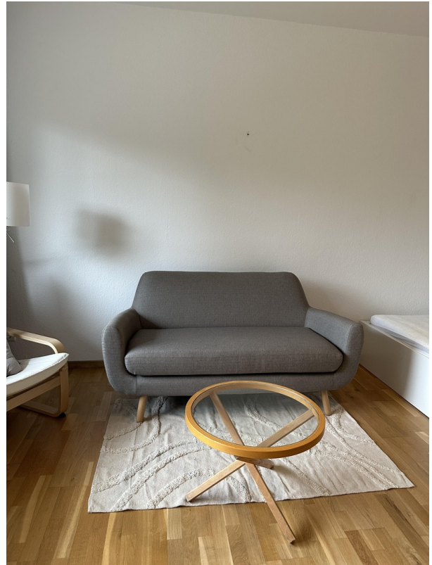
Wohnzimmer / Couch