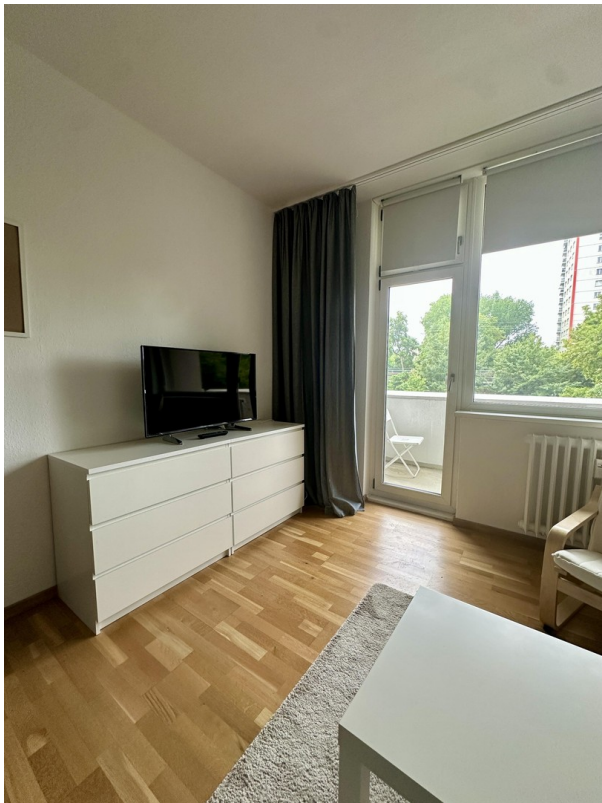
Wohnzimmer Blick zum Balkon