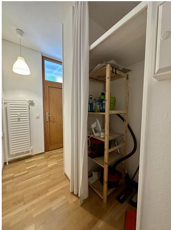
Flur + Abstellkammer