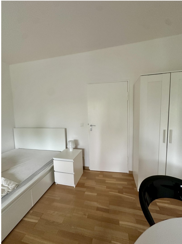
Wohnzimmer / Schlafzimmer