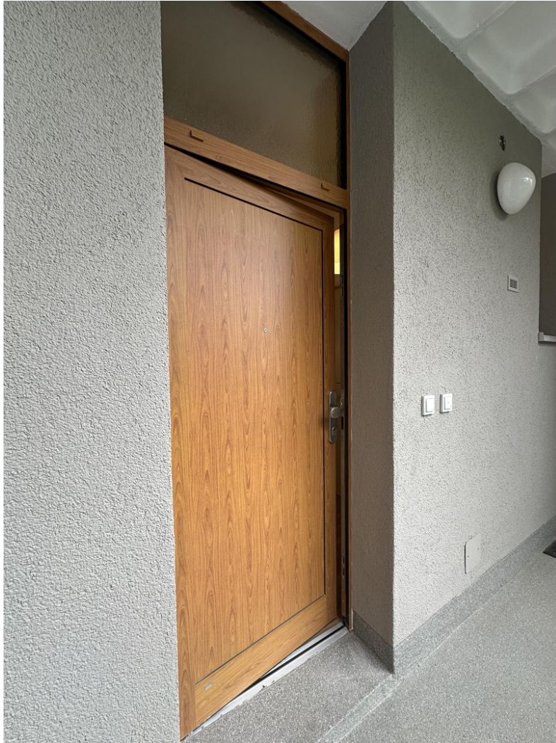
Eingangstür zur Wohnung