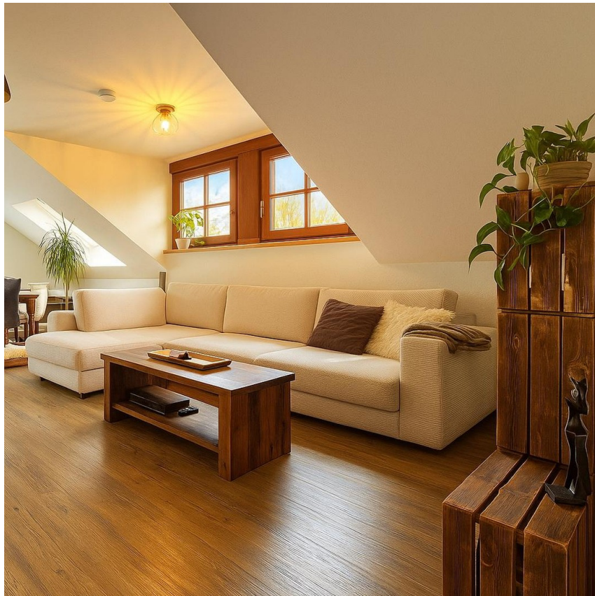
Anderes Zimmer mit Bsp.-Möbeln