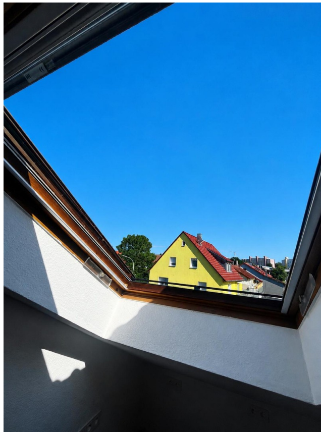
Zimmer № 4 Ausblick