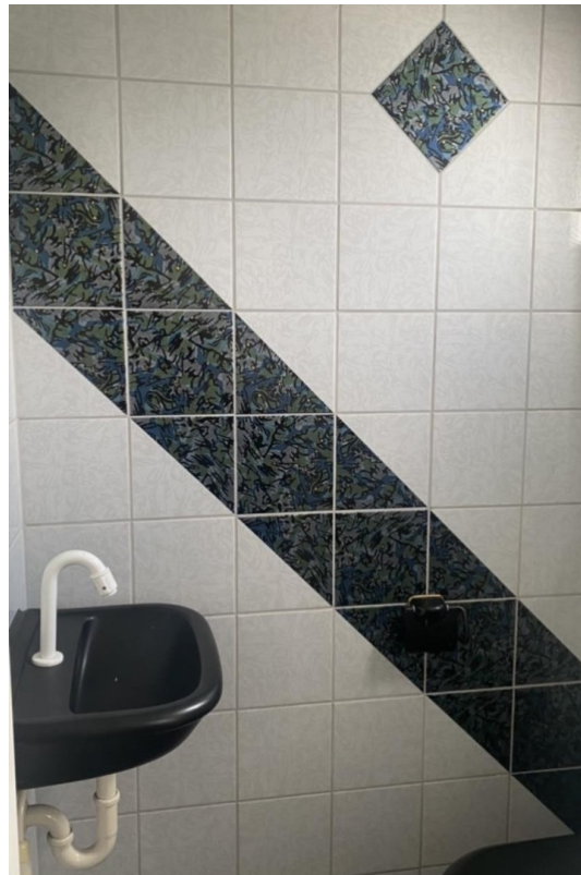
Extra WC OG