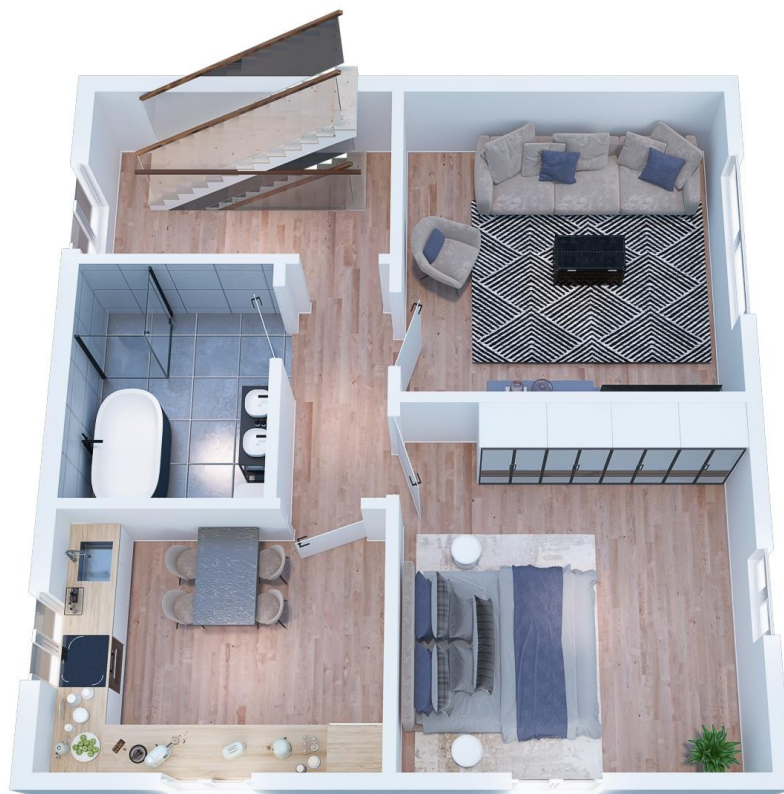
EG: 61 qm