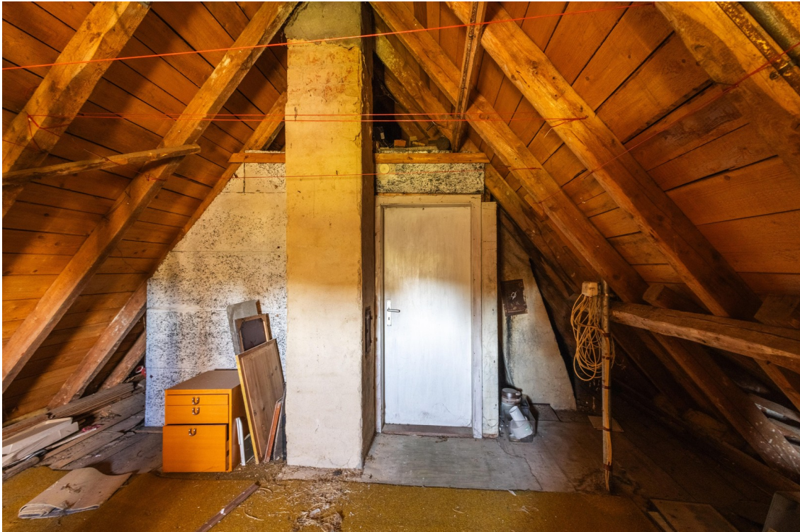
DG: Ausbaufähig auf 40qm