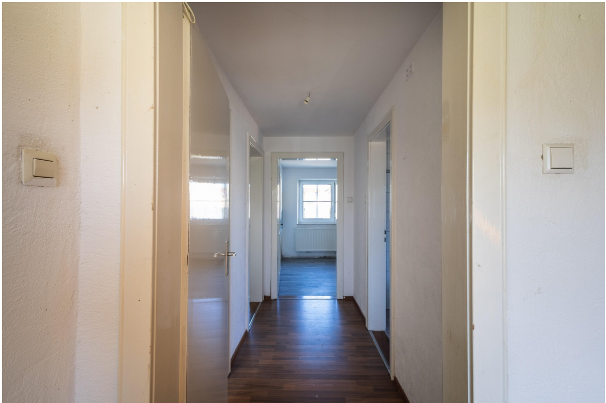
OG: Gang 3,6 qm