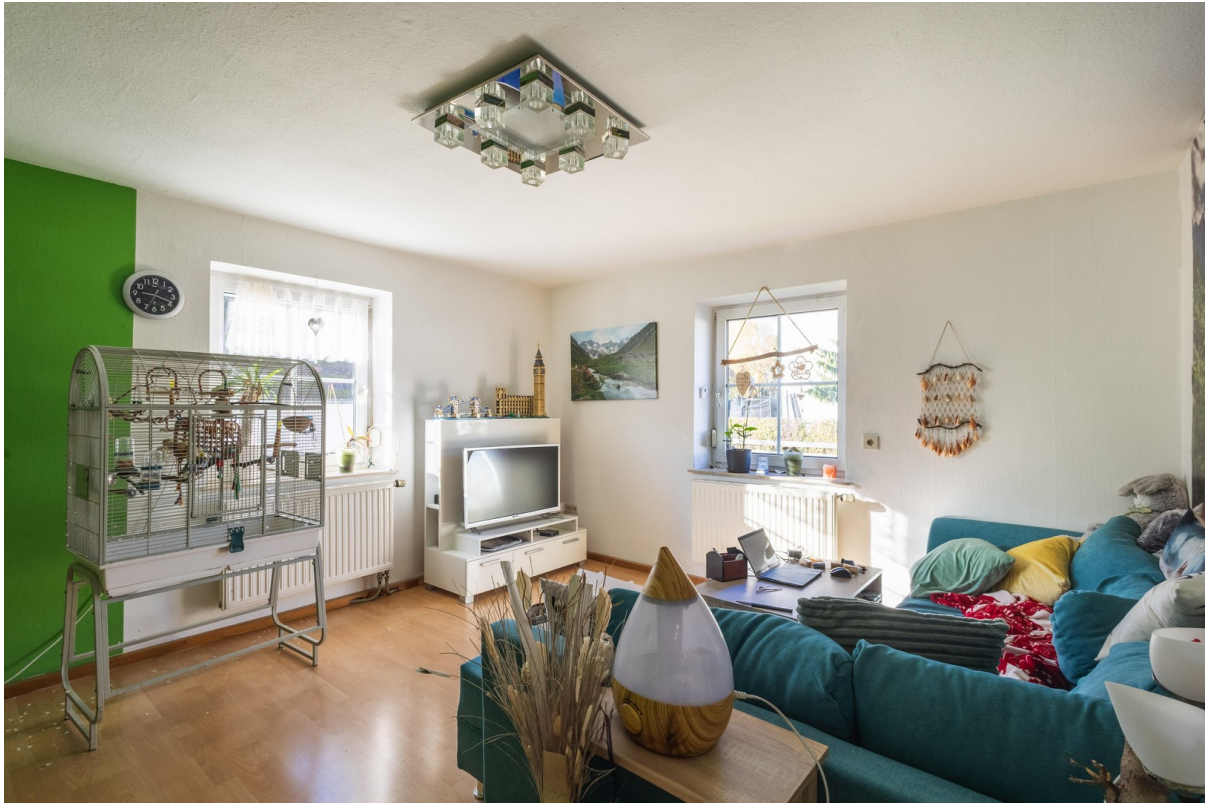
EG: Wohnzimmer 18 qm