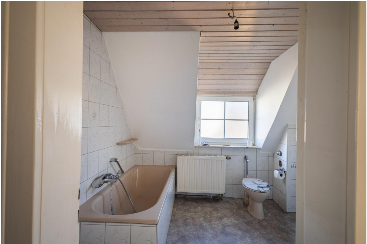
OG: Bad 7 qm