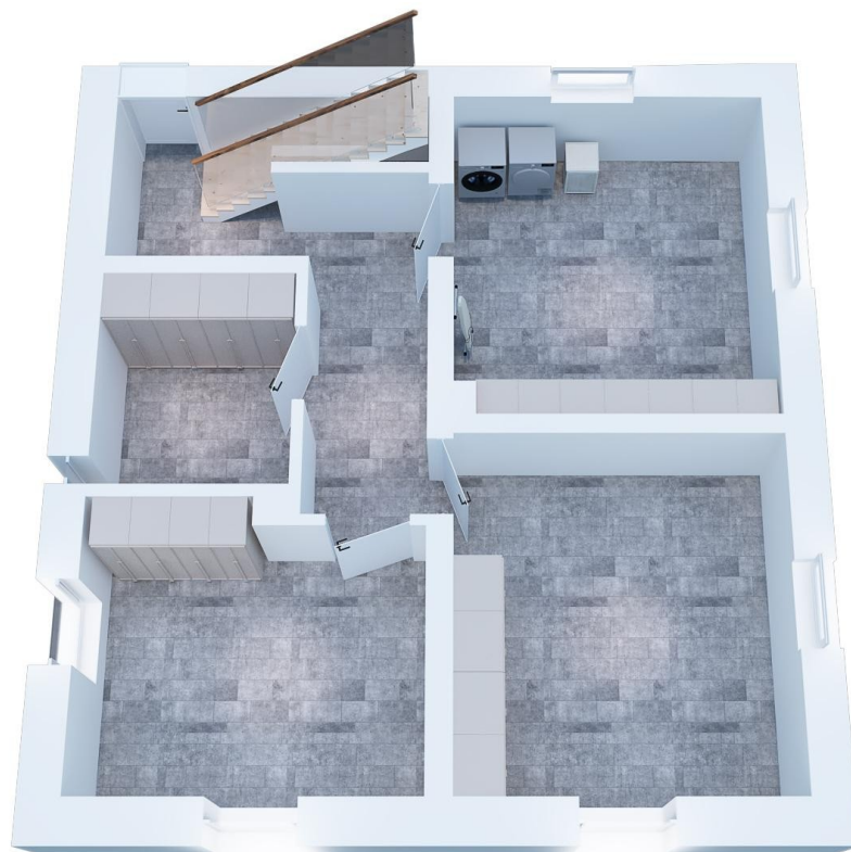
KG: 59 qm