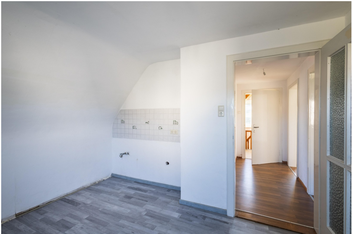
OG: Küche 12 qm