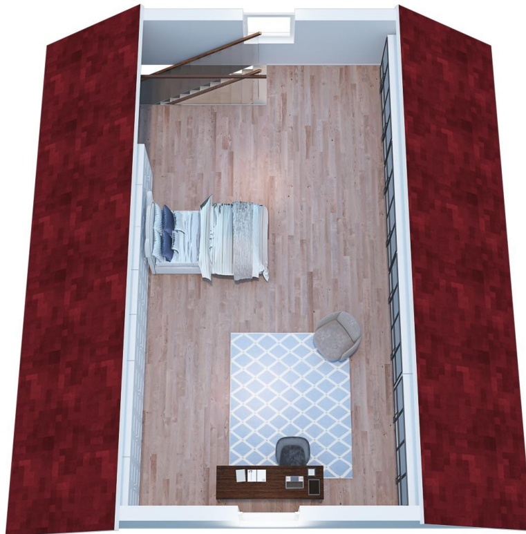
DG: 40 qm