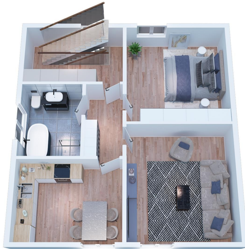
OG: 57 qm