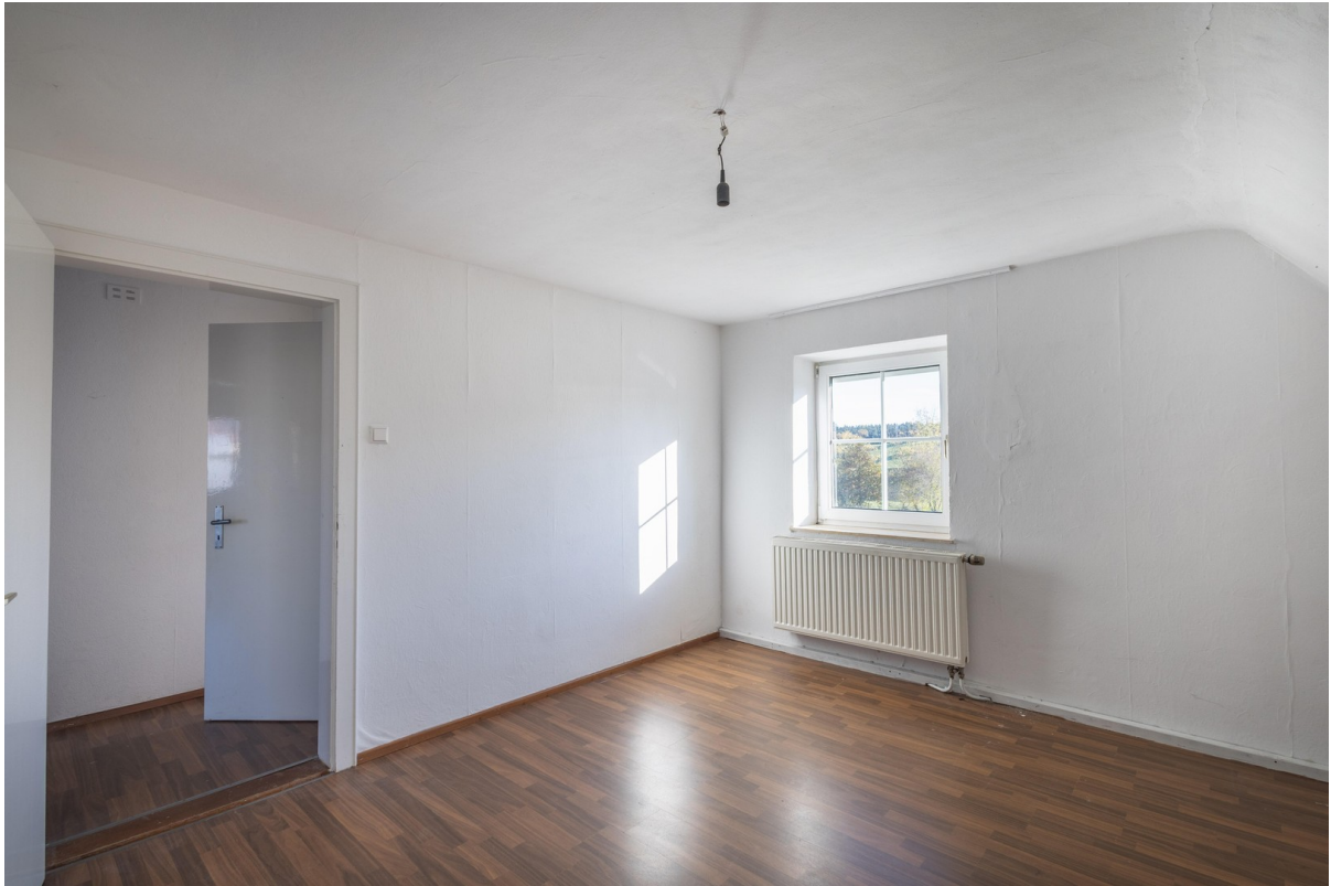
OG: Schlafzimmer 16 qm