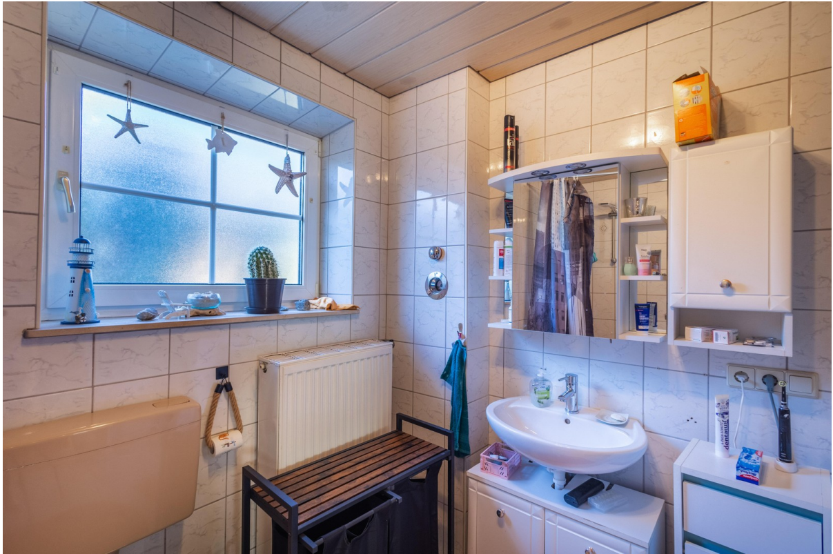
EG: Bad 7 qm