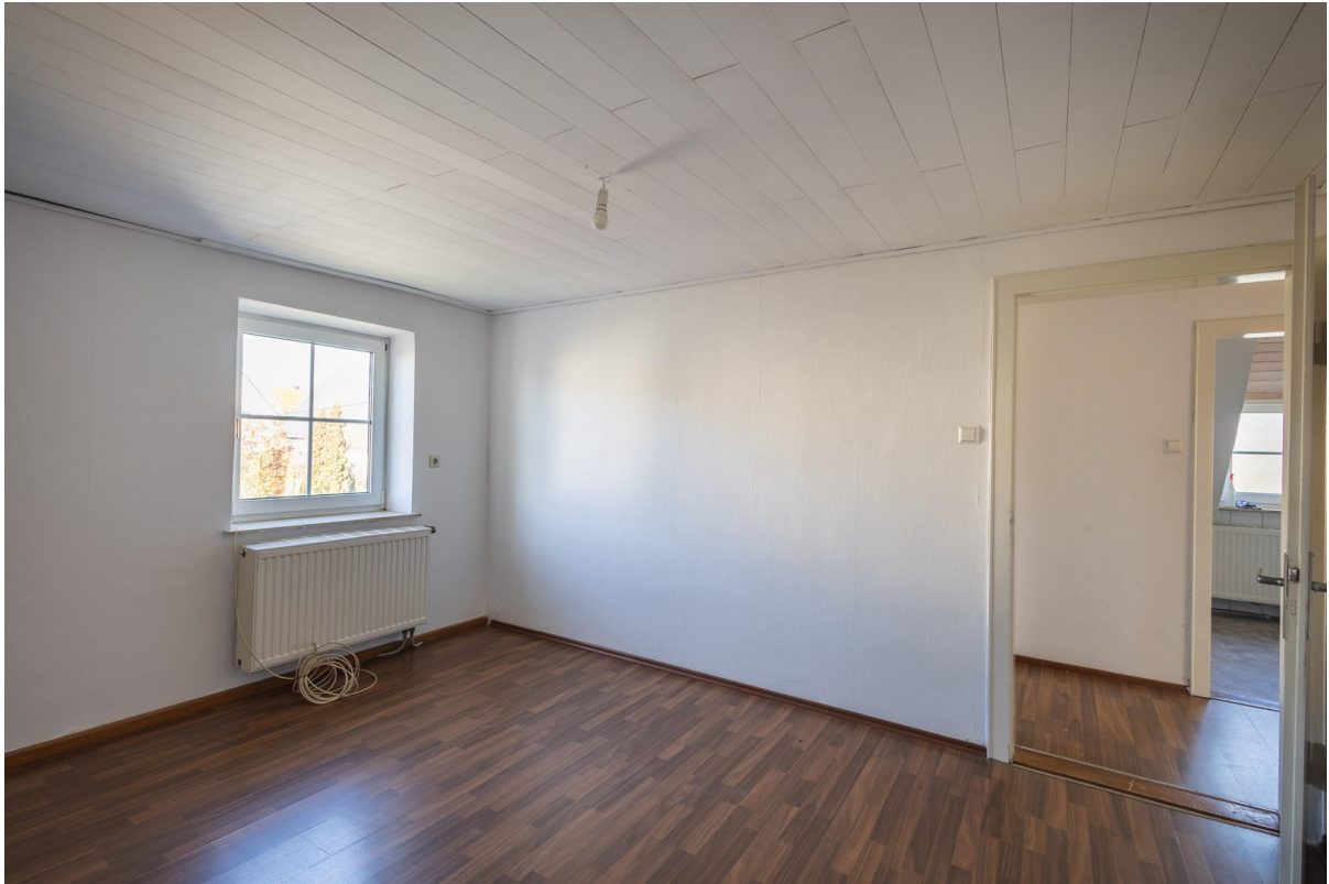
OG: Wohnzimmer 16 qm