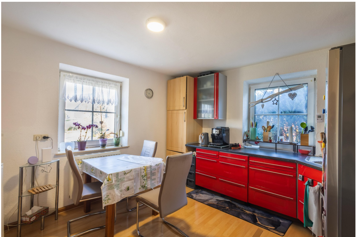
EG: Küche 13 qm