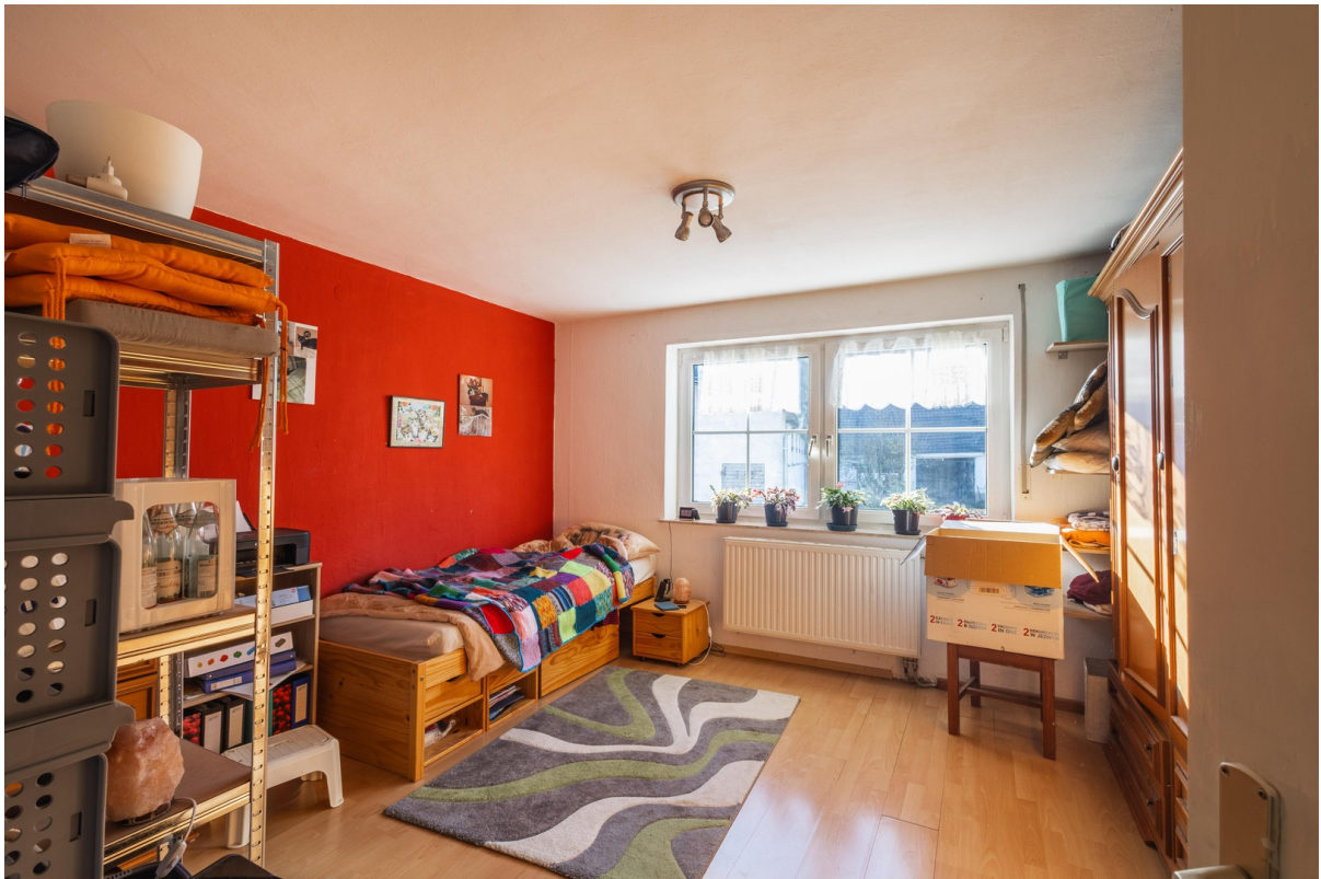
EG: Schlafzimmer 17 qm