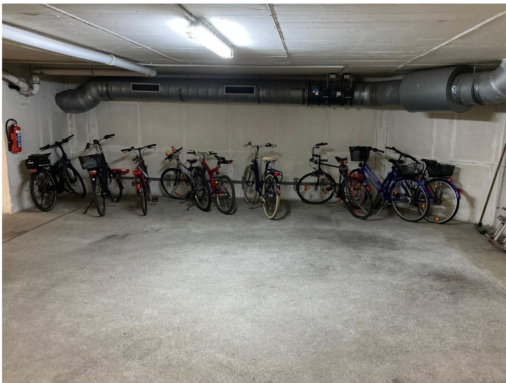
Fahrrad-Abstellplatz in TG