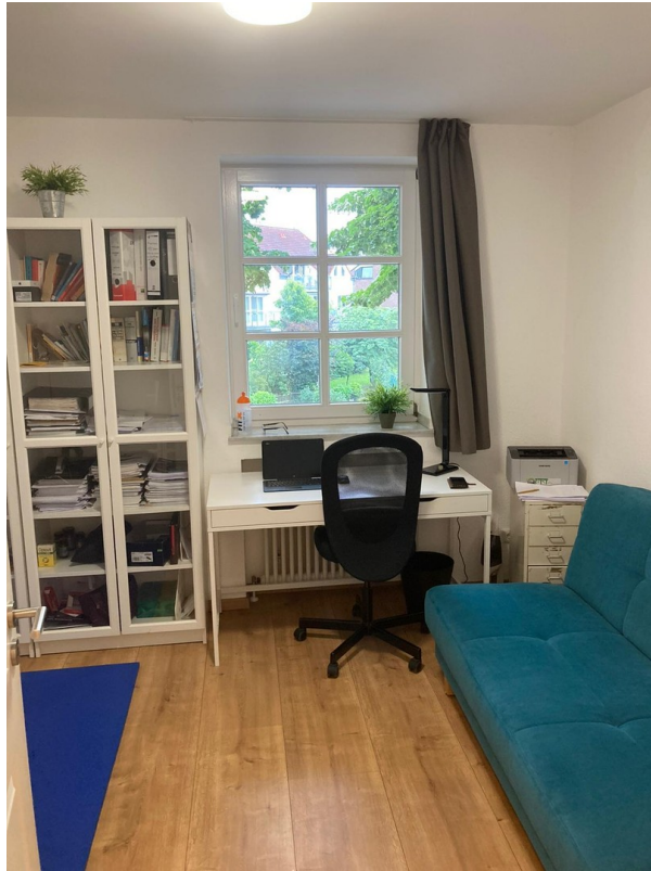
Kinder- oder Arbeitszimmer