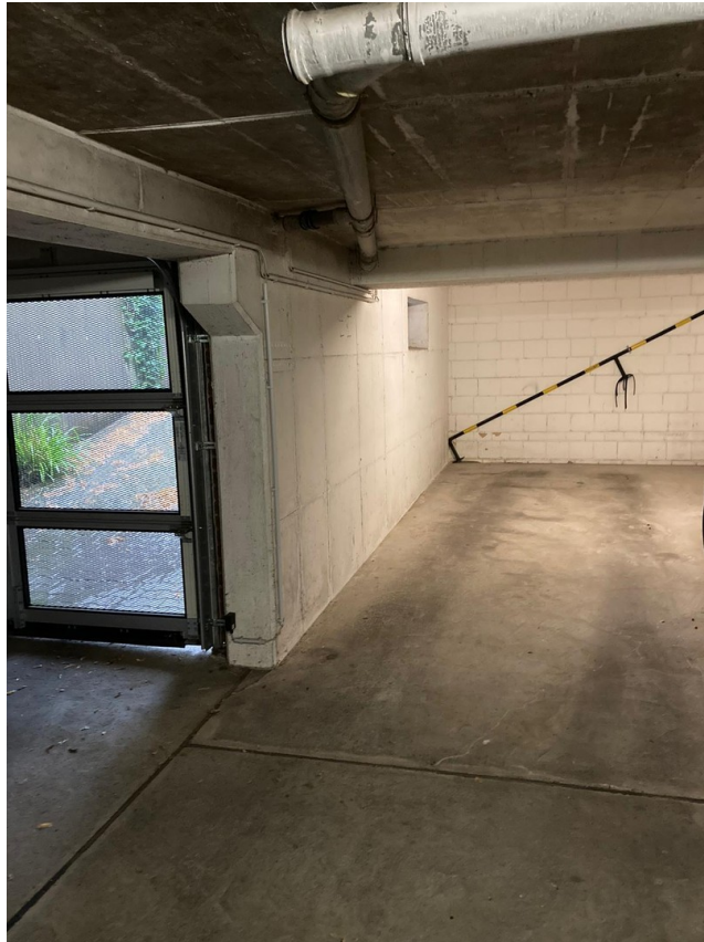
Stellplatz in Tiefgarage