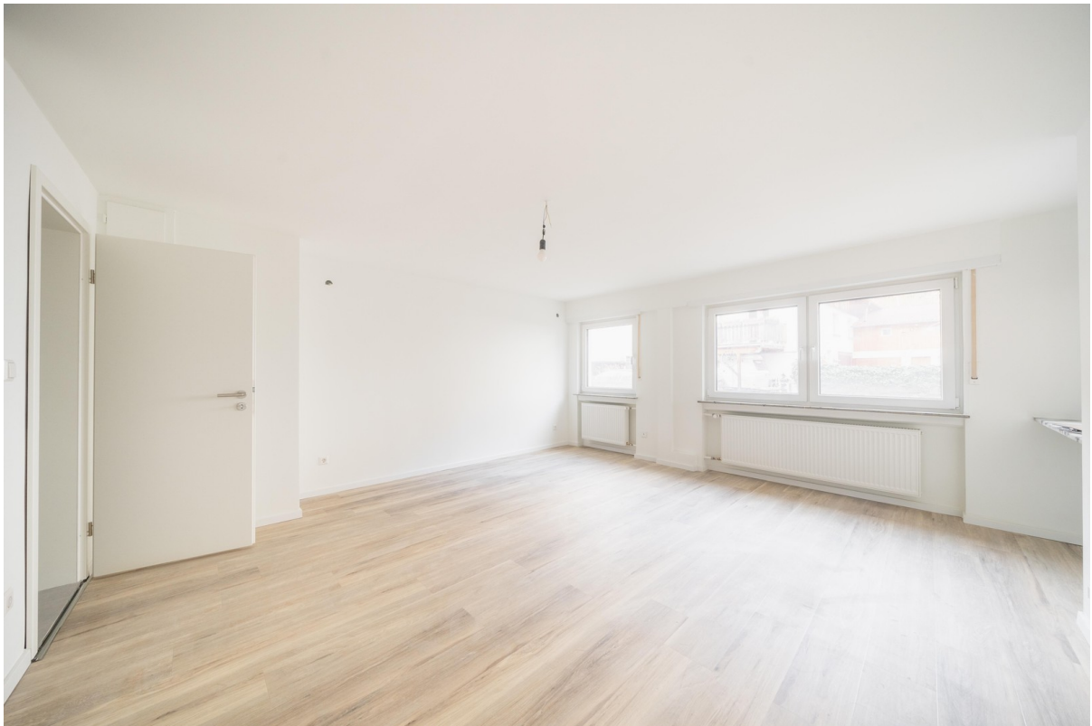
Wohn- und Schlafbereich 04