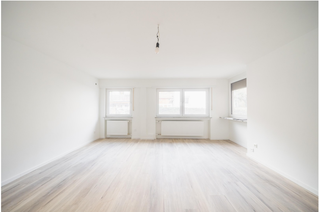
Wohn- und Schlafbereich 03