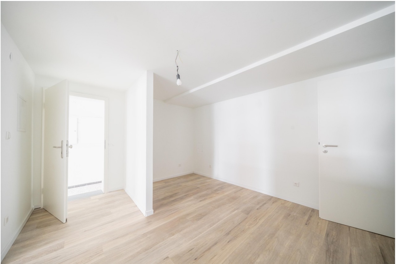
Wohn- und Schlafbereich 02