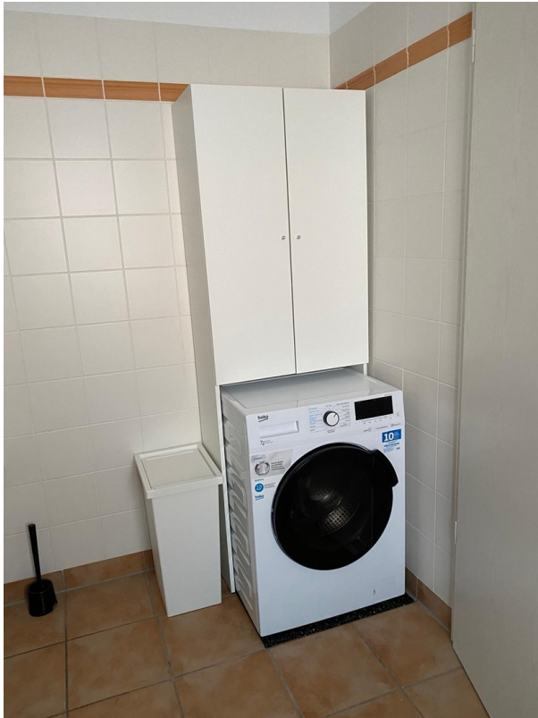
WM-Platz im Bad