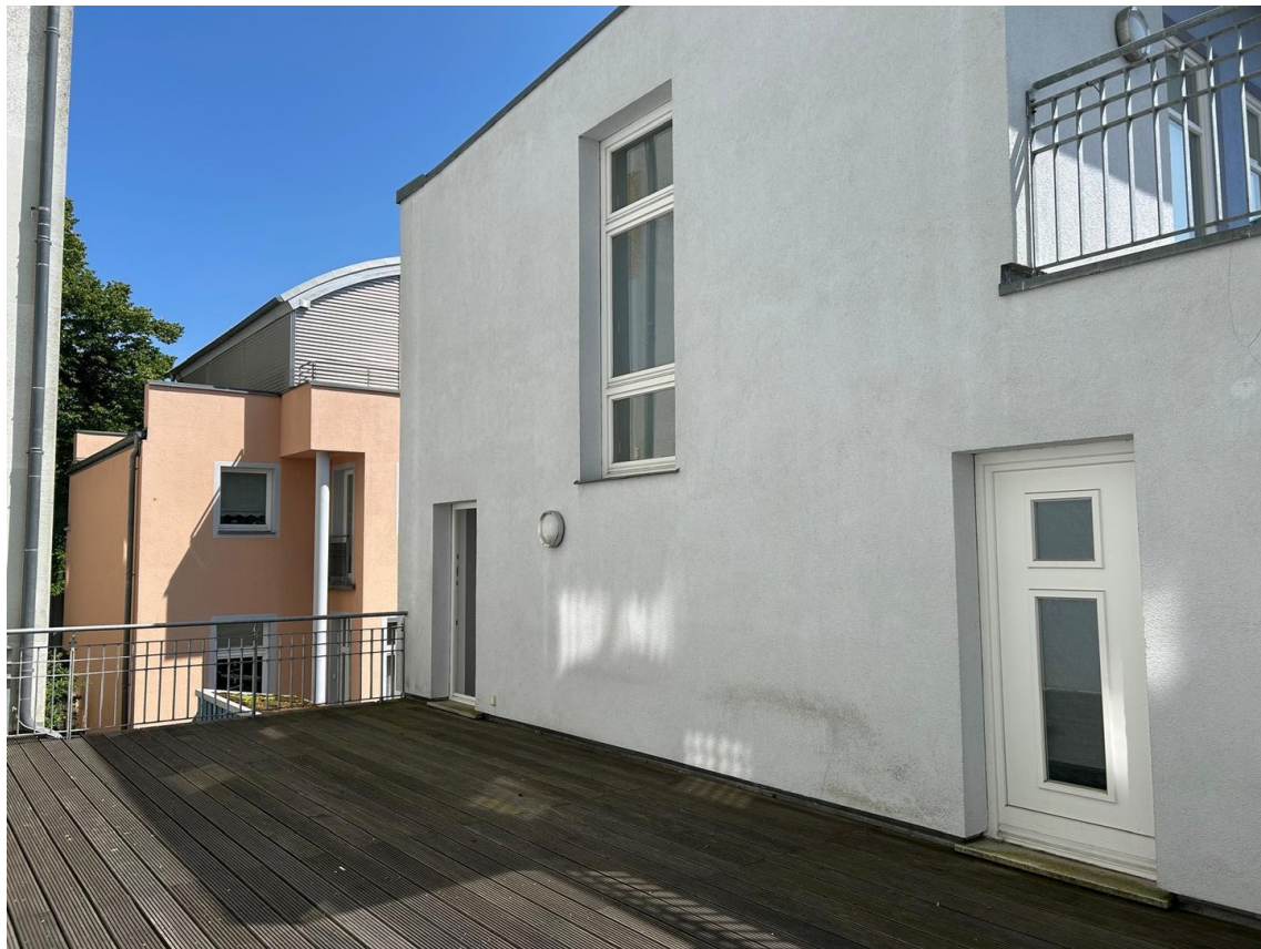
Terrasse OG mit zwei Zugängen