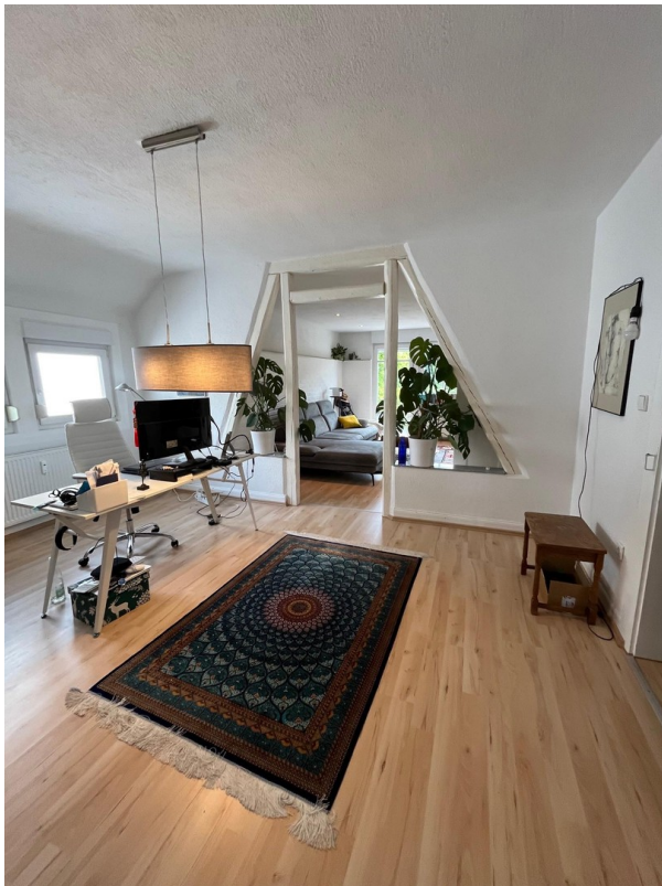
Esszimmer oder Homeoffice