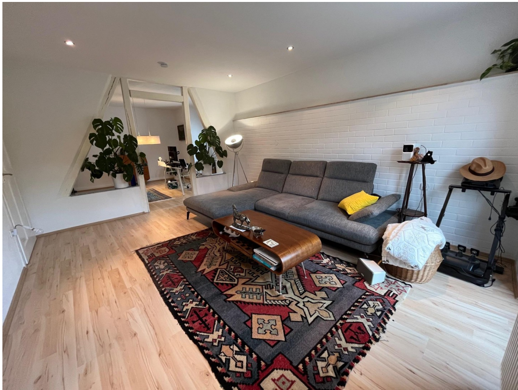
Wohnzimmer und Balkon