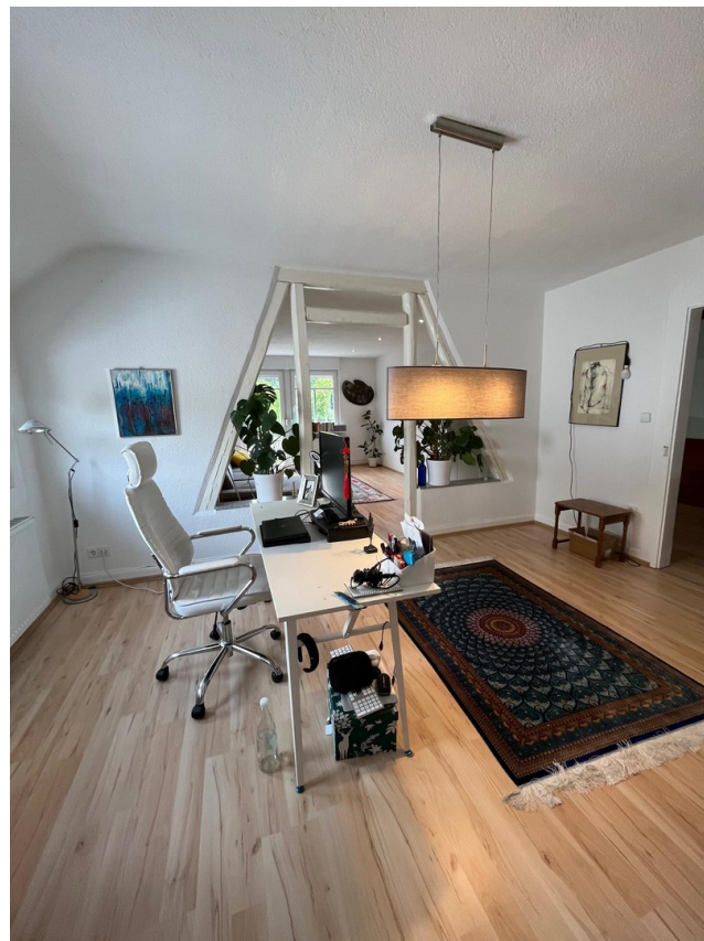
Homeoffice oder Esszimmer