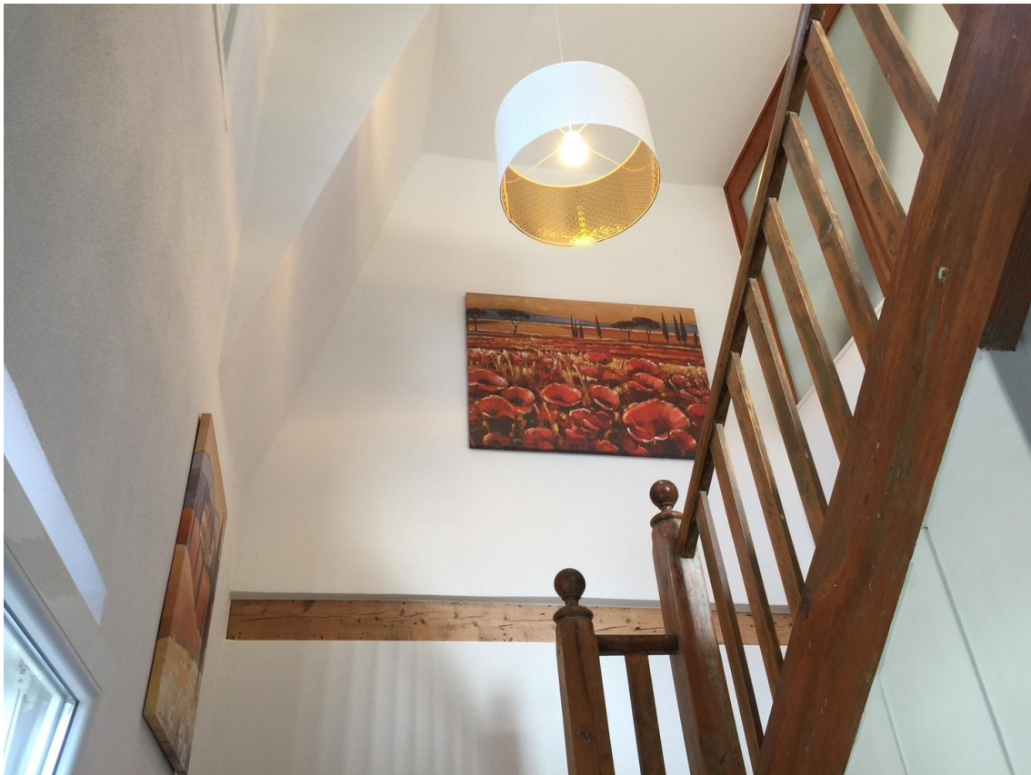
Blick ins Treppenhaus