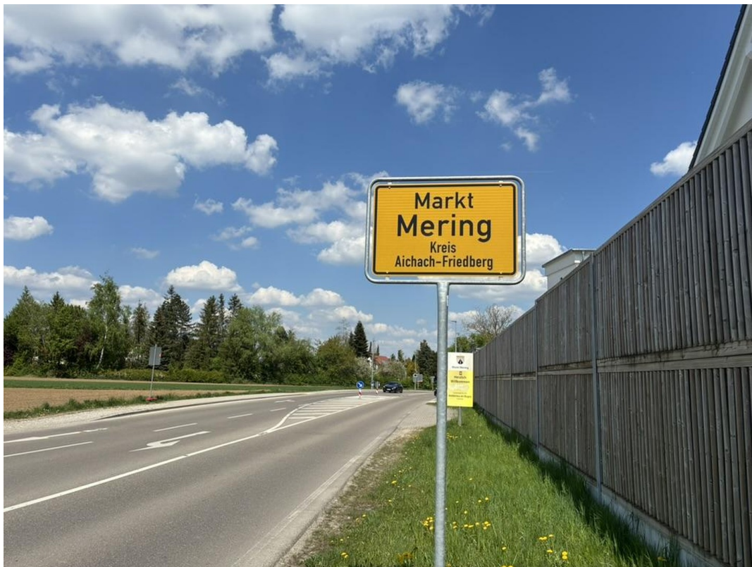
Zufahrt zum Ort