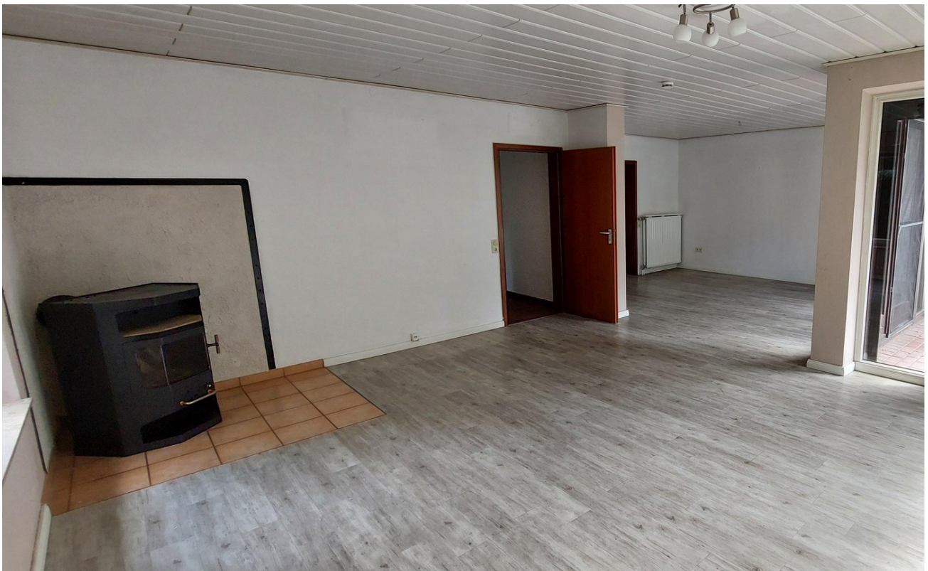
Wohnzimmer mit Blick Esszimmer