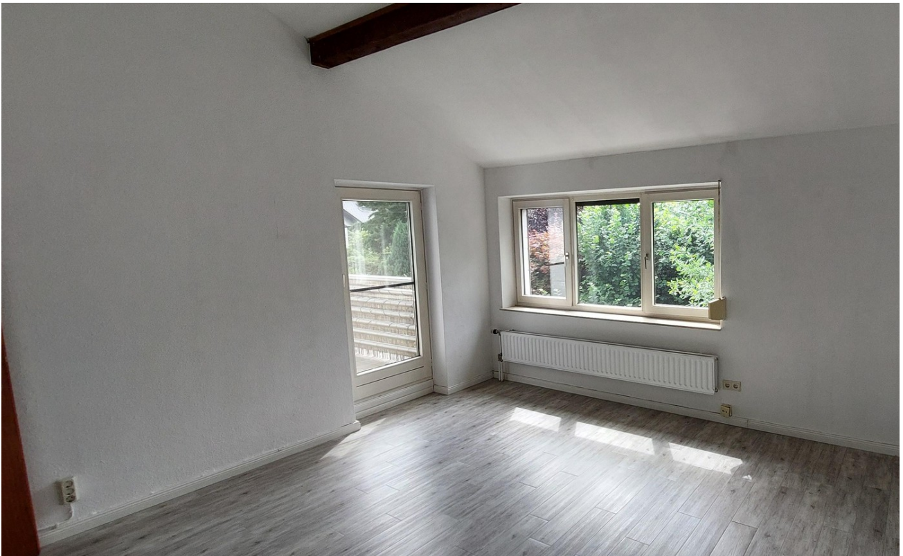
Schlafzimmer 3 mit Balkon