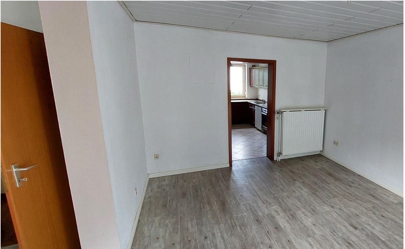
Esszimmer Blick zur Küche