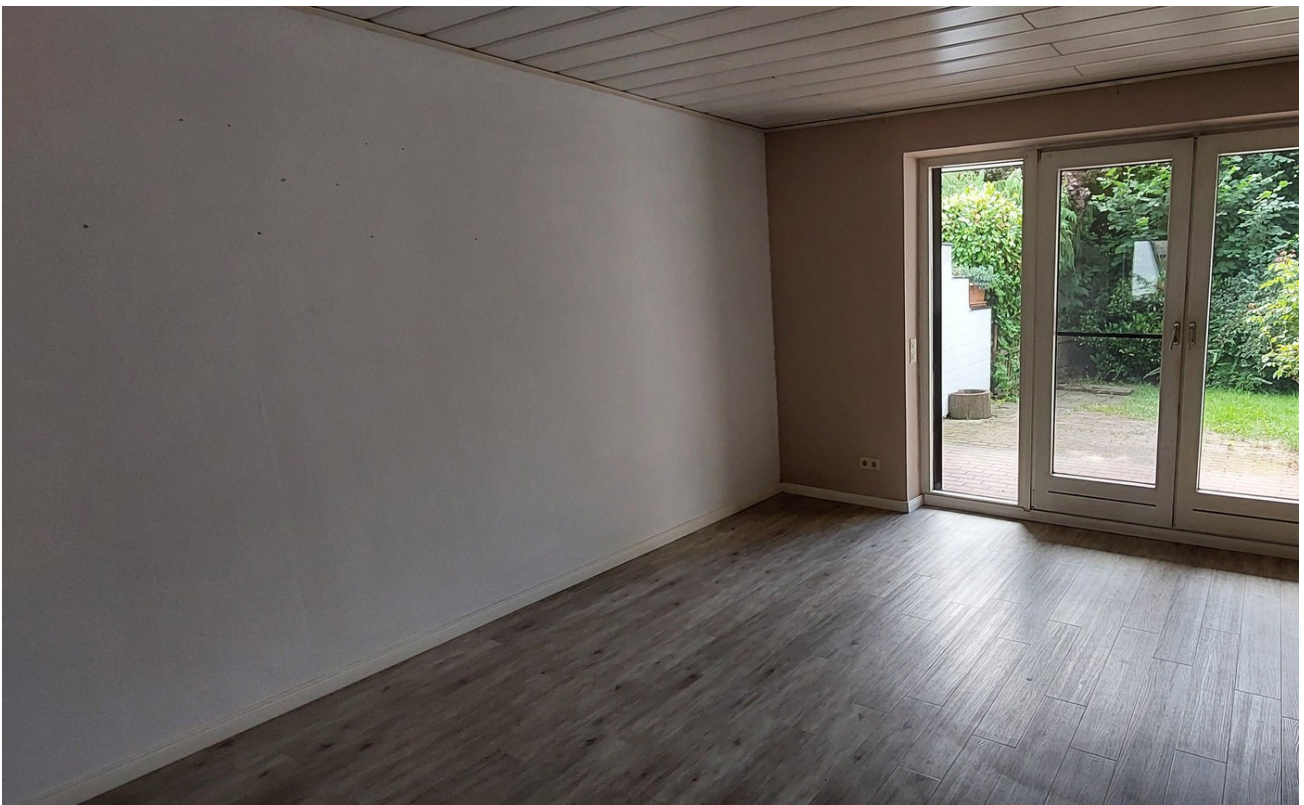
Esszimmer Blick zur Terrasse