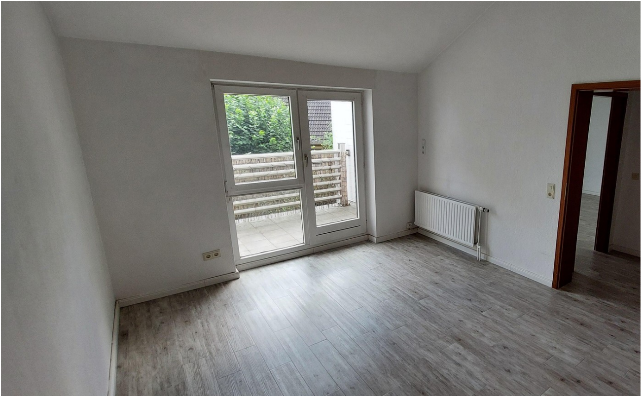
Schlafzimmer 2 mit Balkon