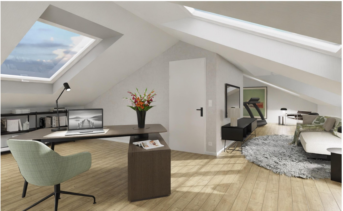
DG Ausbaureserve Variante