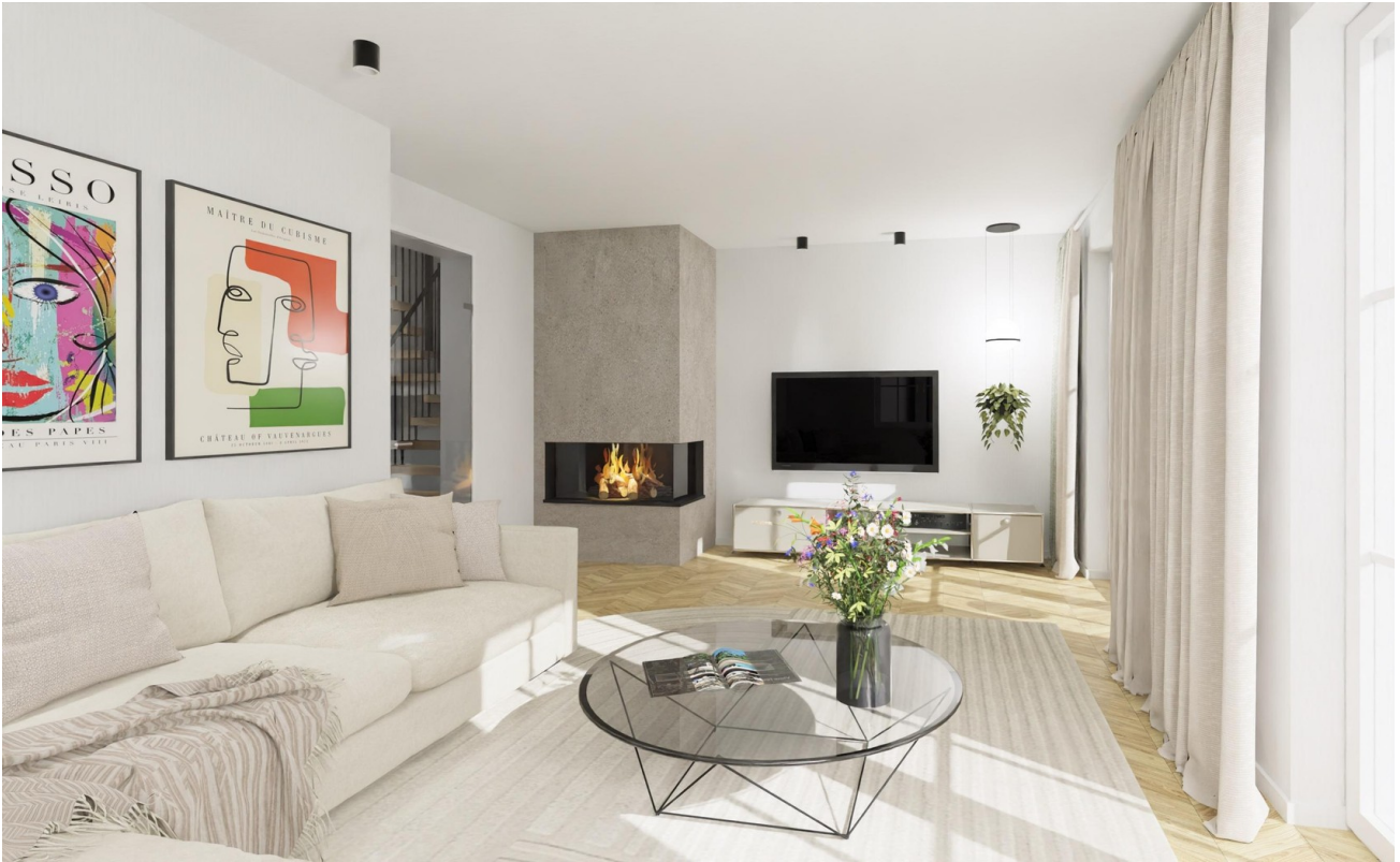
Wohnbereich (Var. 2)