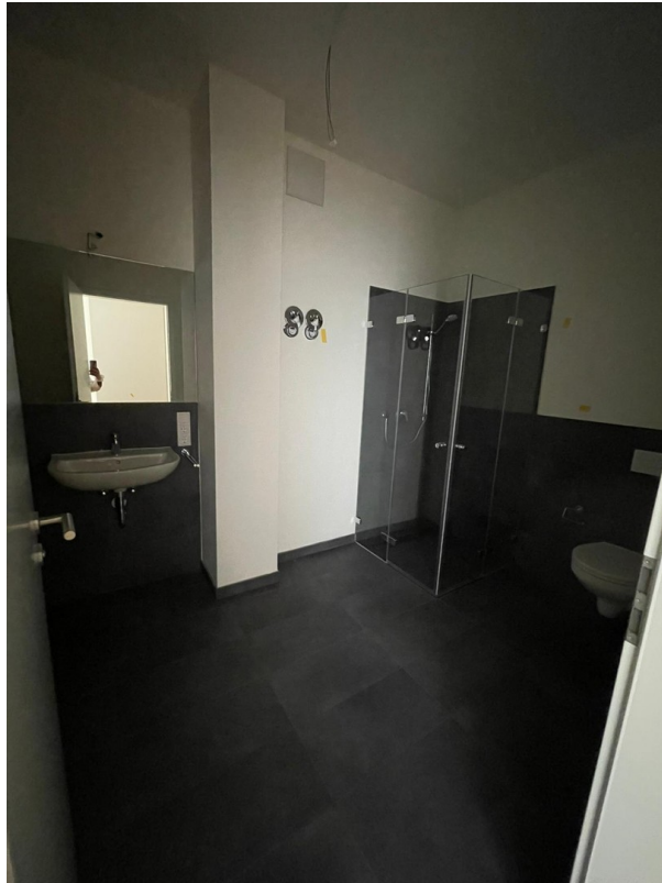
Bad mit Dusche und Badewanne