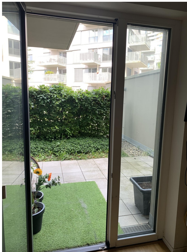
Garten blick von Zi-Opt