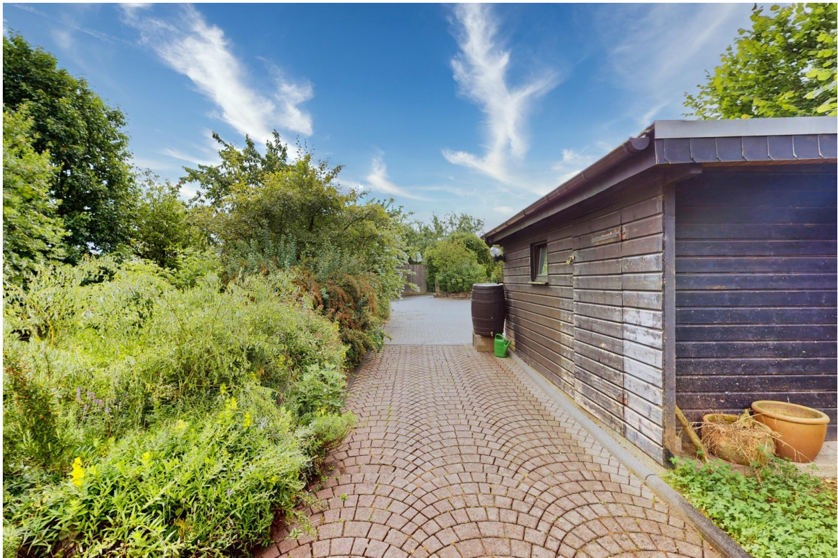
Zuweg / Schuppen