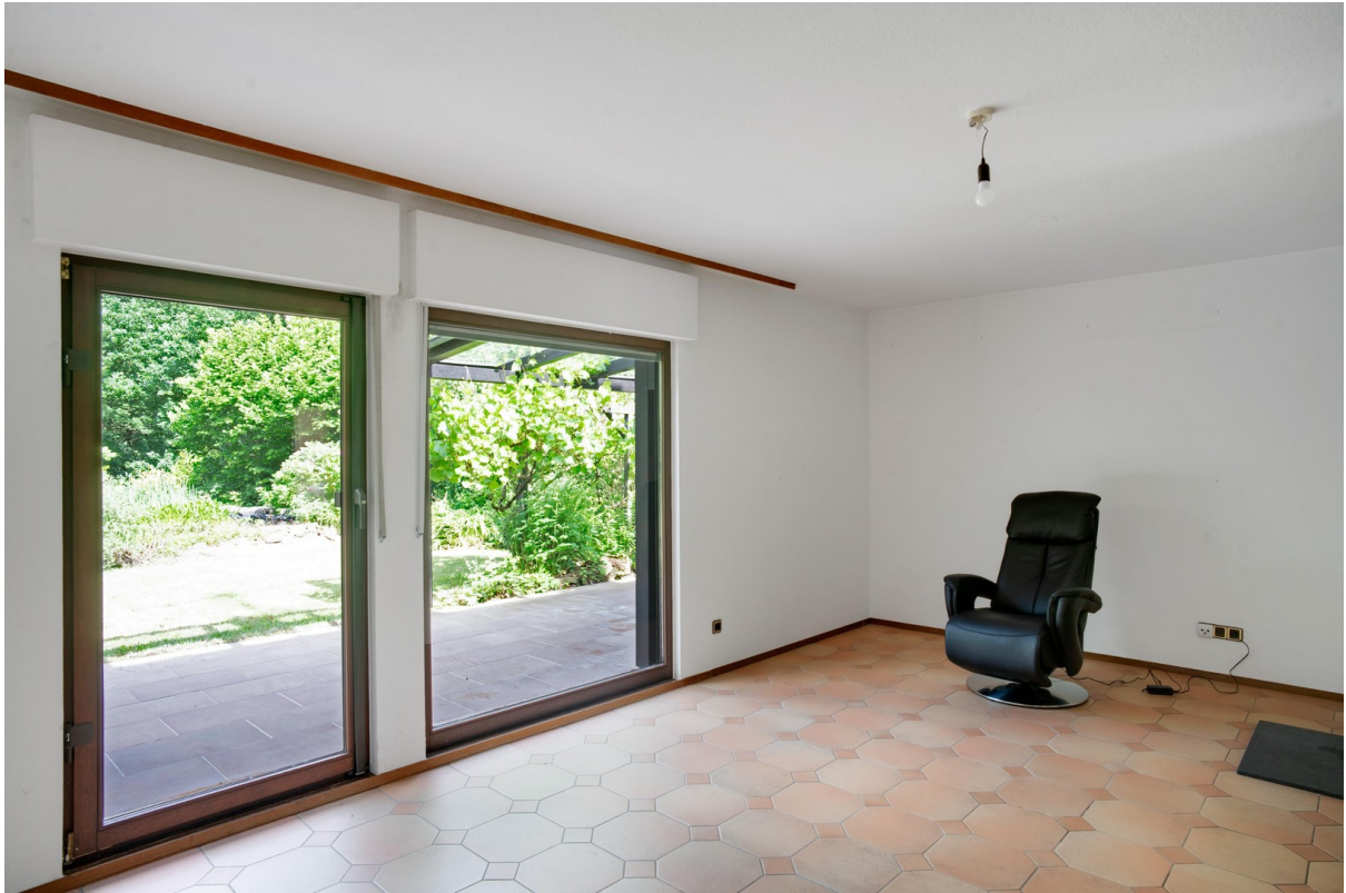
Wohnbereich mit Übergang