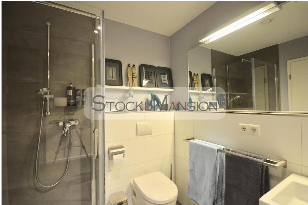
Stilvolles Bad mit Dusche