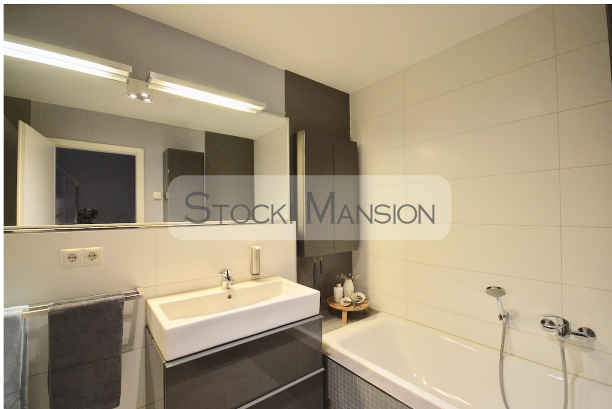
Modernes Vollbad mit Badewanne