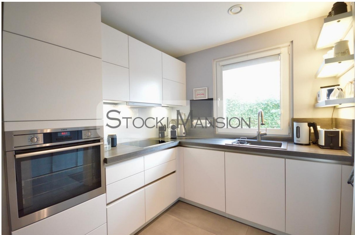
Einbauküche von Bauformat