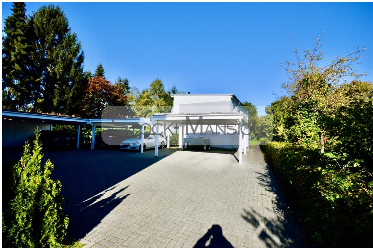
Hinterhof mit Stellplatzanlage