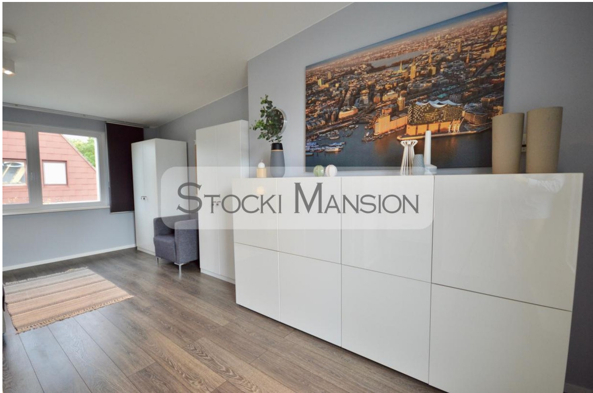
Studio mit viel Stauraum