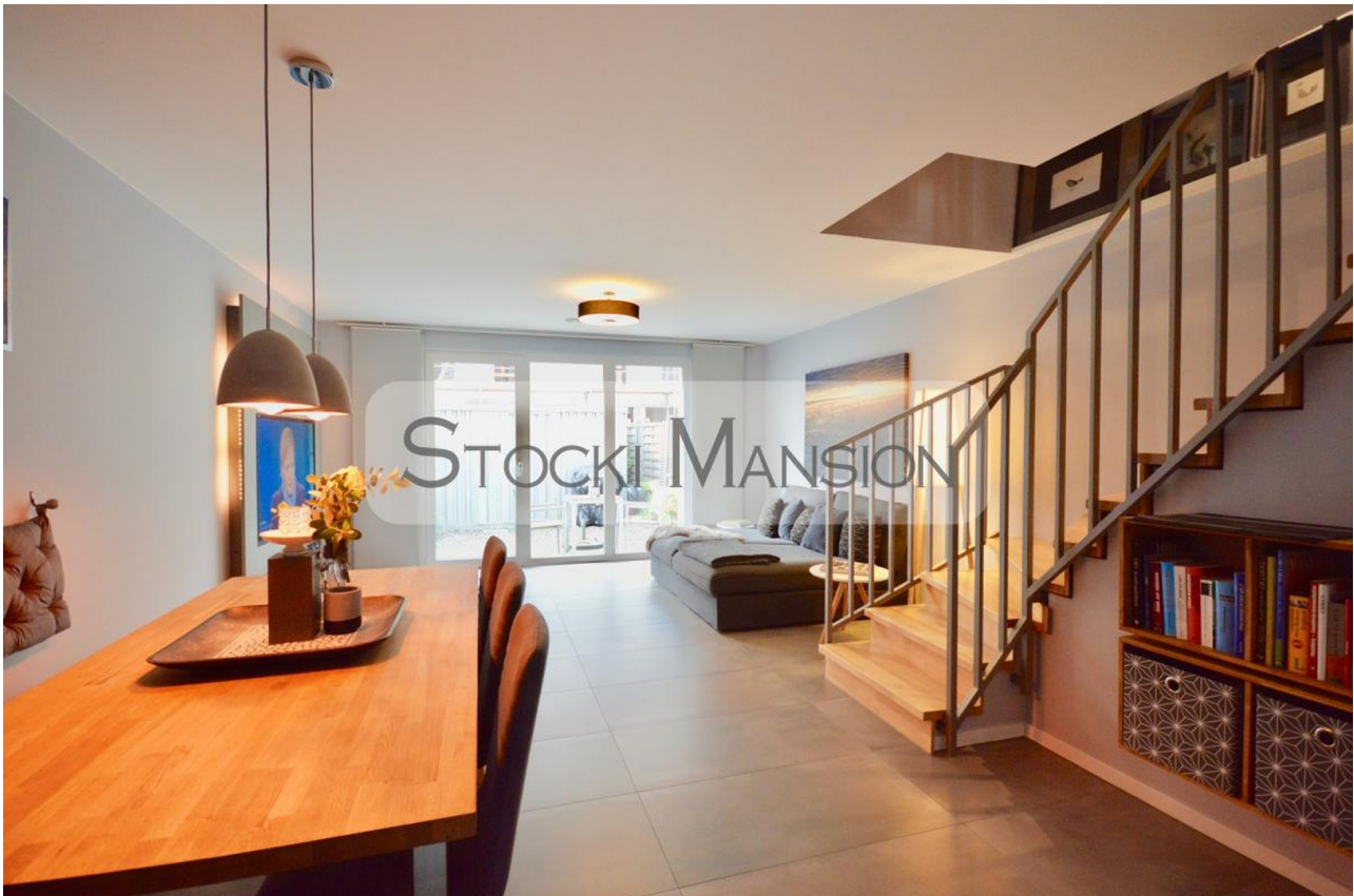
Helles Wohnzimmer mit Essecke