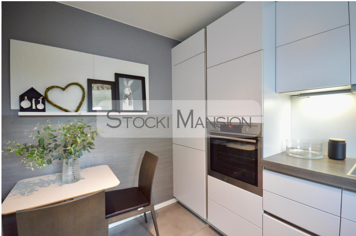
Hochwertige Küche mit Essplatz