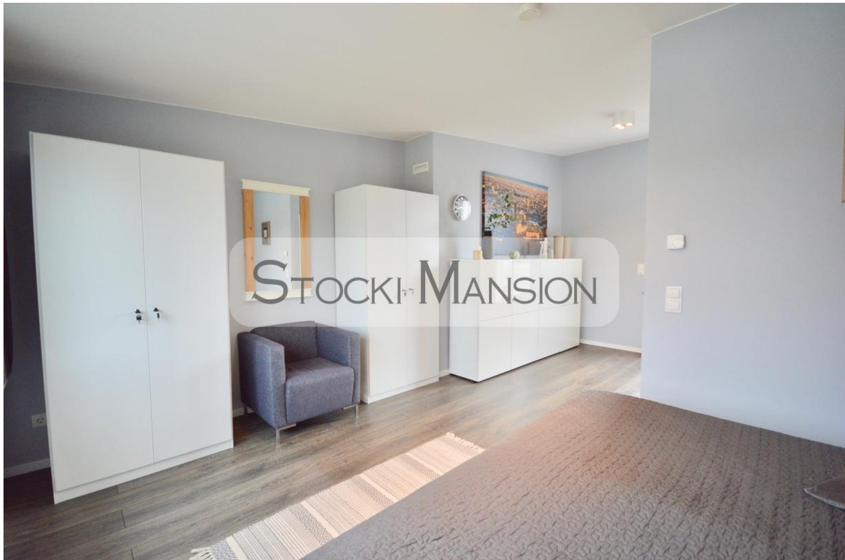
Studio mit Dachterrasse