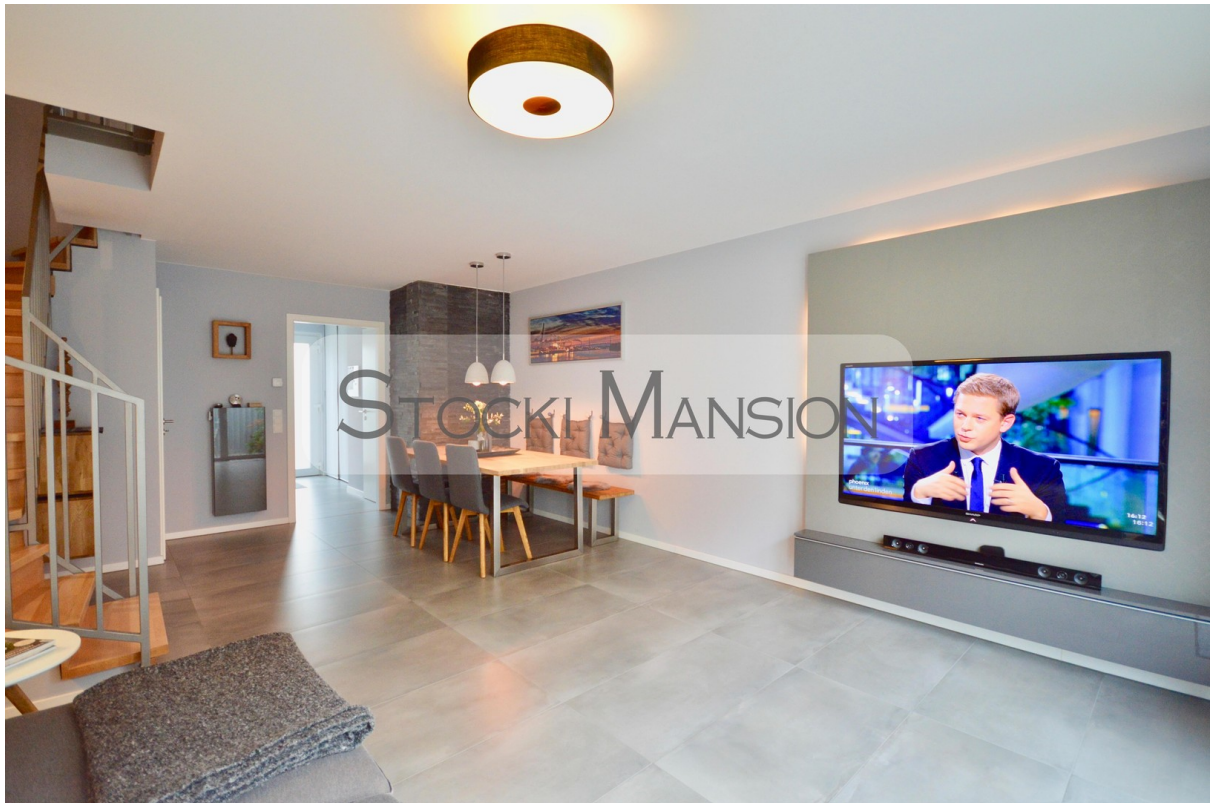
Wohnzimmer mit TV & Essplatz