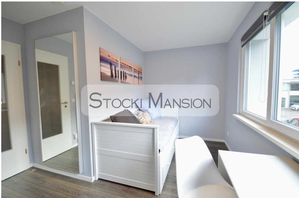
Schlafzimmer-2 hell & geräumig