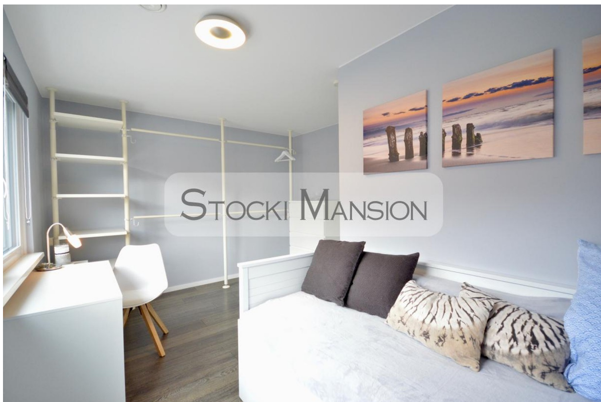
Schlafzimmer-2 m. Schreibtisch