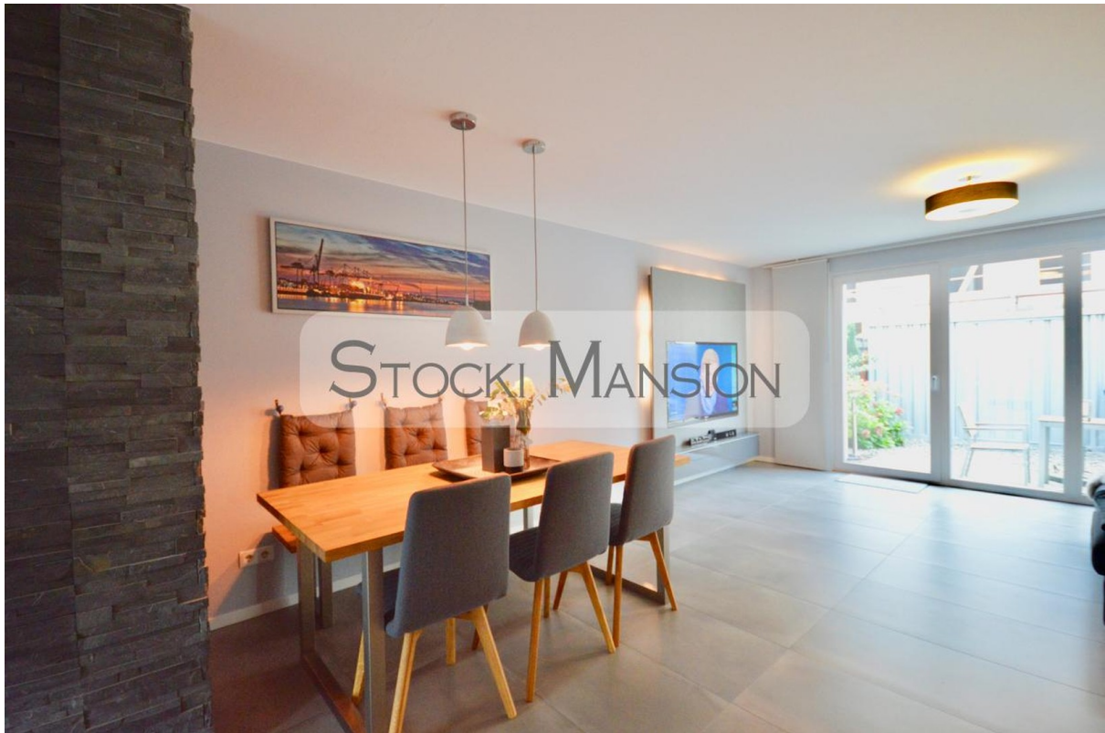
Gemütliche Essecke für 6 Pers.