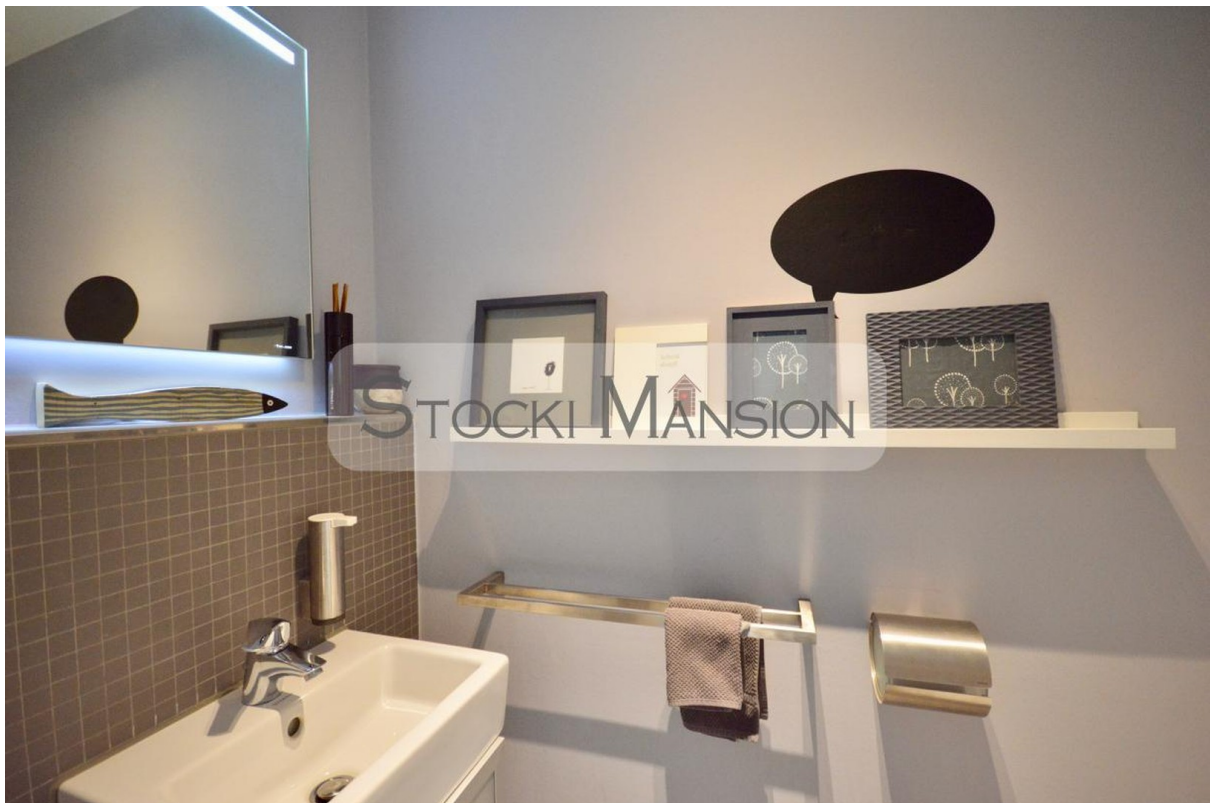
Trendiges Gäste-WC im EG