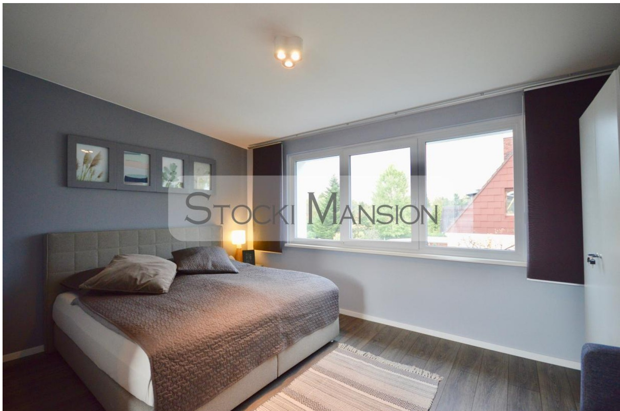
Masterbedroom im Studio