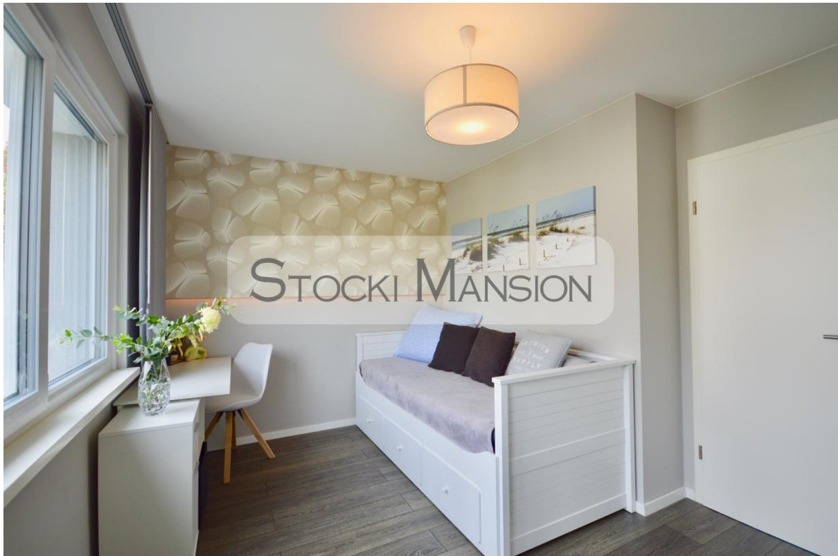
Schlafzimmer-1 m. Schreibtisch