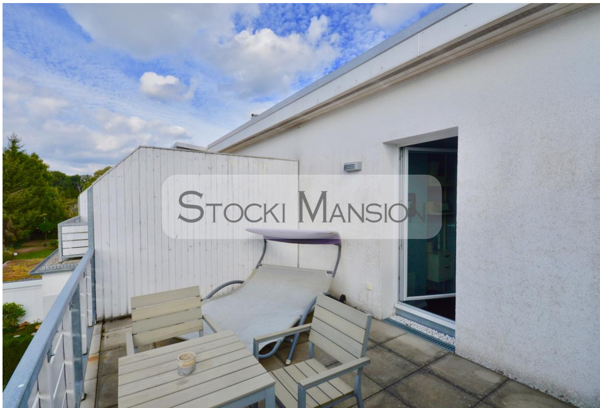
Gemütliche Dachterrasse im DG