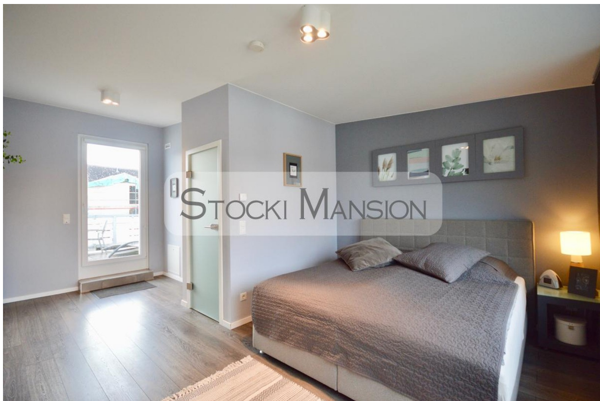
Schlafzimmer-3 im Studio