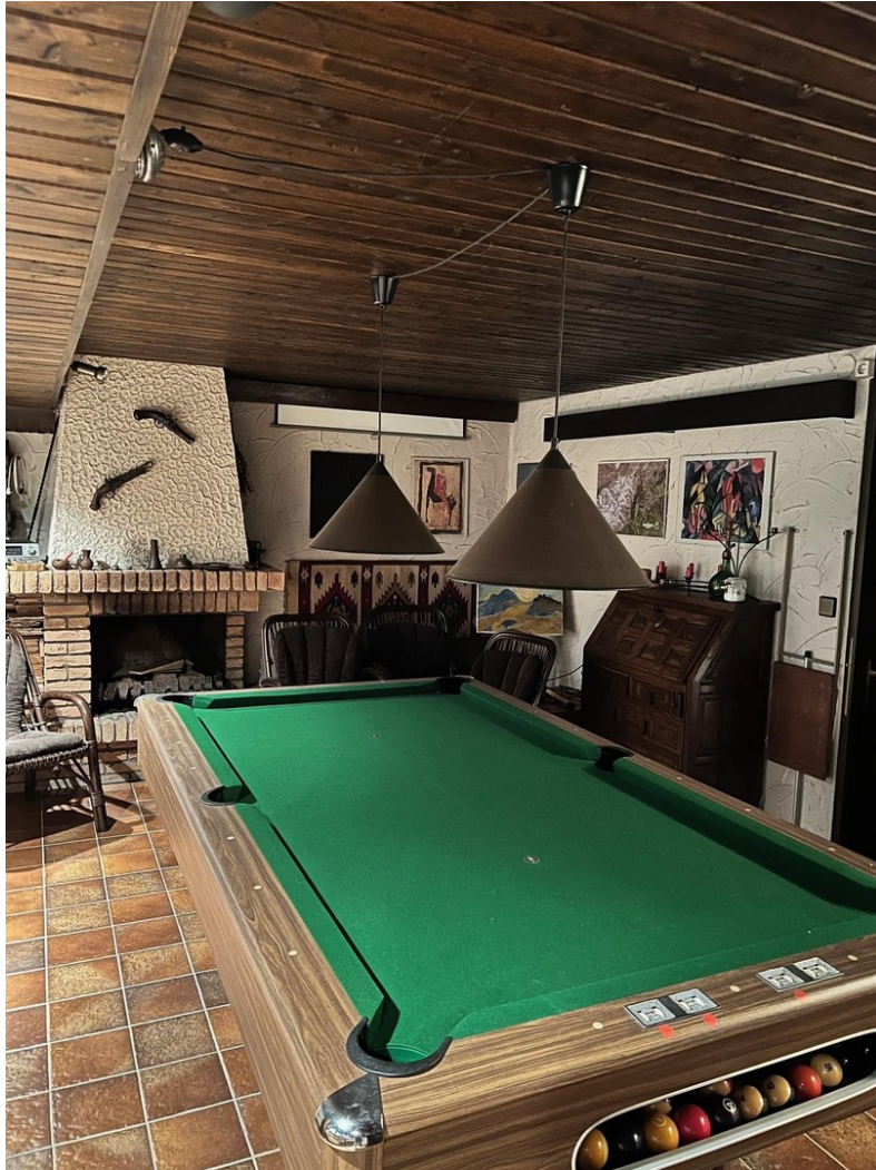
Partyraum m. Billard und Kamin