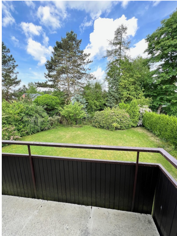
Balkon-Blick in den Garten