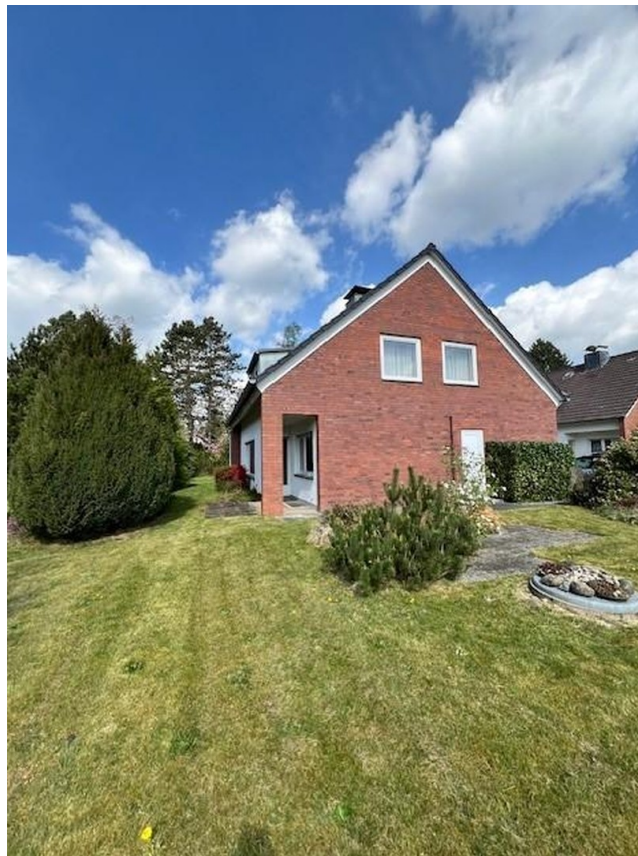
Hausansicht mit Vorgarten