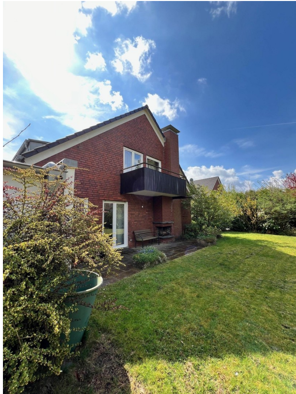
Terrasse und Außenkamin