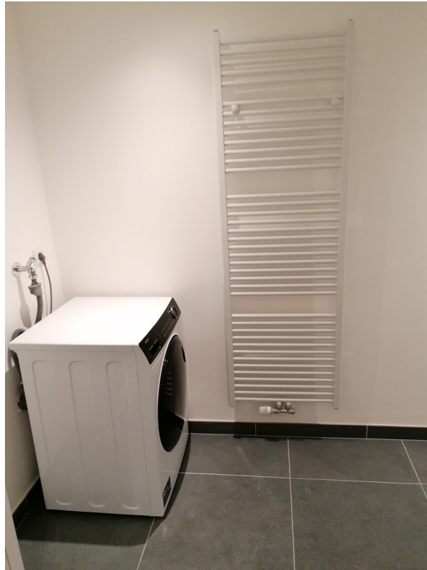
2 Bäder mit 2 Waschmaschinen