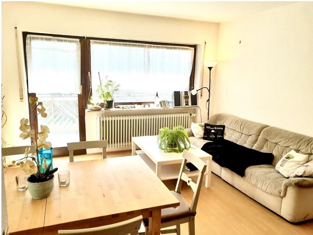
So wohnt der Frühling