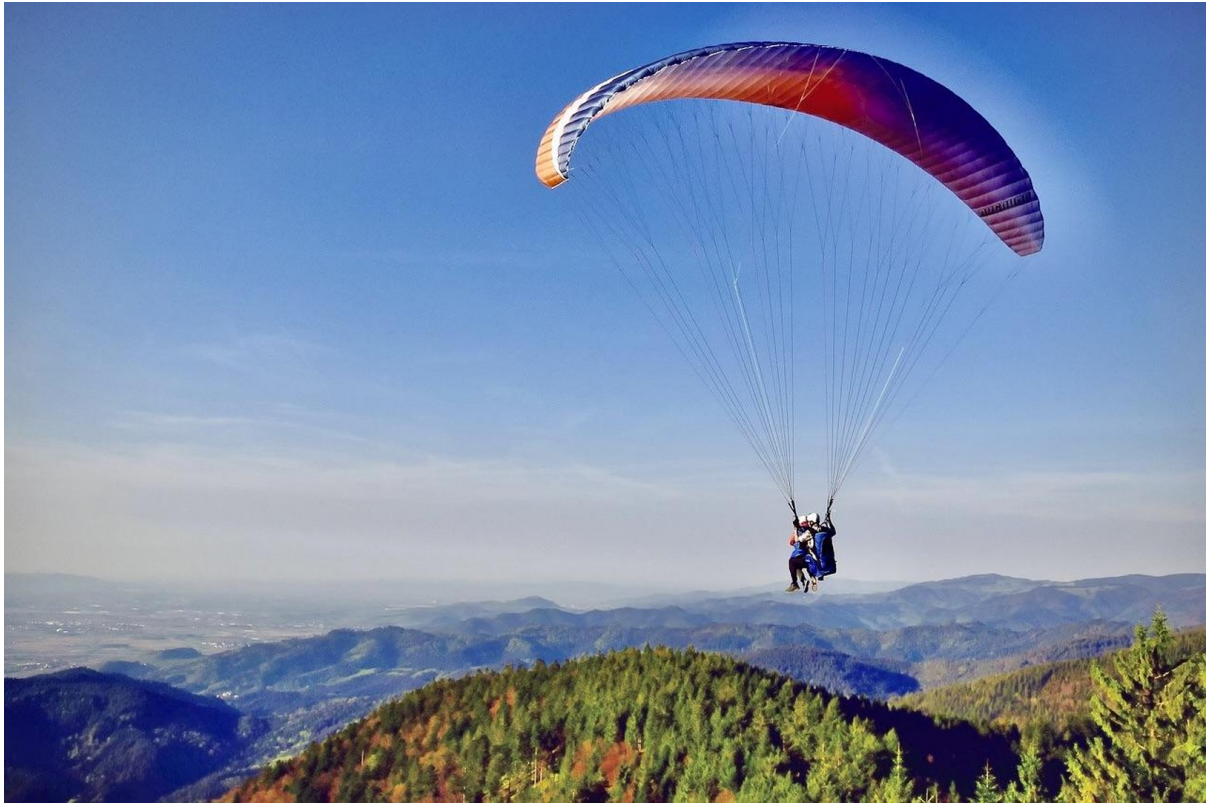
Paragliding vor der Tür