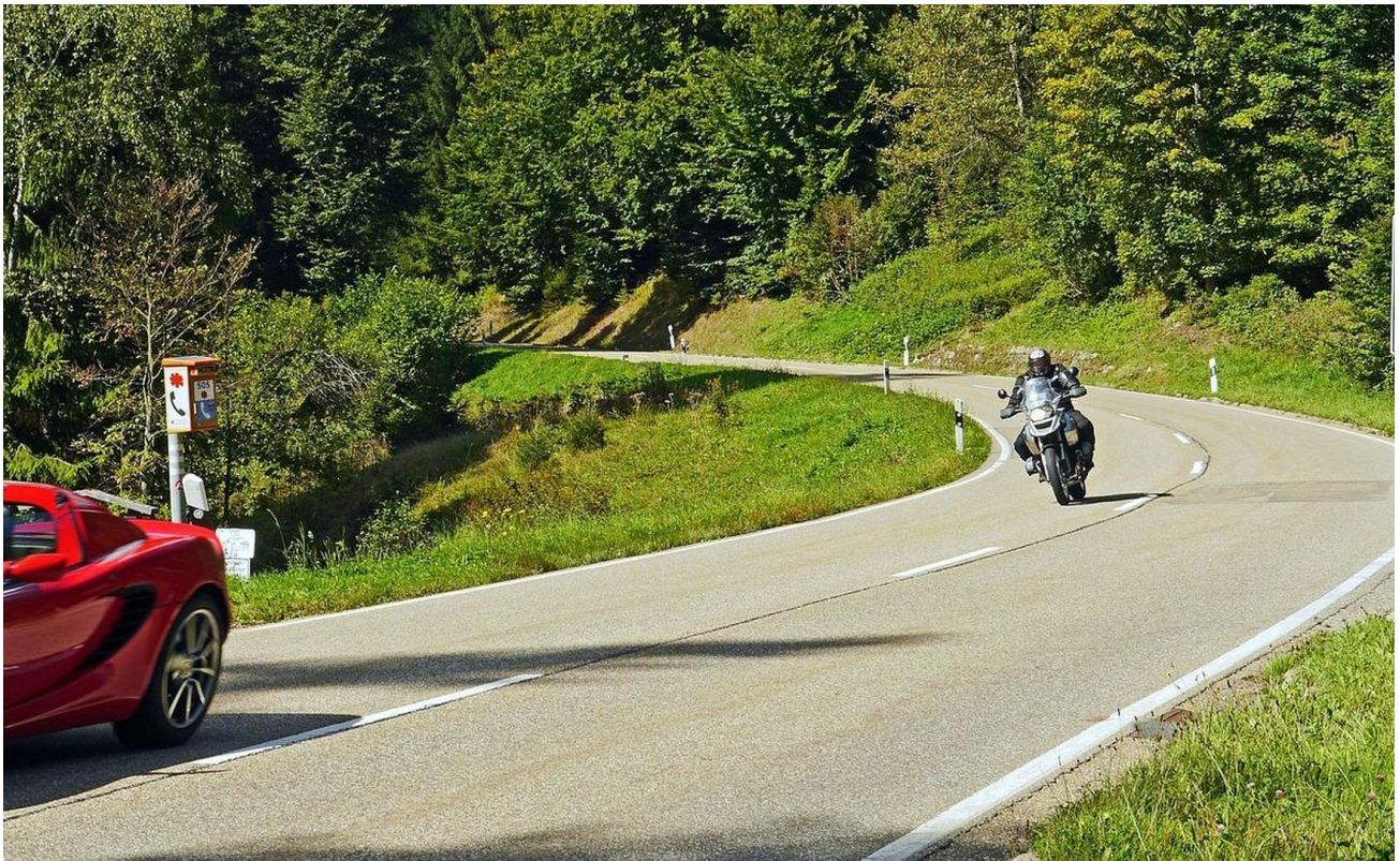
Cruisen um Schwarzwald