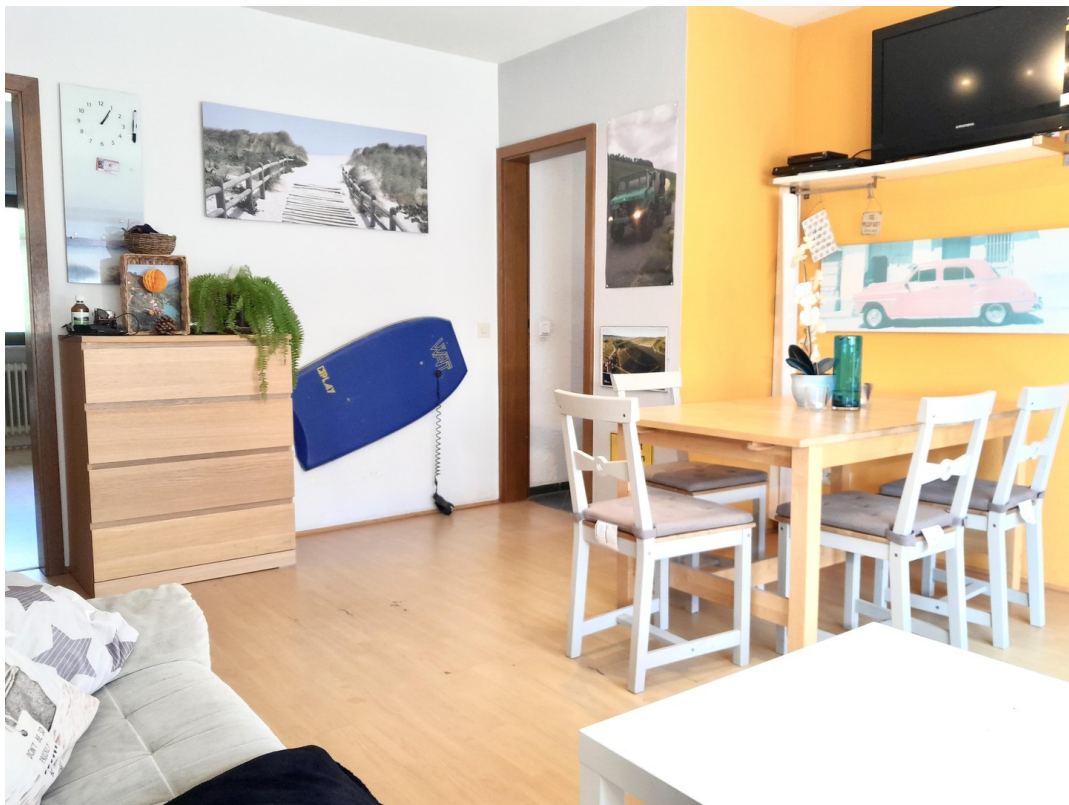
Entspannen im Alltag