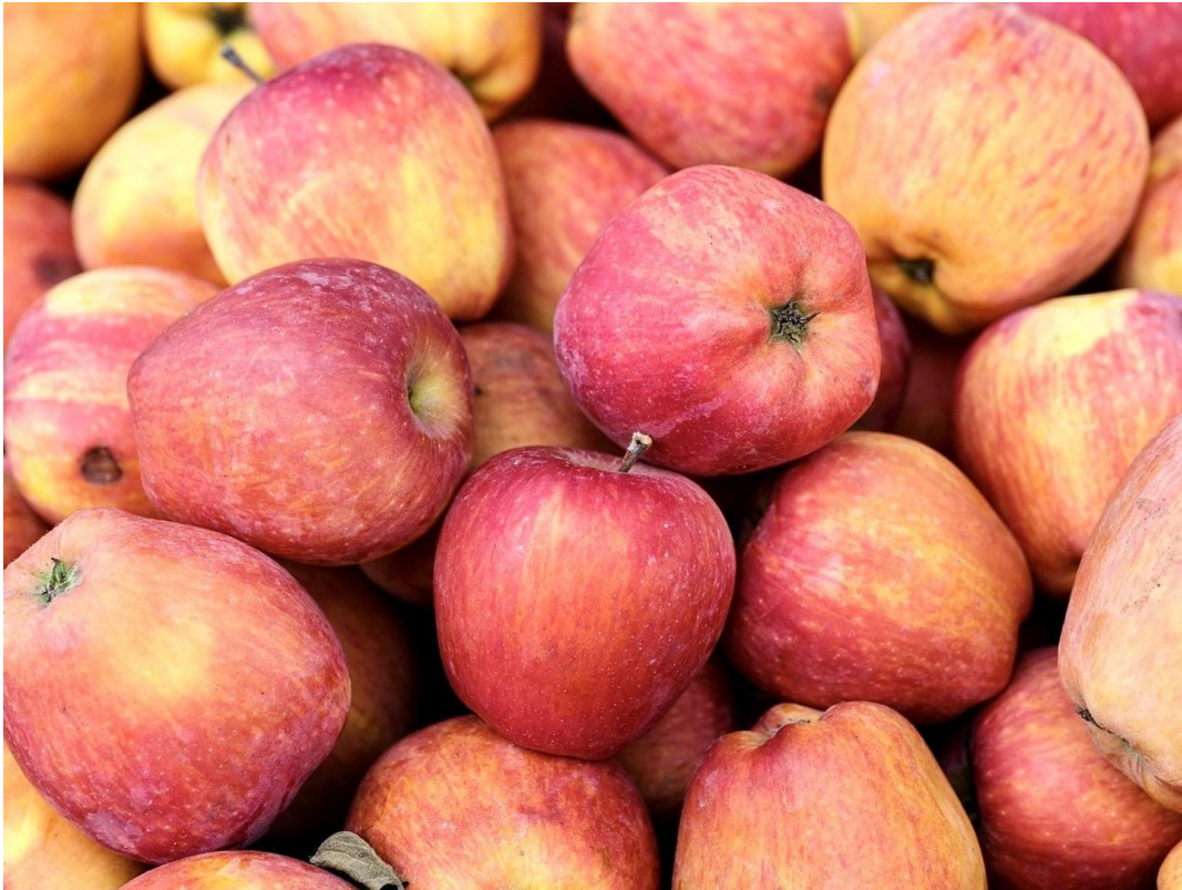
Bitte nur Fallobst!