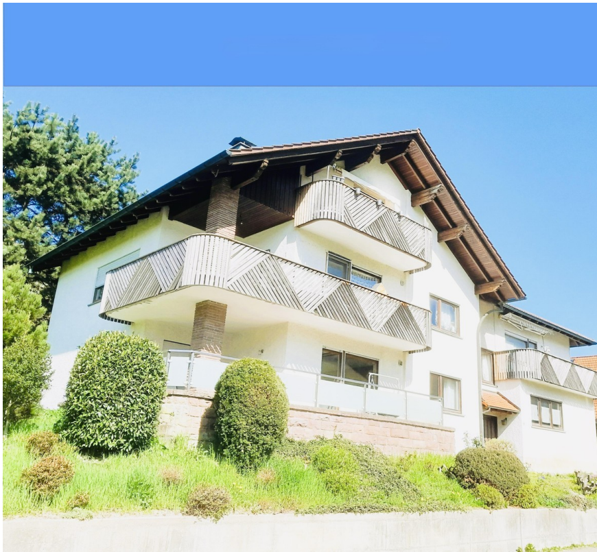
Dein neues Zuhause