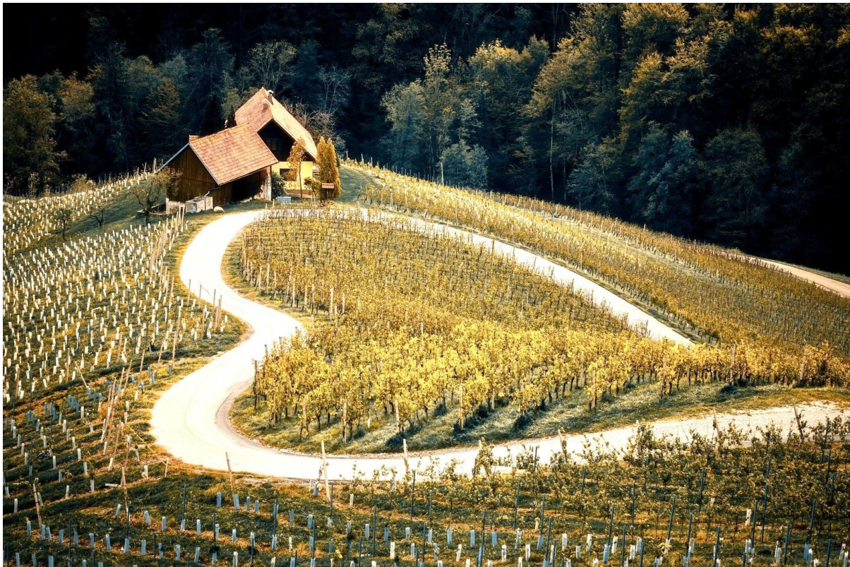
Idylle trifft Wohnkomfort