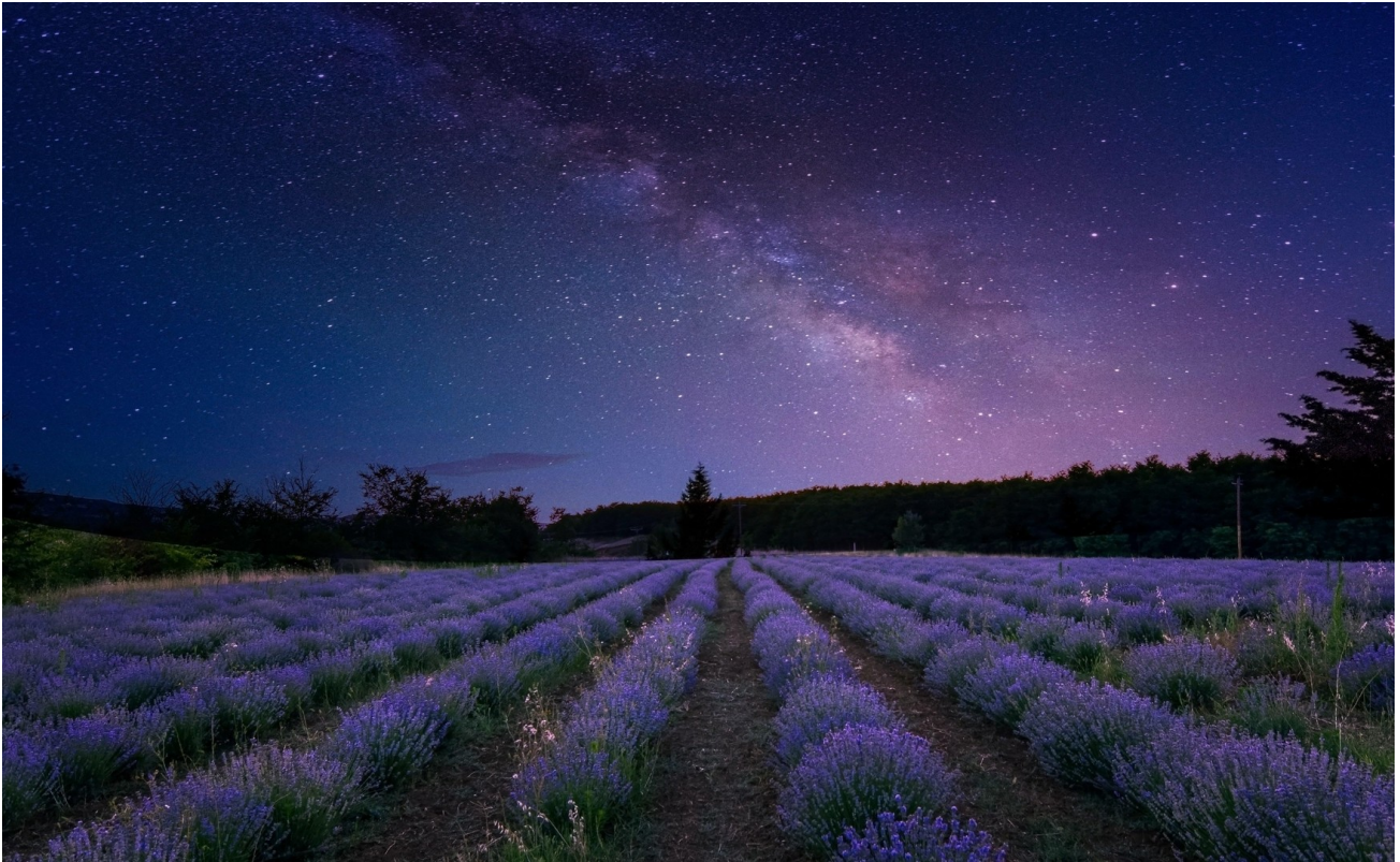
Für deine Nachtruhe