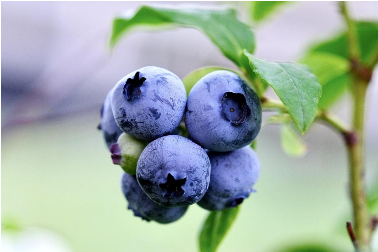
Pflücken am Straßenrand