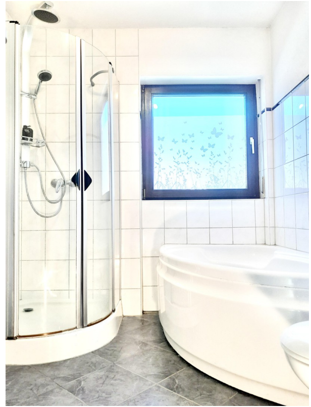
Duschen im Alltag