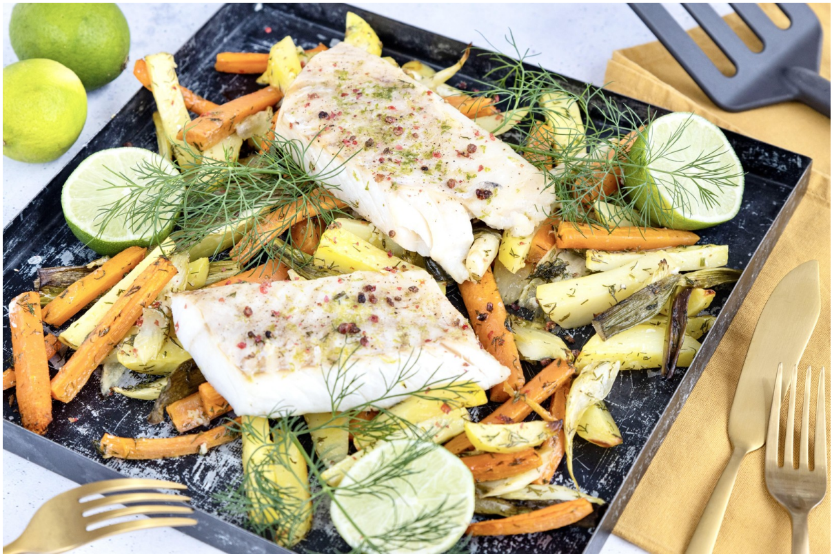
Genial zum kochen