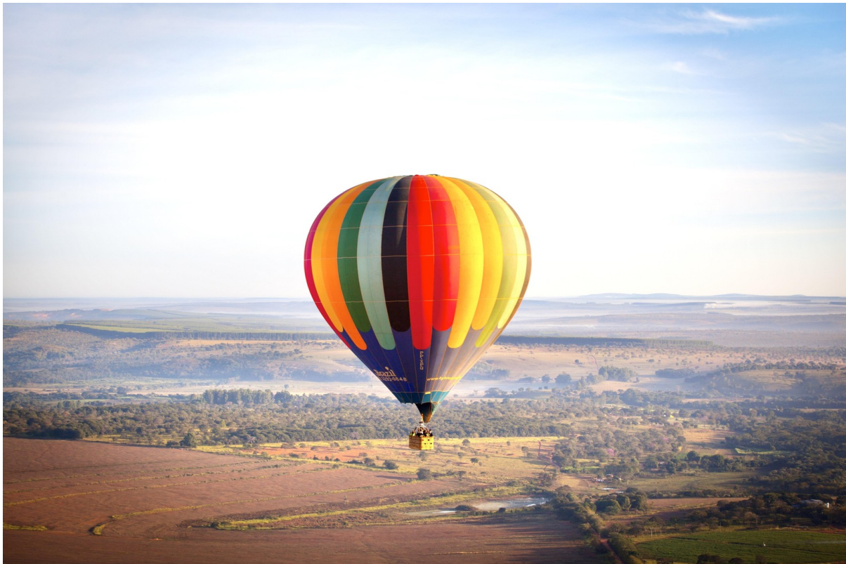
Vogesen vis-à-vis Schwarzwald