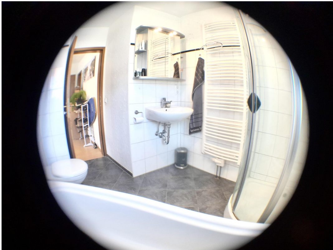
Schaumbaden im Winter