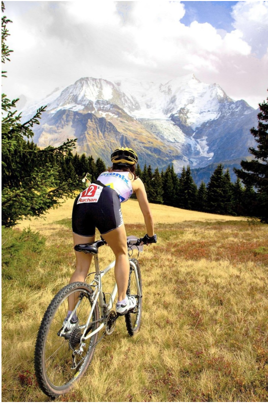
Mountainbiken vor der Haustür