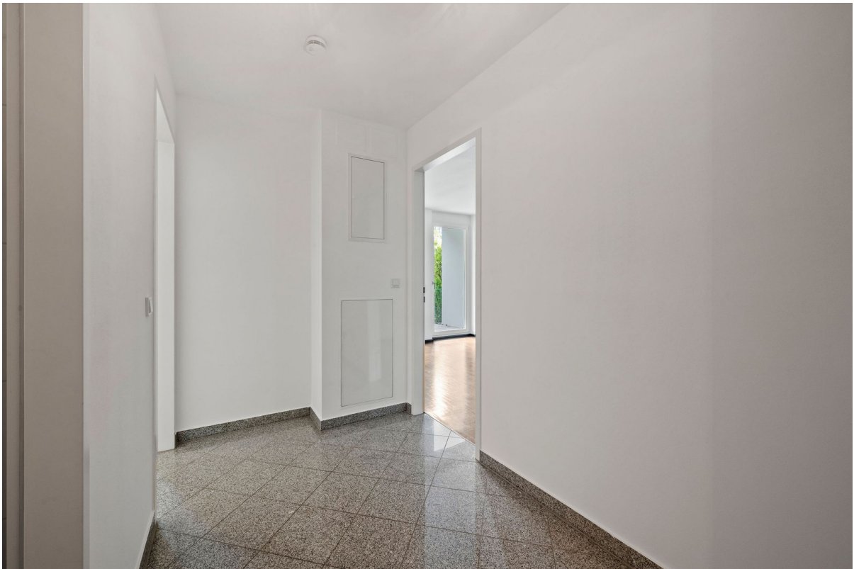
Flur - 2