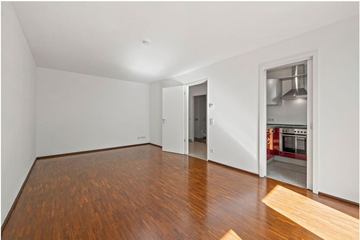
Wohnzimmer - 2