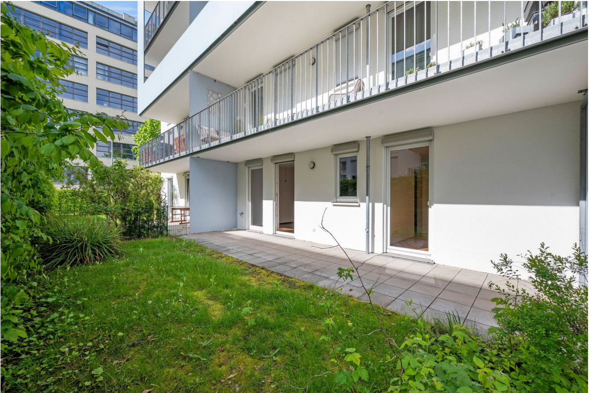
Terrasse - 2