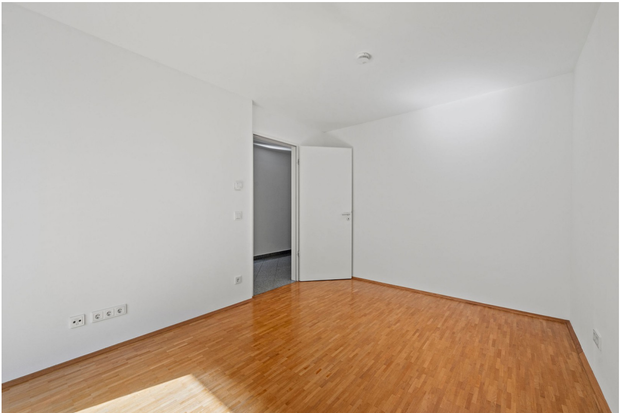
Schlafzimmer - 2