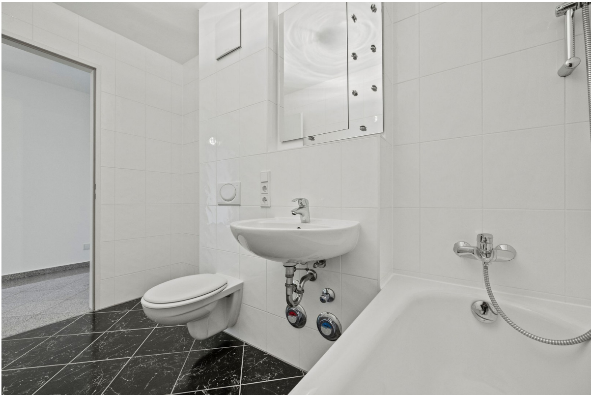
Bad - 2