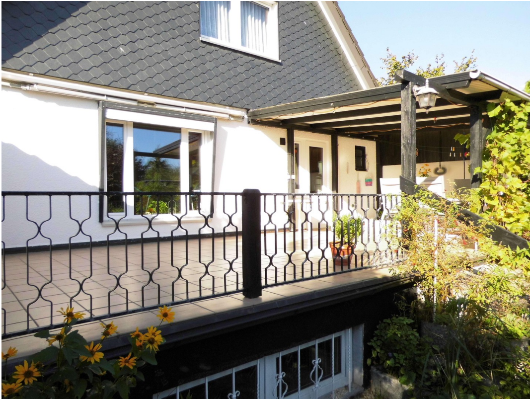
Ansicht Terrasse Süden