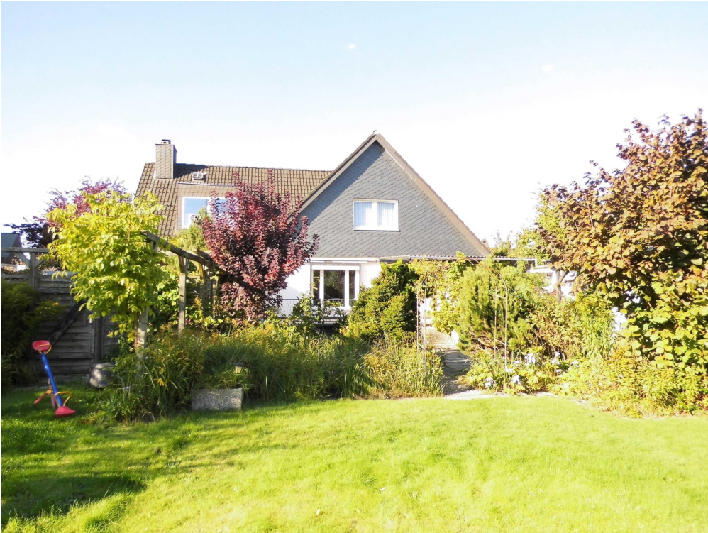
Ansicht vom Garten