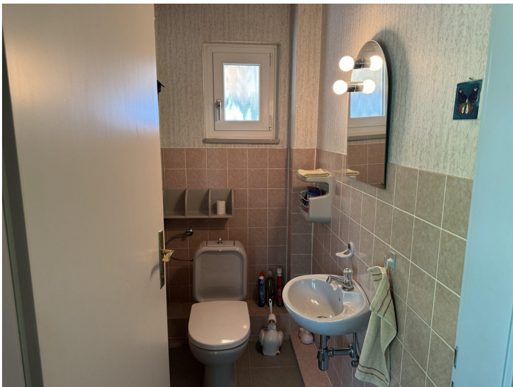
EG Gäste WC