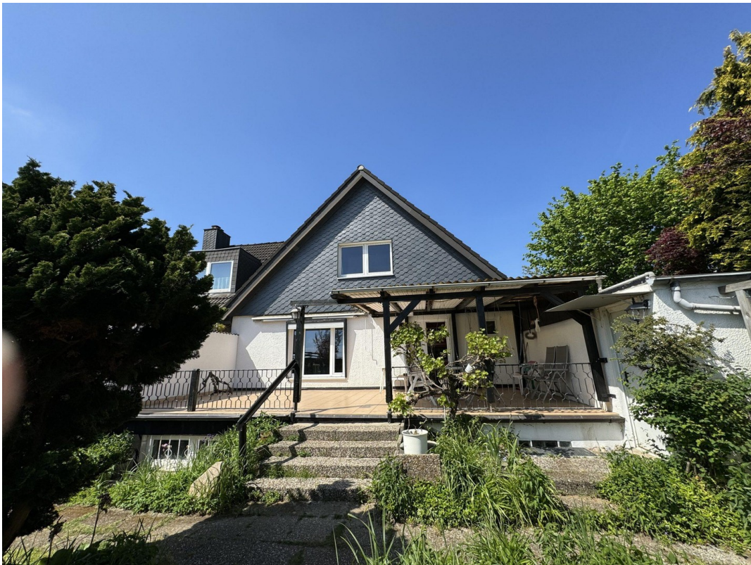
Ansicht vom Garten