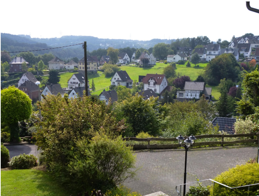
Fernblick - und noch viel mehr