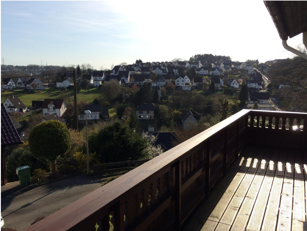
Fernblick - und noch viel mehr