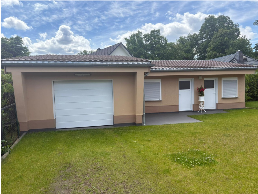
Remise mit Garage