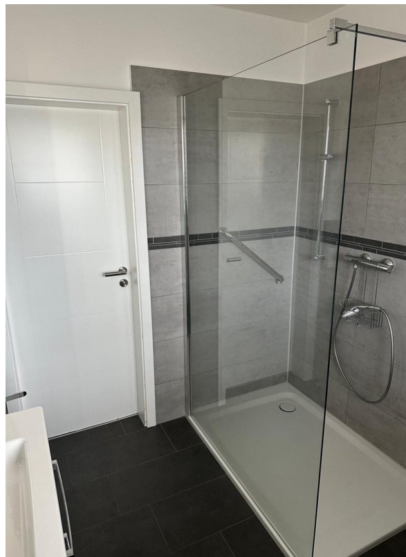
begehbare große Dusche