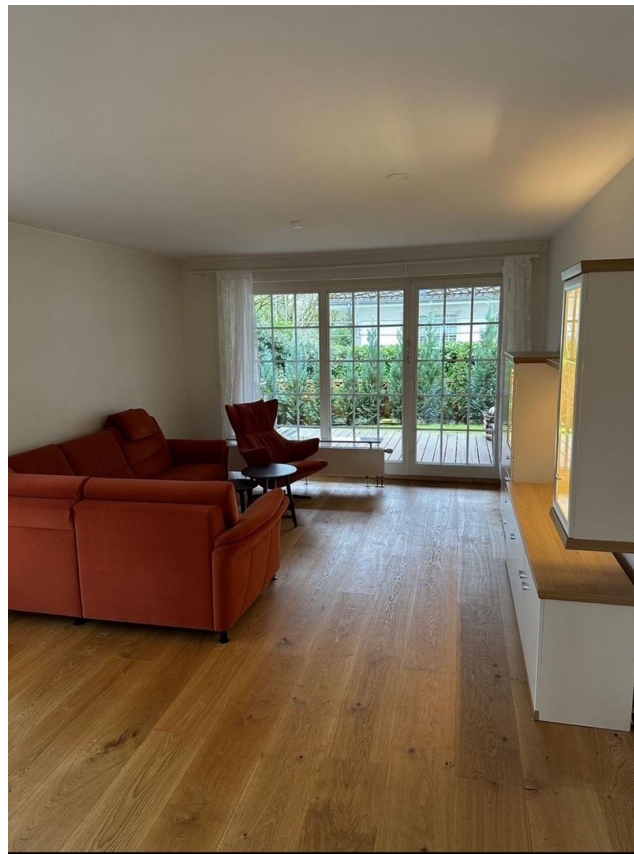
Wohnzimmer mit Ausblick