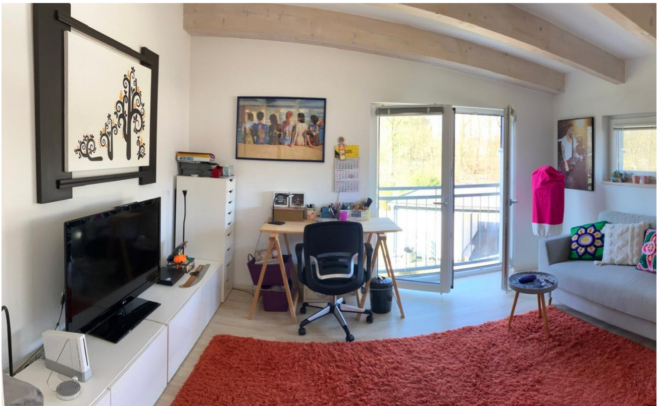
Kind I / Arbeiten / Gäste