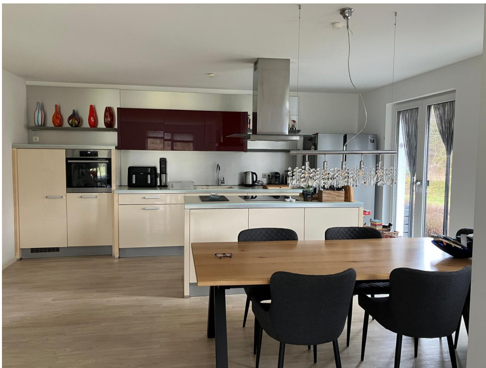
Küche mit Kochinsel