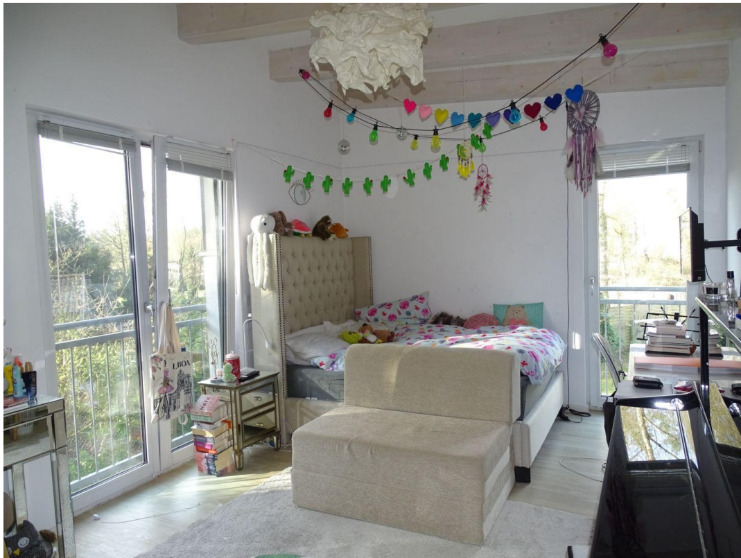
Kind II / Arbeiten / Gäste