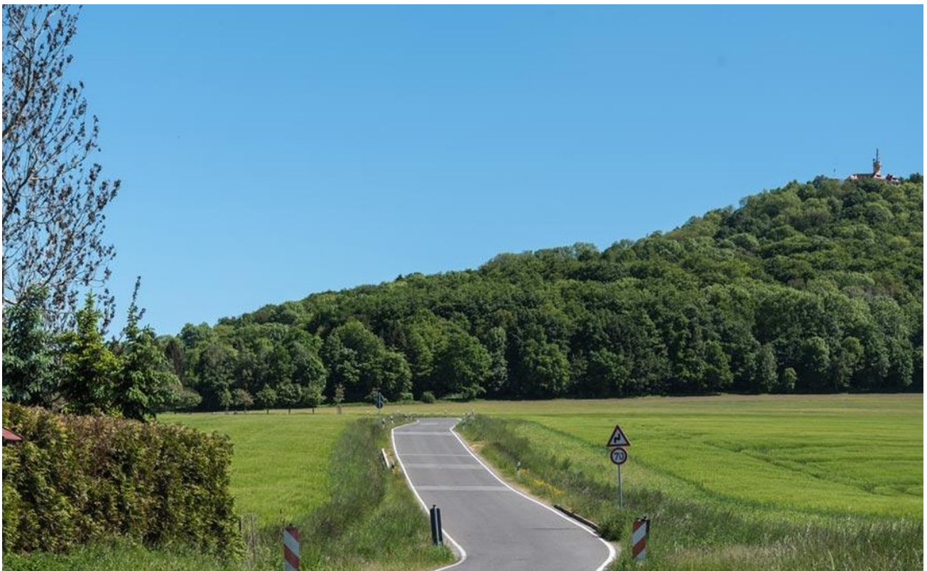
Lage: direkt am Hausberg