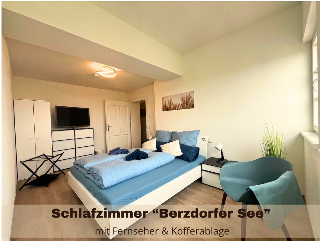
Schlafzimmer "Berzdorfer See" mit Fernseher & Kofferablage