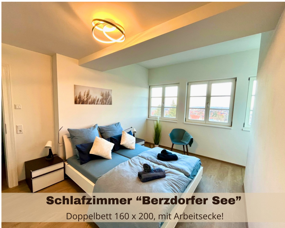
Schlafzimmer "Berzdorfer See" Doppelbett 160 x 200, mit Arbeitsecke!