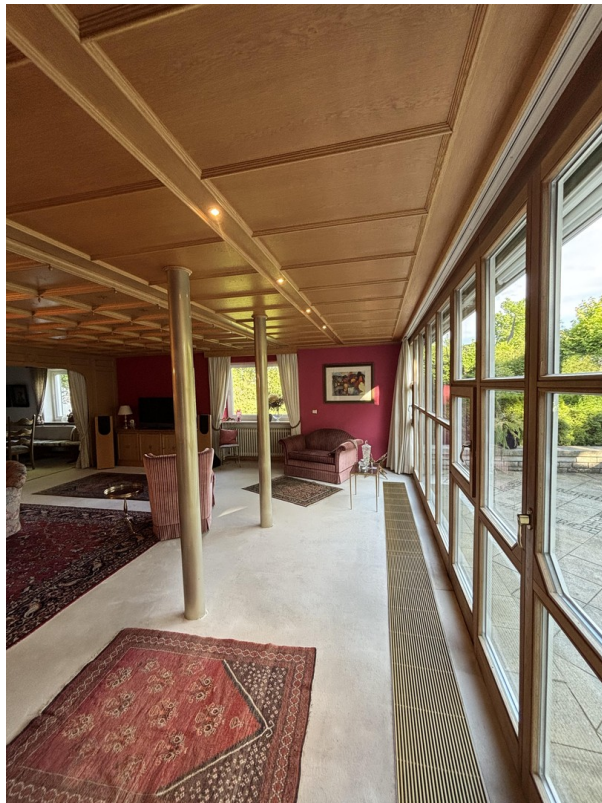
Wohnzimmer EG (1/2)