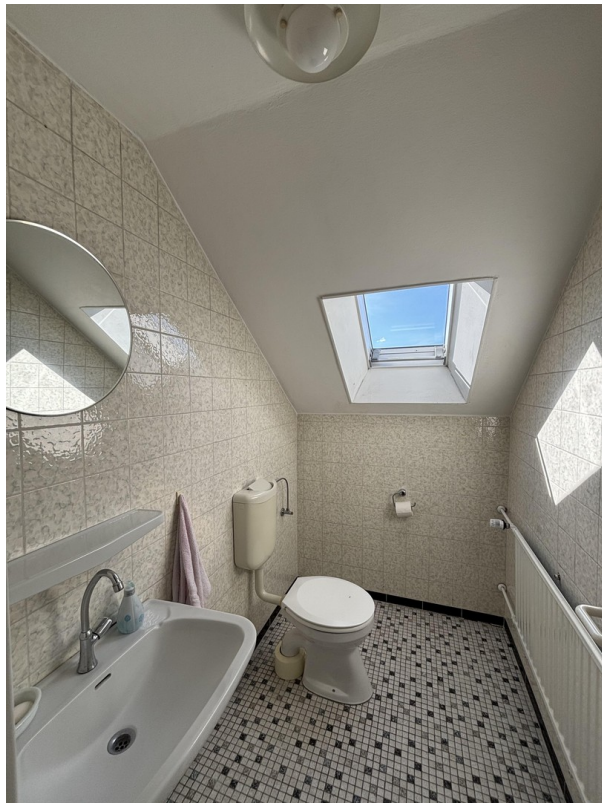
Toilette klein OG