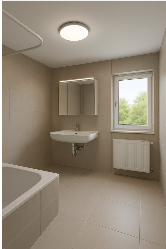
Bad groß OG animiert