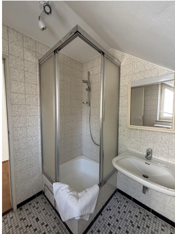
Bad klein OG