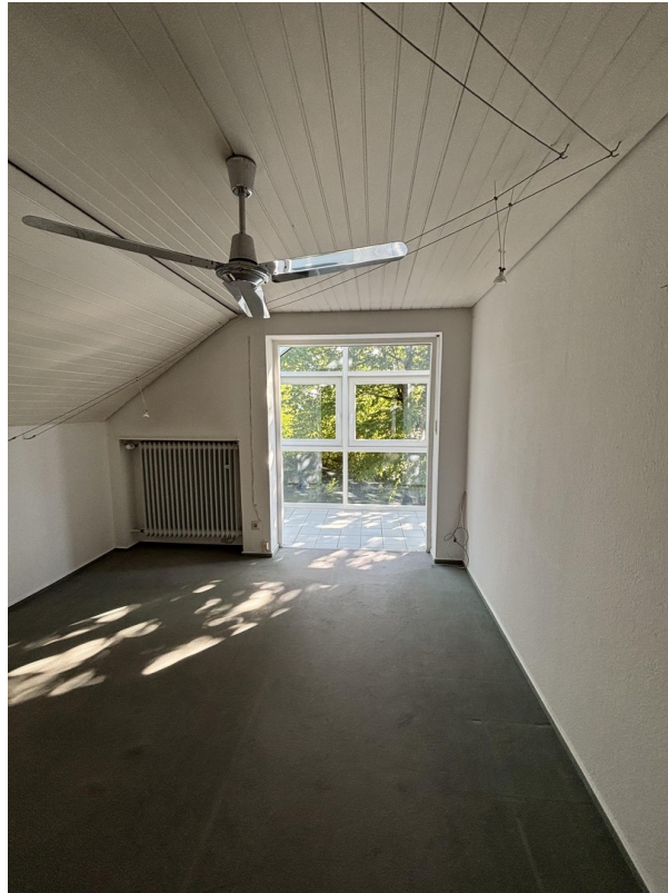
Kinderzimmer I OG