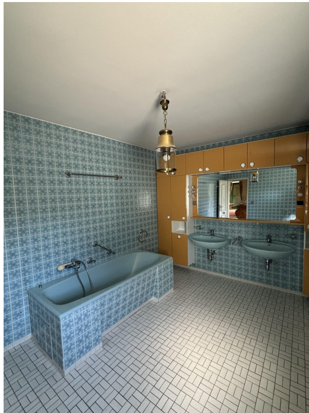
Bad I EG