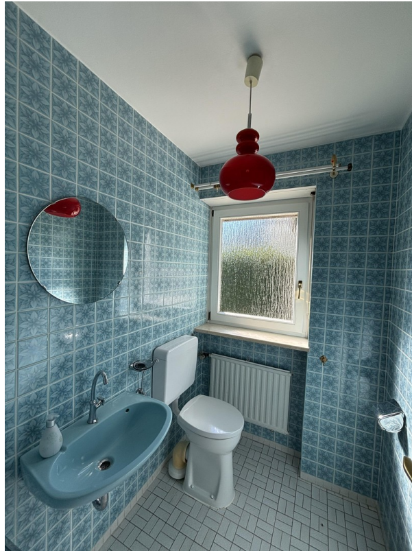
Toilette I EG