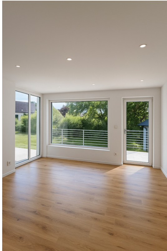
Wohnzimmer OG animiert