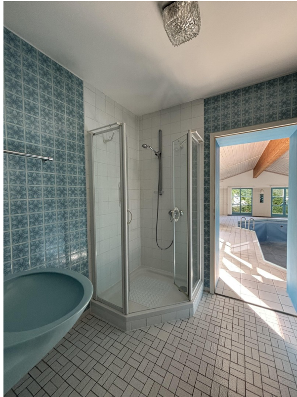
Bad II EG