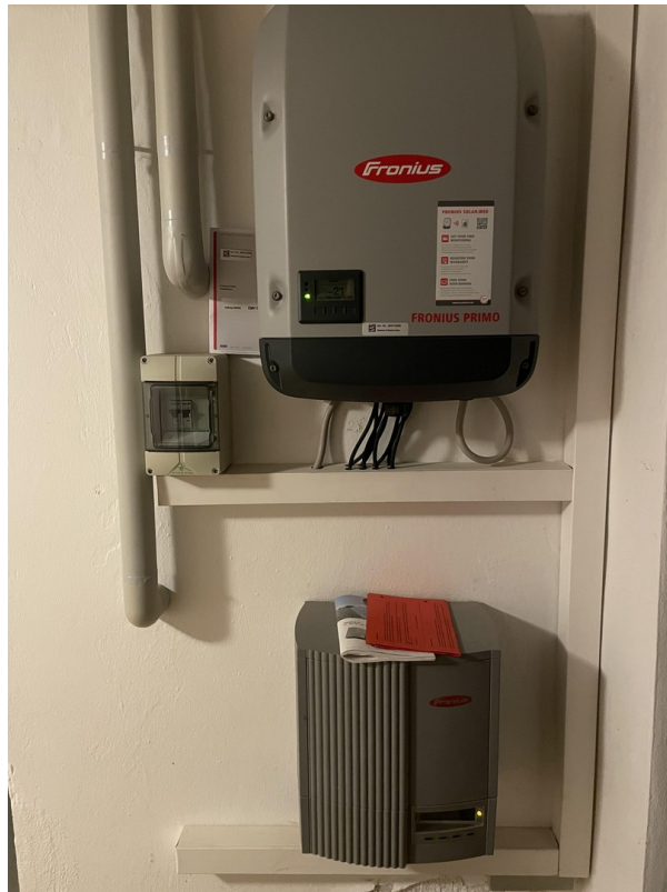
Wechselrichter Solar KG