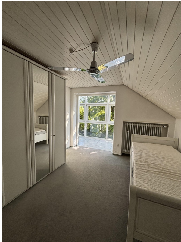
Kinderzimmer II OG