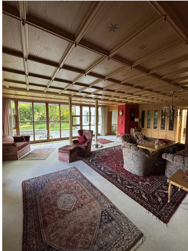
Wohnzimmer EG (2/2)