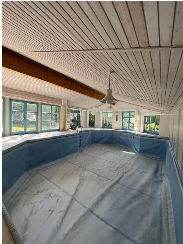
Pool EG (1/2)