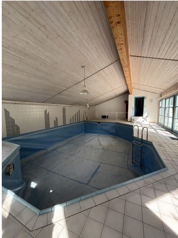
Pool EG (2/2)