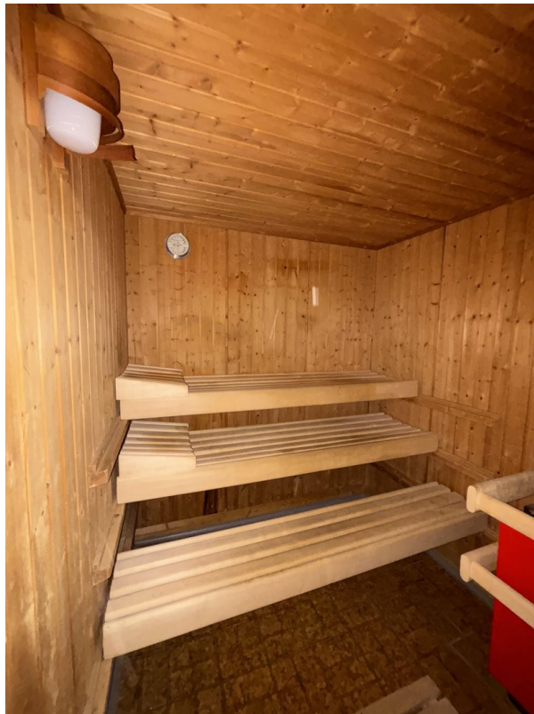
Sauna KG (2/2)