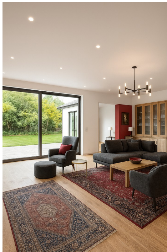
Wohnzimmer EG animiert