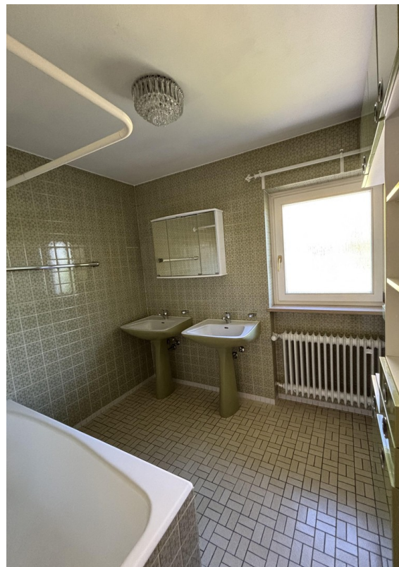
Bad groß OG