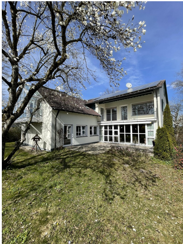
Rückansicht inkl. Solaranlage