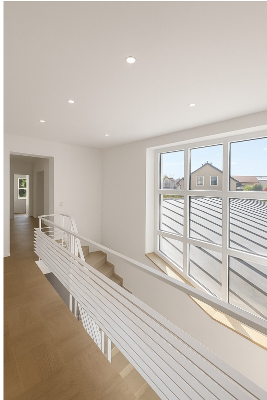
Flur OG animiert