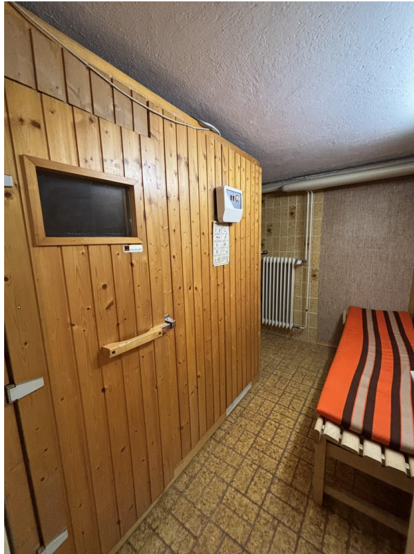
Sauna KG (1/2)