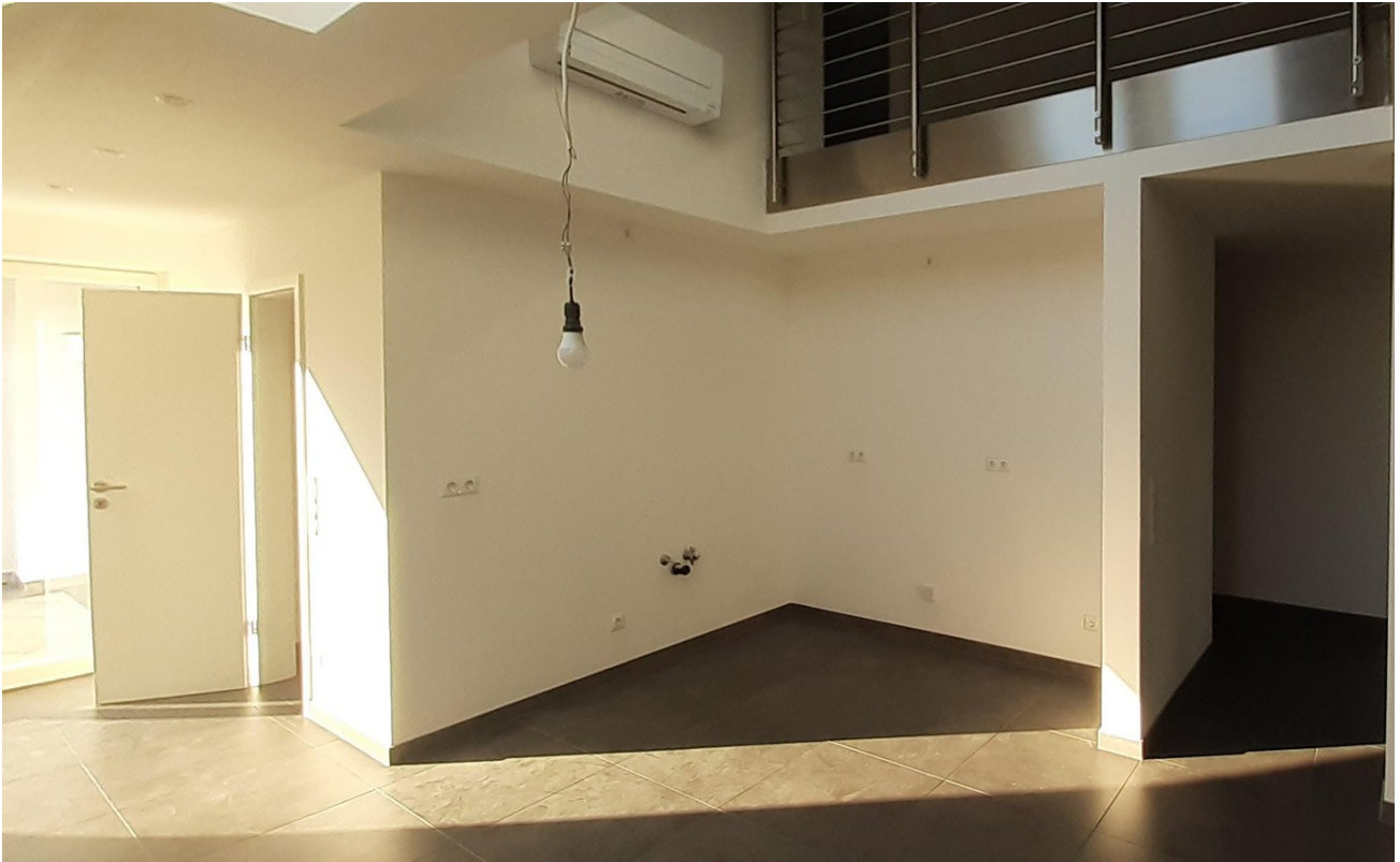
Küche ohne Möbel