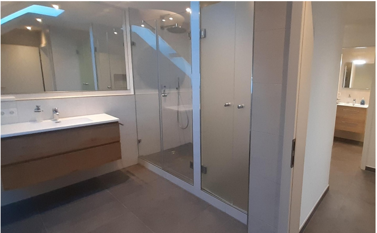
Bad mit Waschmaschinenzimmer