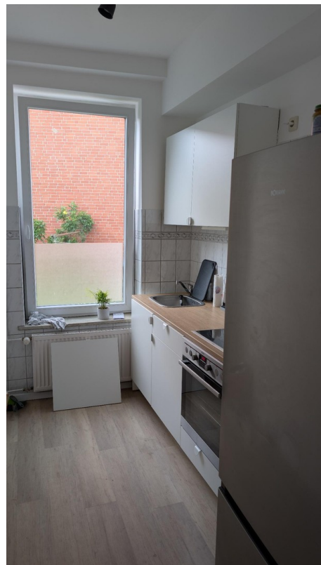
Küchenmöbel und Elektrogeräte