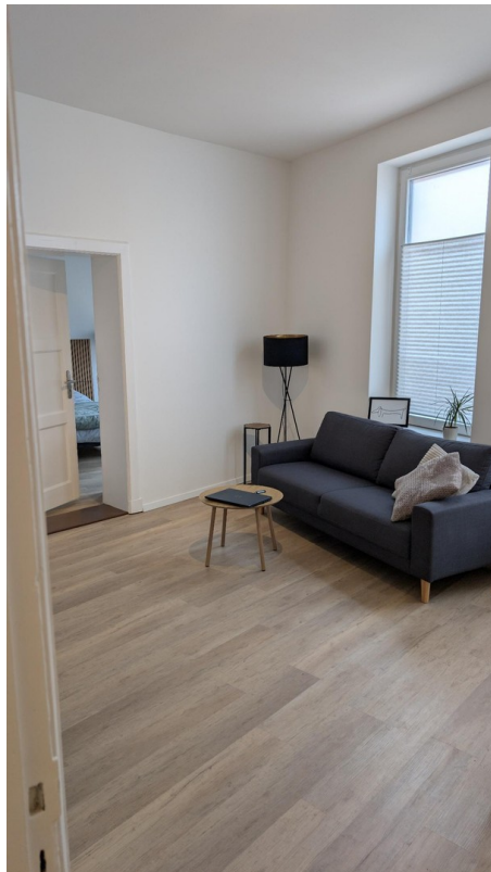
Couch, Tisch, Lampe, Rollos