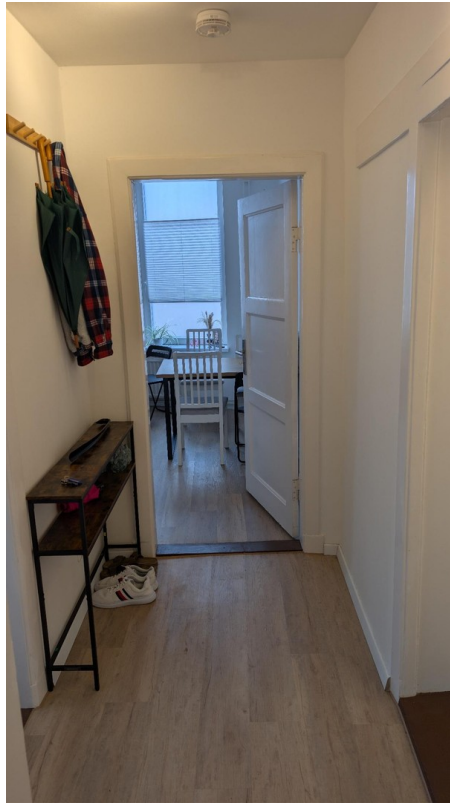
Tisch und Stühle u. Regal