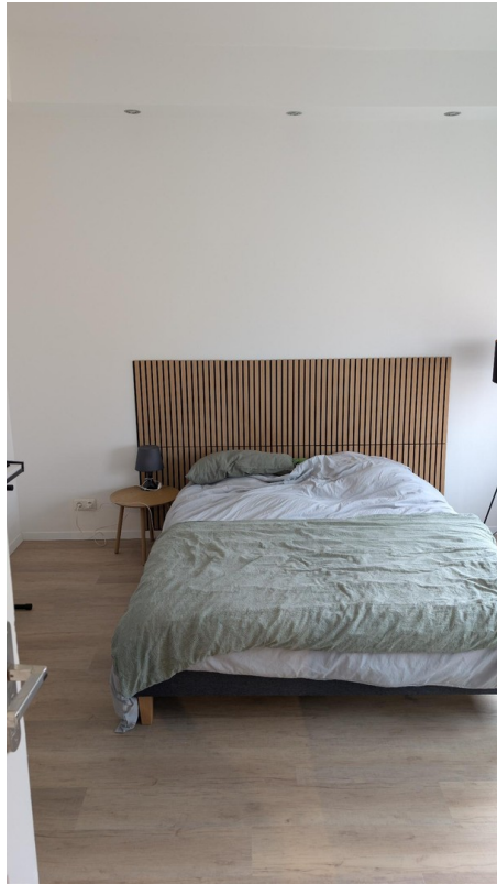
Bett mit Matratze