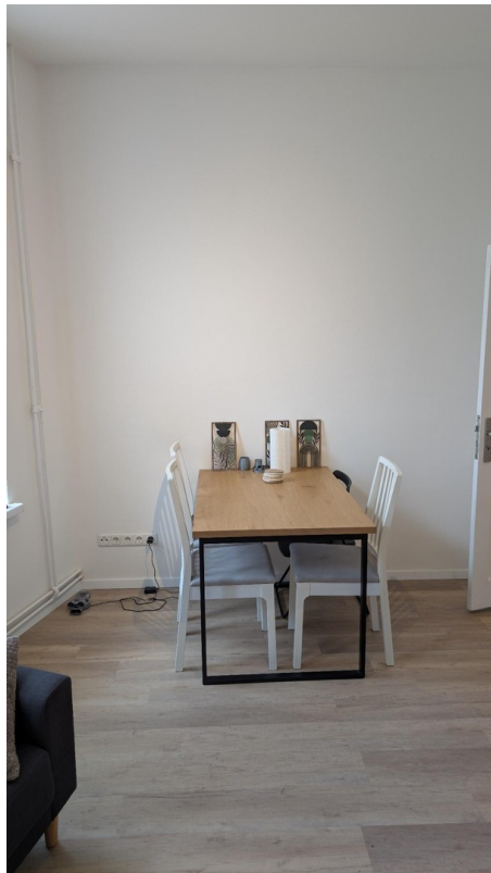
Tisch und Stühle