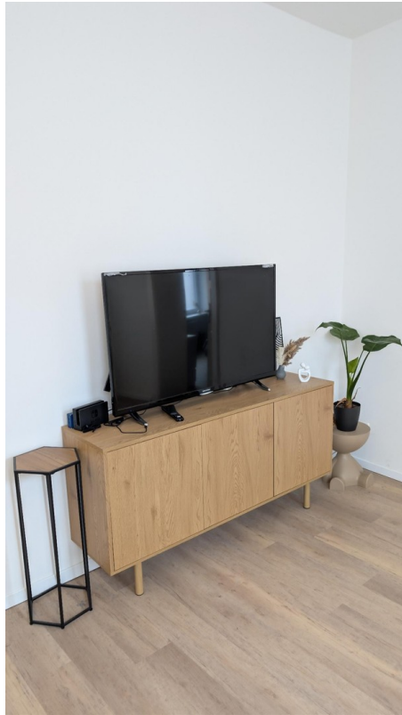
Fernseher und Kommode