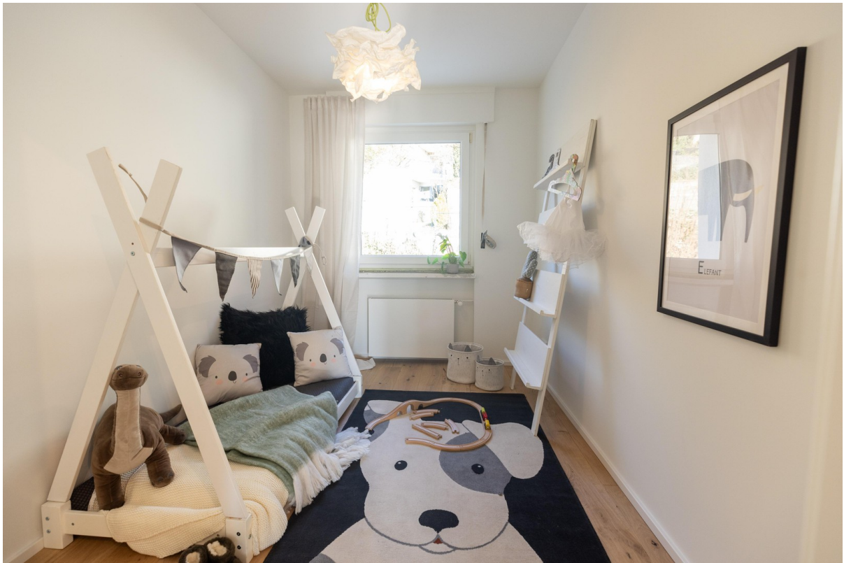
Kind/ Gast/ Büro