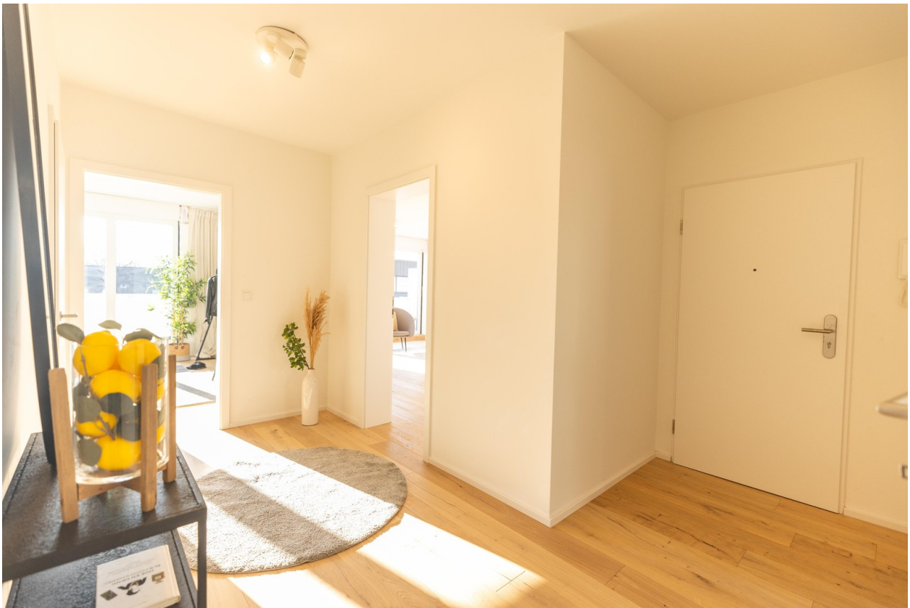
Flur Ansicht 2