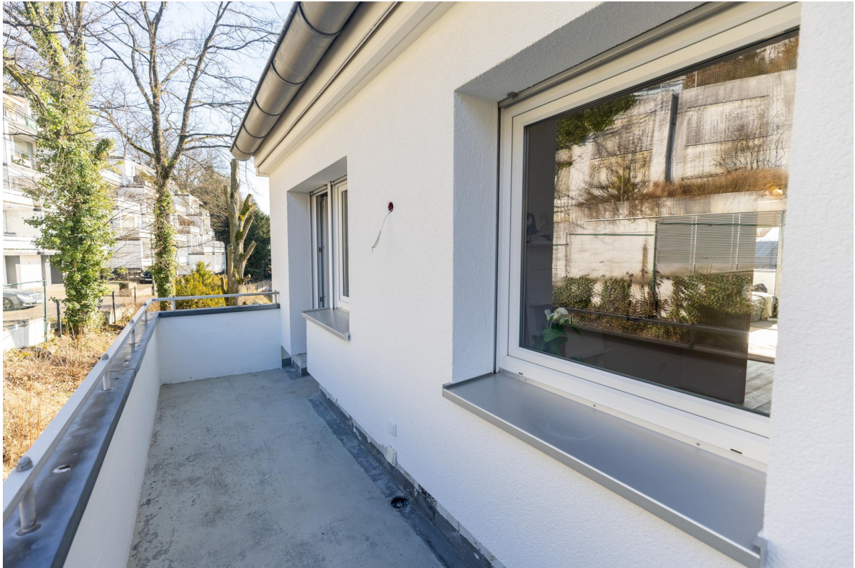
Balkon Küche Rückseite