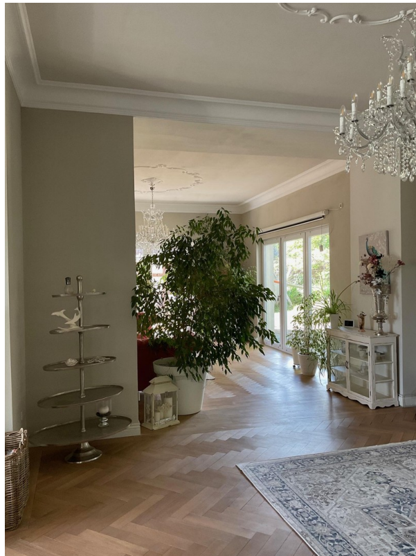
Sicht Kamin- zu Wohnber. II