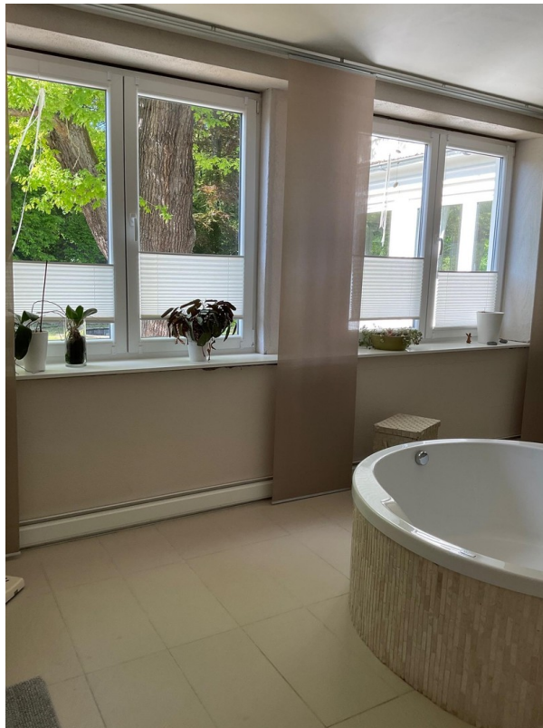
Bad groß 1.OG