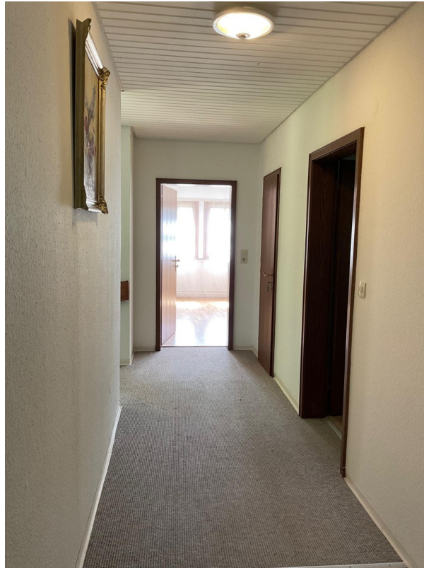
Gang Gästehaus 2