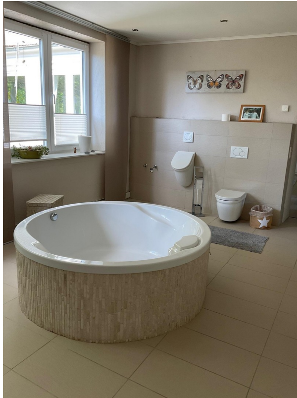
Bad groß 1.OG