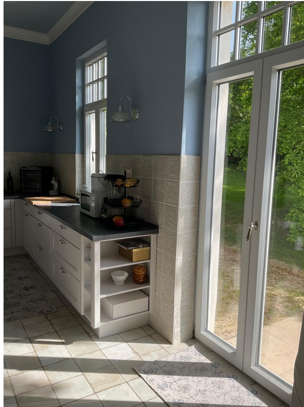
Küche Villa EG