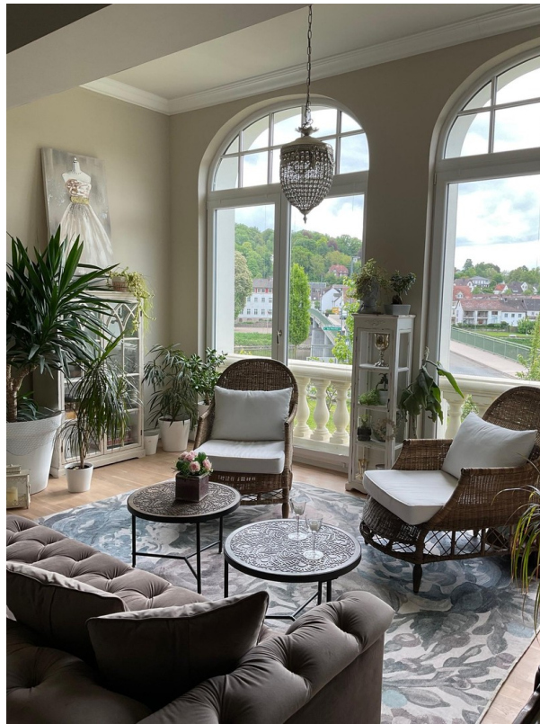
Wohnbereich Südfenster EG