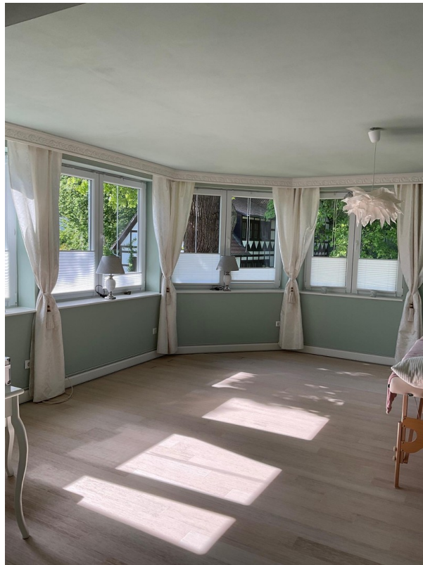
Erker-Zimmer Gartenseite 1.OG