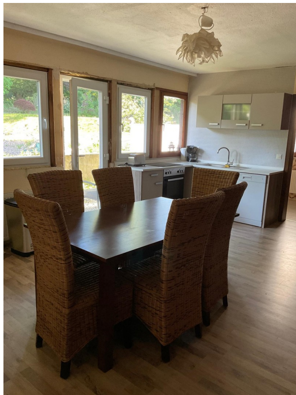
Küche Gästehaus 1