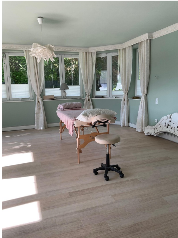
Erker-Zimmer Gartenseite 1.OG