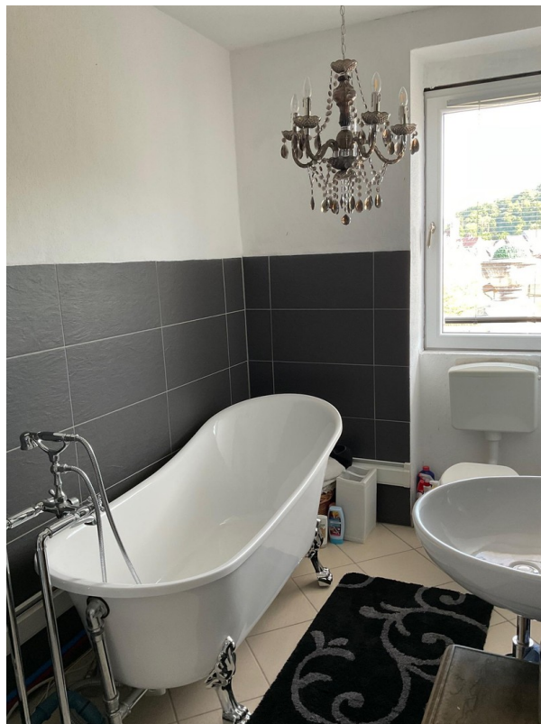
Bad klein 1.OG