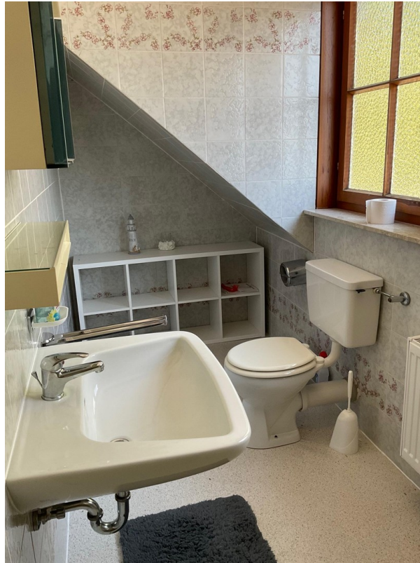
Bad Gästehaus 1