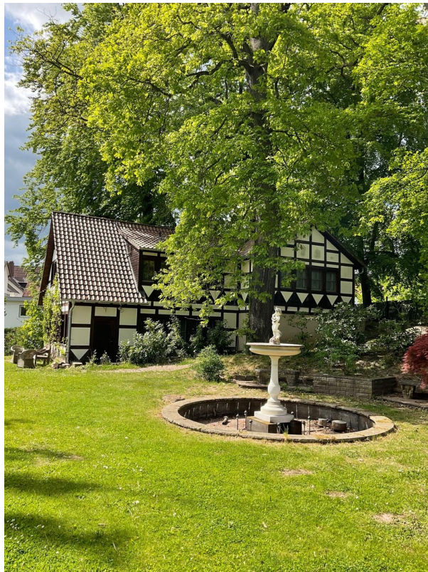
Brunnen mit Gästehaus II