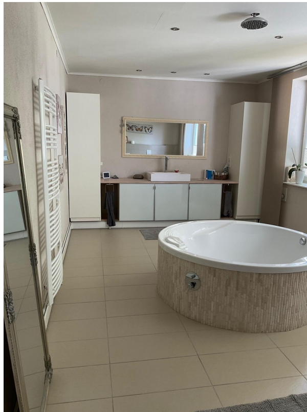
Bad groß 1.OG