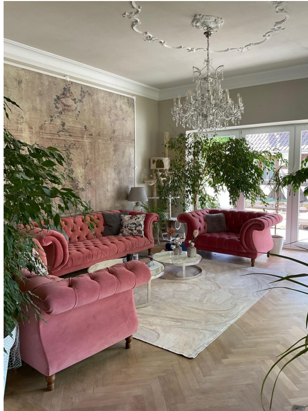
Wohnbereich II EG