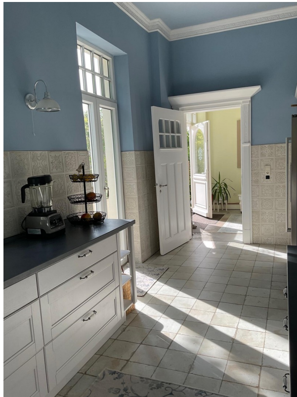
Küche Villa EG