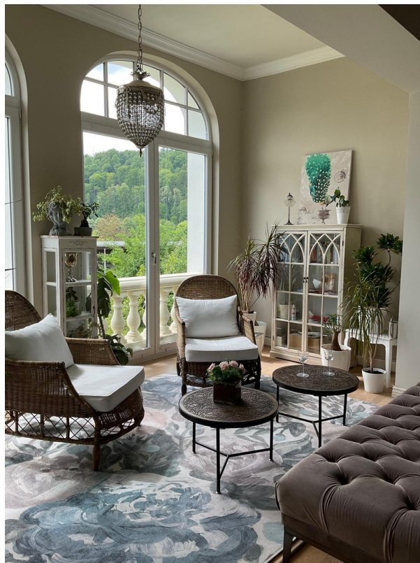
Wohnbereich Südfenster EG