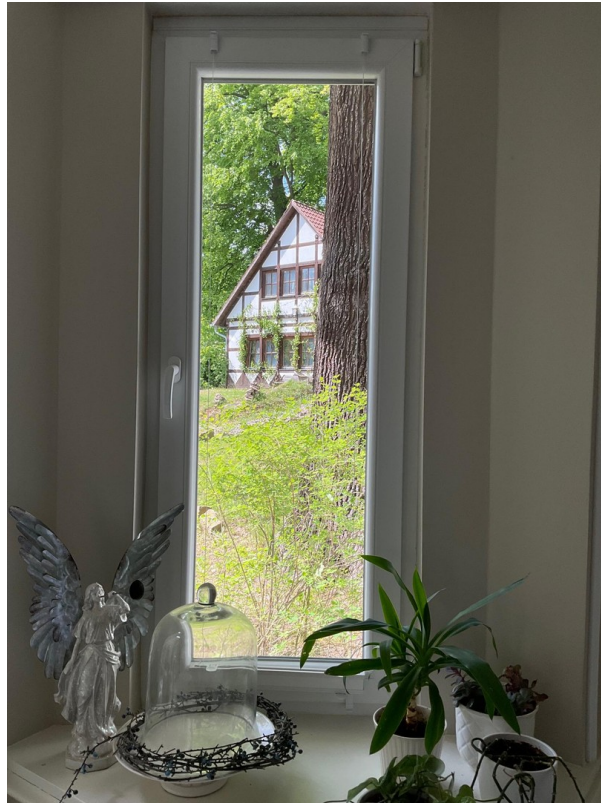
Blick auf 2. Gästehaus v. EG