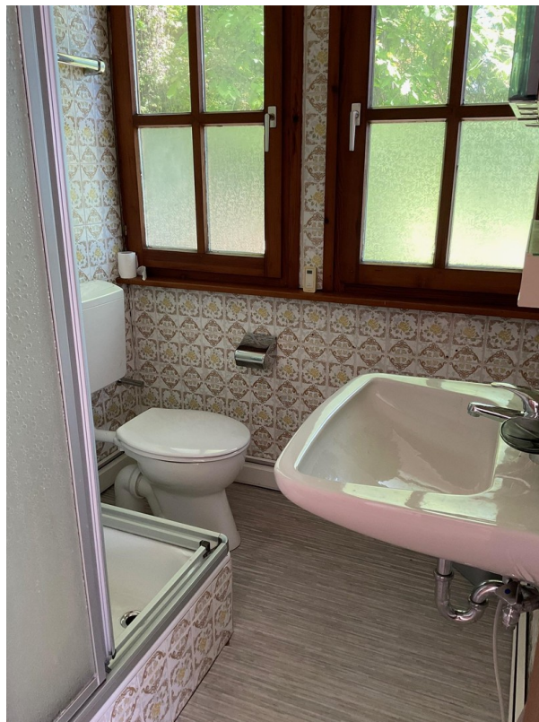
Bad Gästehaus 2