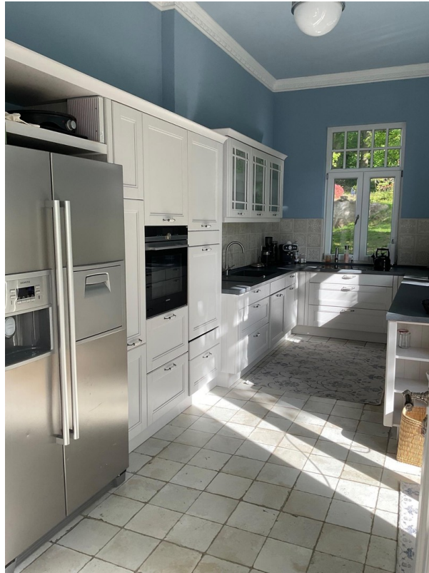
Küche Villa EG