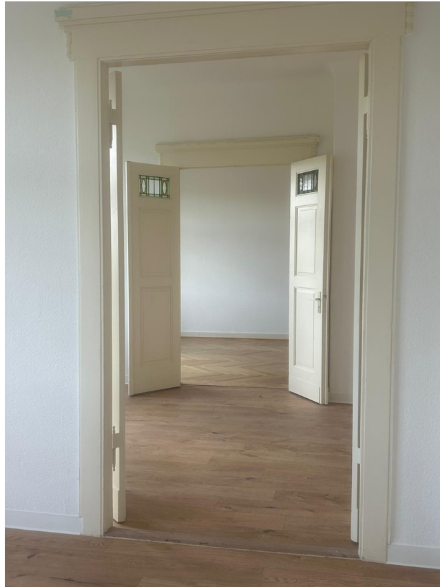
Blick durch die Räume