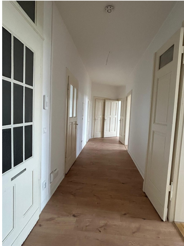
Blick von der Eingangstür