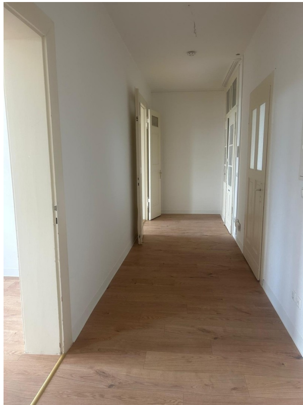
Blick zur Eingangstür