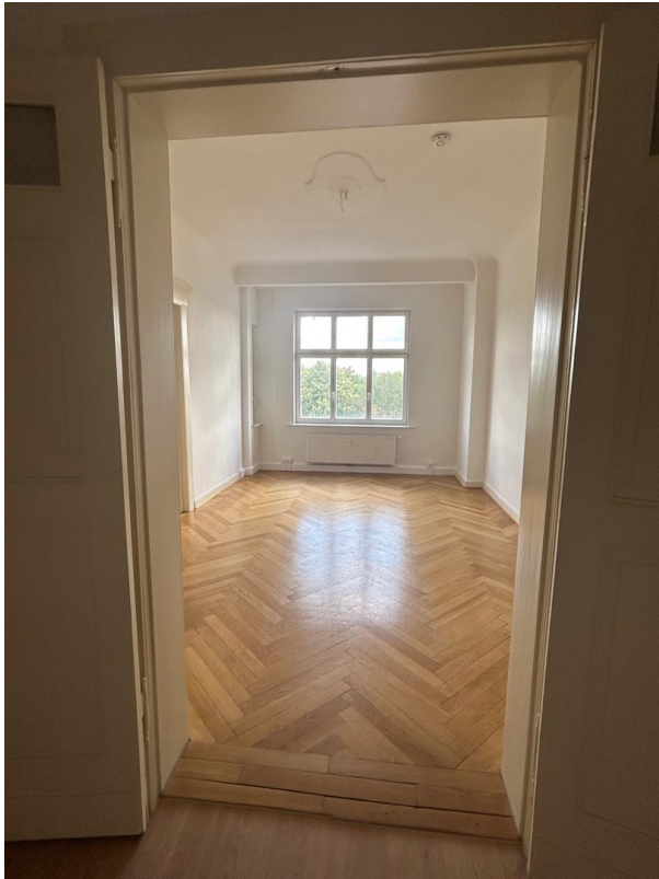
Blick ins Wohnzimmer