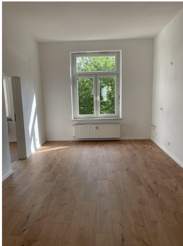
Küche / Diele