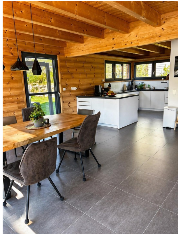
Offener Wohn- / Essbereich