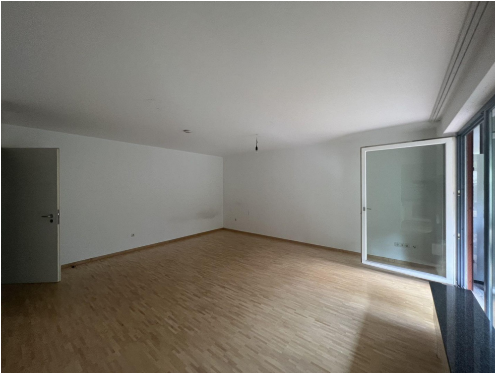
Blick in das Apartment