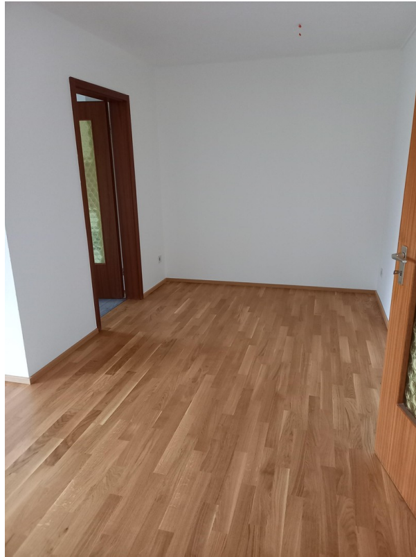
Wohnzimmer mit Zugang zur Küch