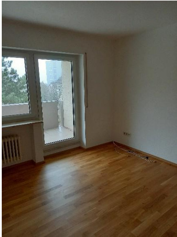
Wohnzimmer m. Blick zum Balkon