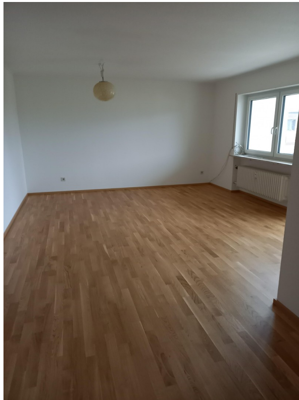
Wohnzimmer von der Eßecke aus