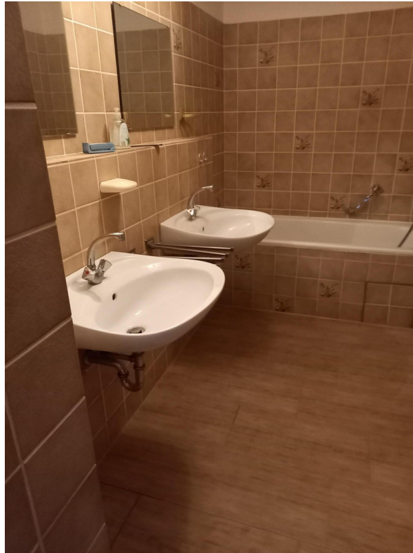
Teilansicht Bad 2