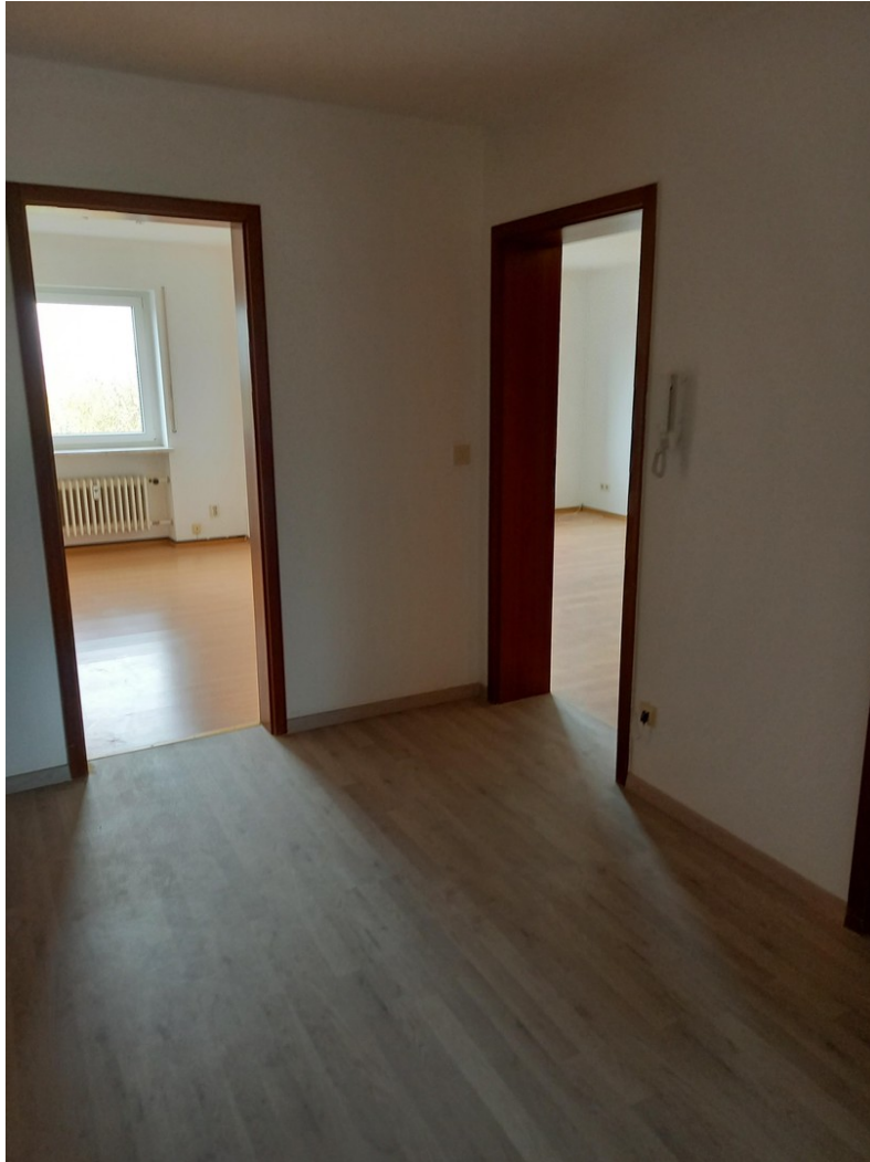
vom Flur in das Ki- und Schlaf