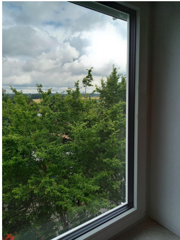
Blick vom Schlafzimmer