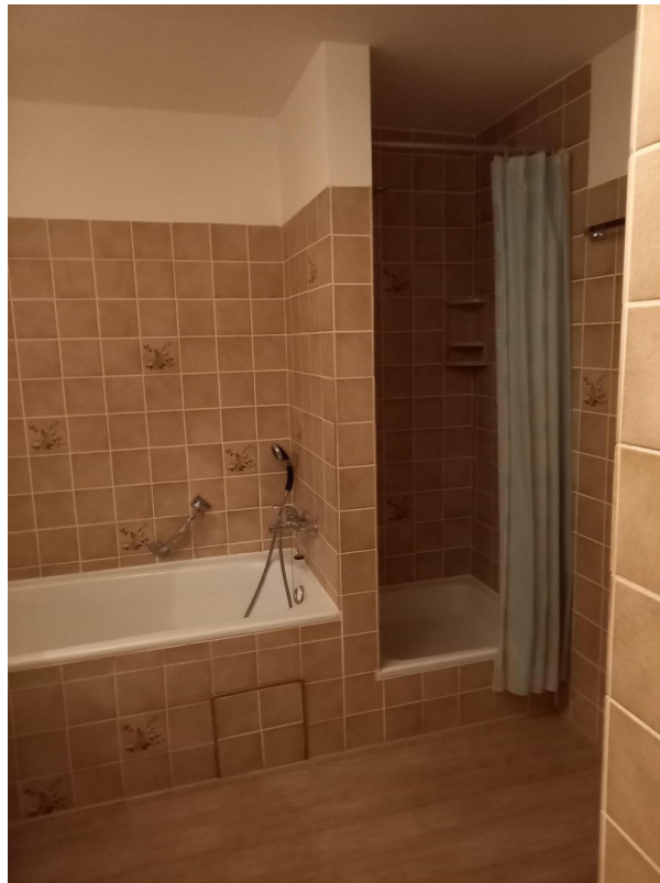
Teilansicht Bad 1