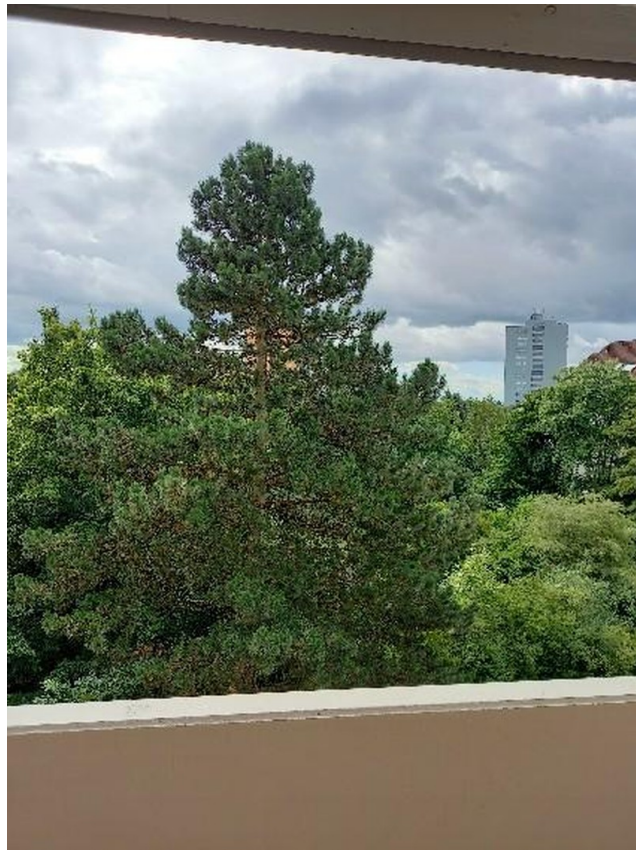
Blick von der Wohnung