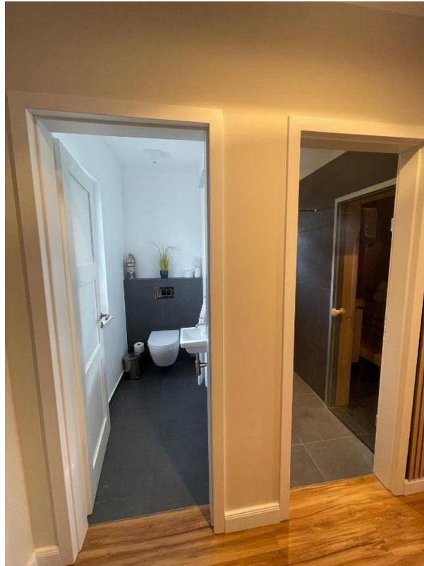
Gäste WC und Sauna mit Dusche