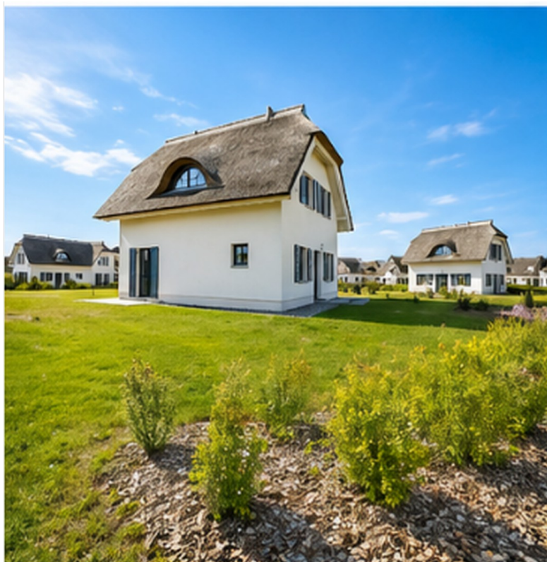
Seitliche Ansicht Fern