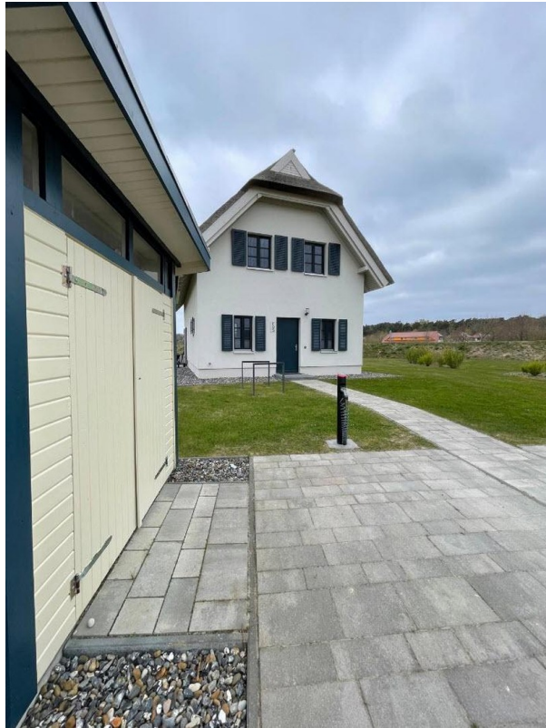
Front Ansicht Haus