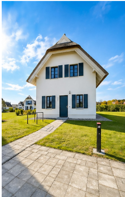
Frontansicht mit PKW Ladesäule