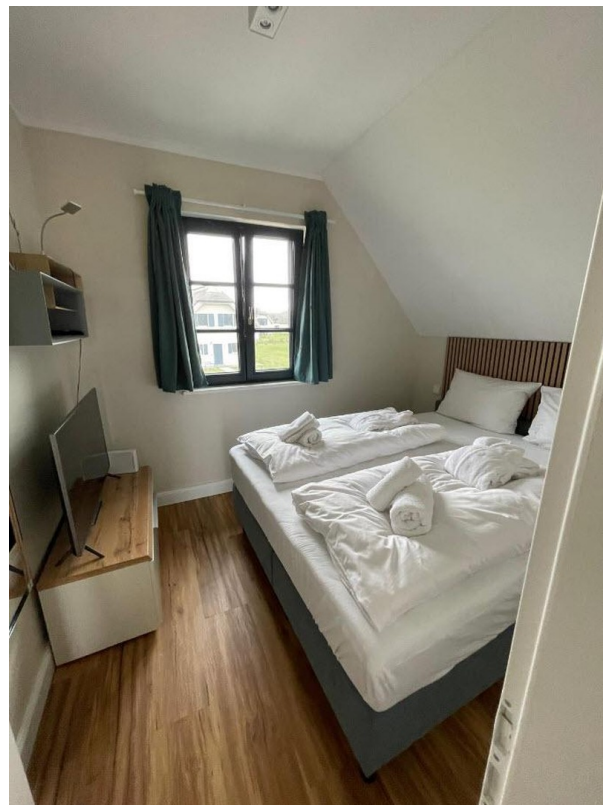
Gästezimmer 1 mit Doppelbett