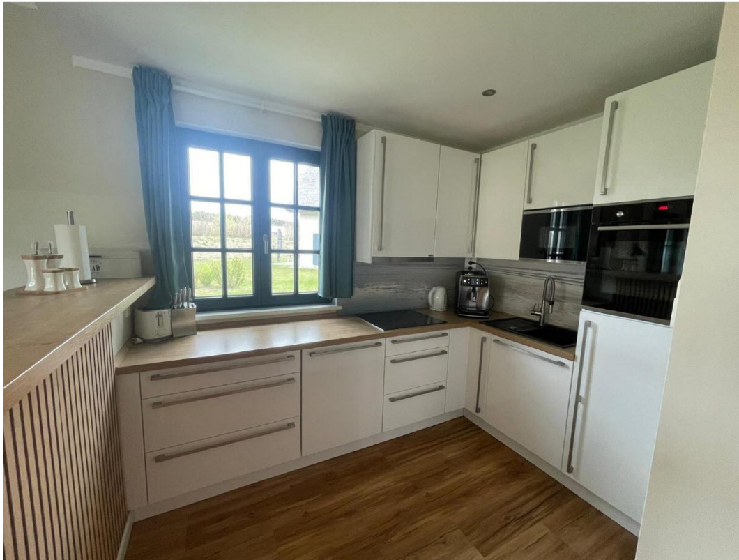
Küche modern eingerichtet