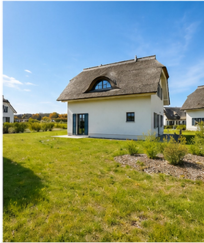
Haus Ansicht vorne Links