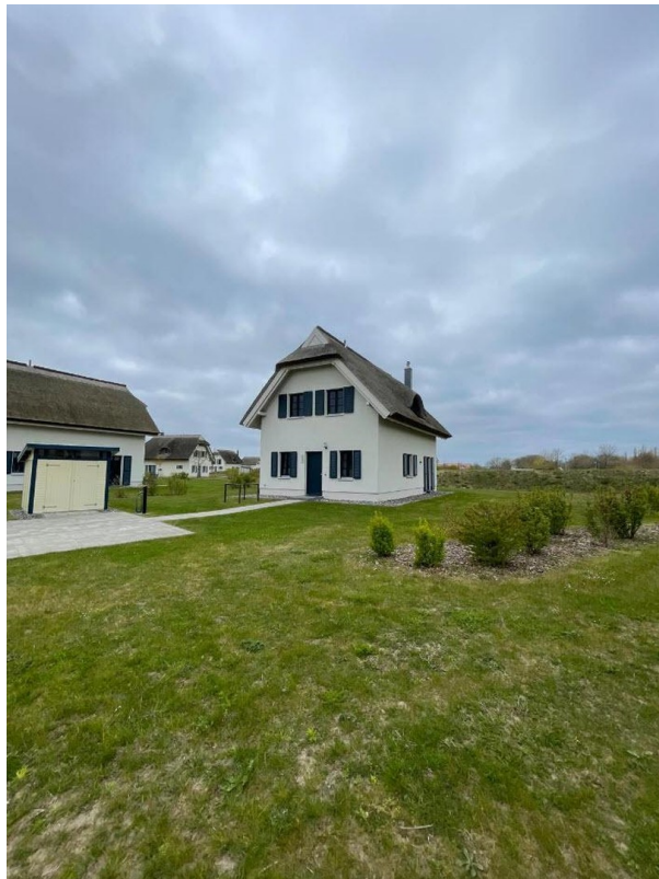
Front Ansicht Haus