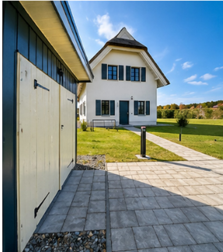
Front mit Geräteschuppen