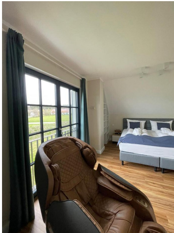
Schlafzimmer mit Massagesessel