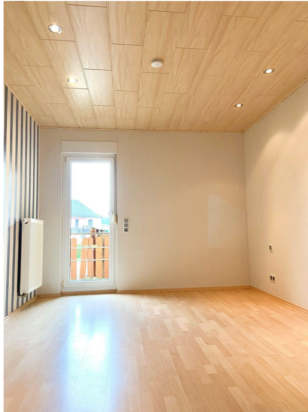
Schlafzimmer mit Balkonzugang