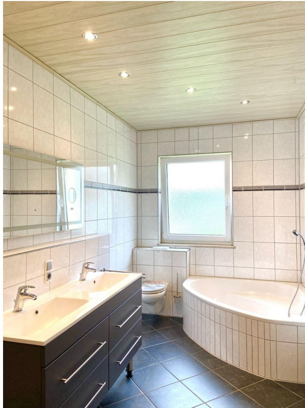
Badezimmer mit Eckbadewanne