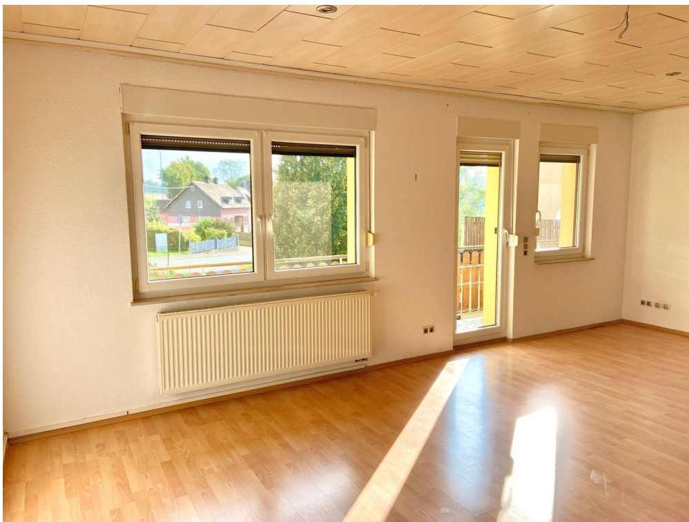
Wohnzimmer mit Balkonzugang