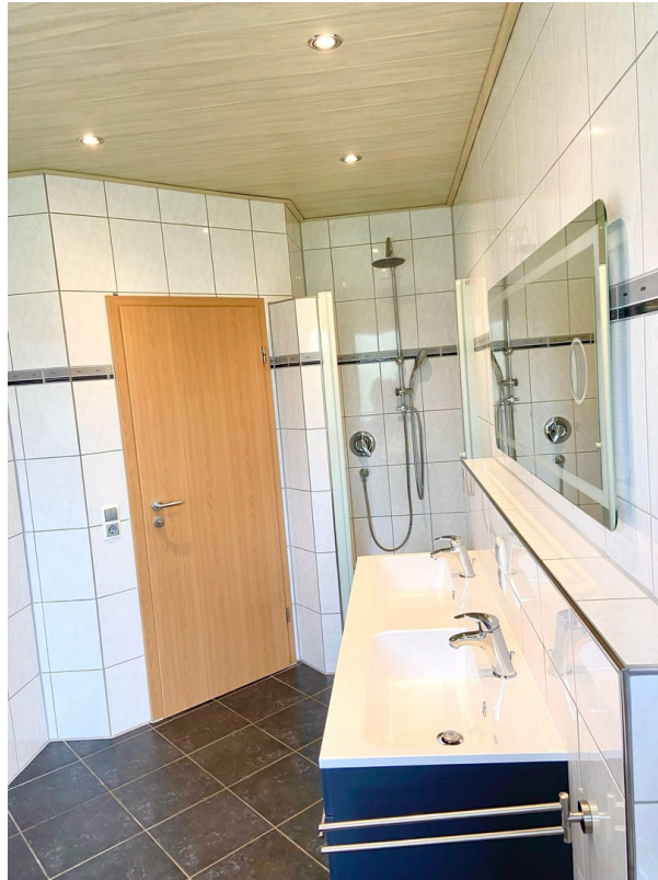
Badezimmer mit Regendusche