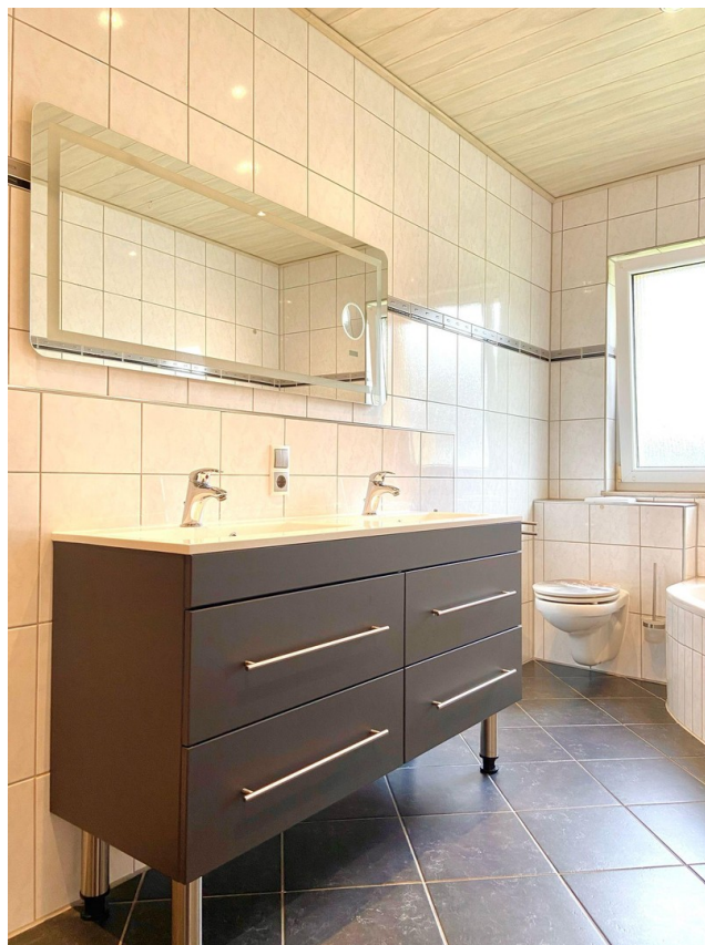
Badezimmer mit Waschbecken