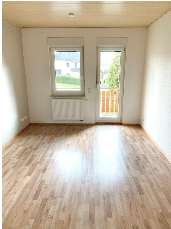
Zimmer mit Balkonzugang