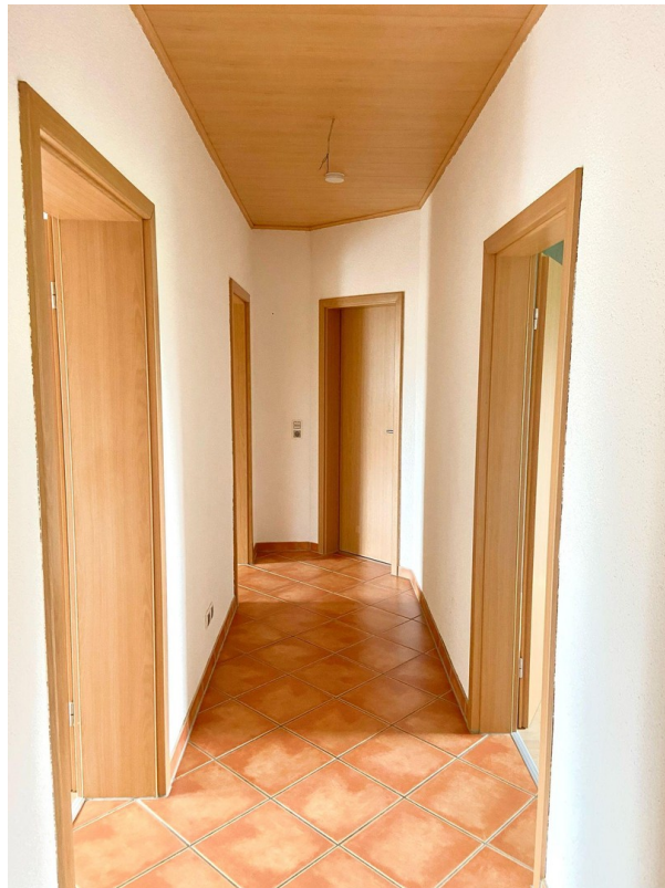
Flur mit Zimmerzugang