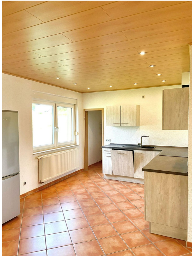
Offene Küche mit Speisekammer