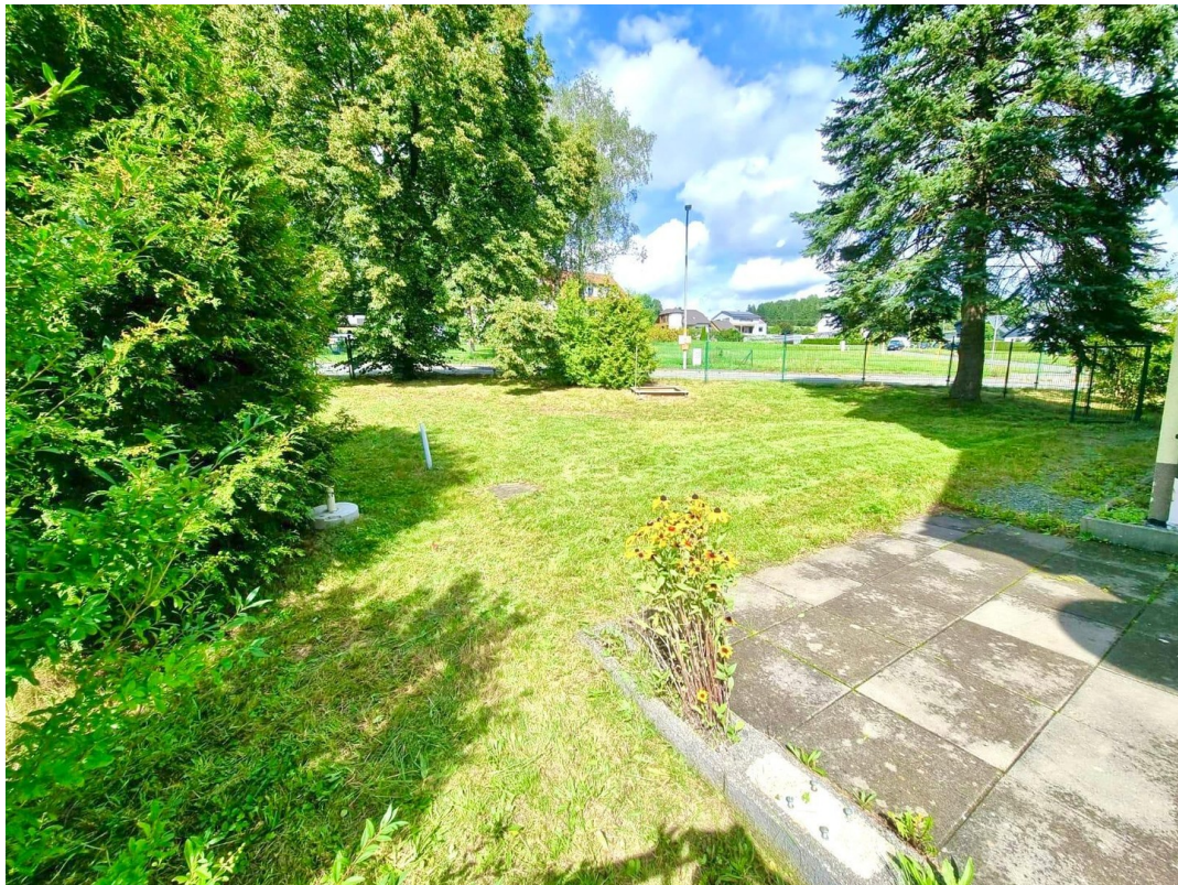
Garten mit Terrassenfläche