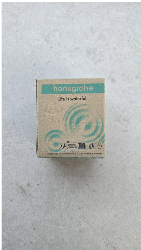
Life is Wonderful