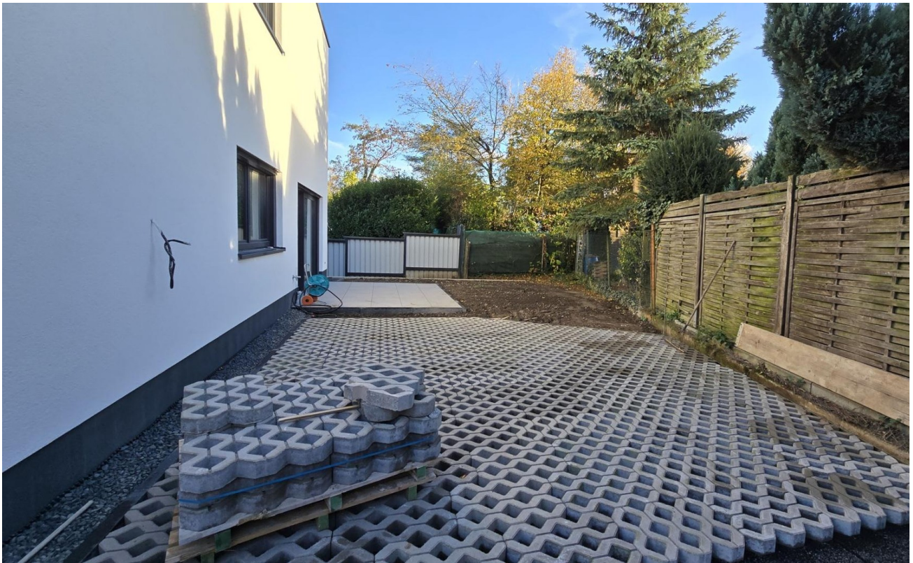
Parkplatz mit Zugang Terrasse