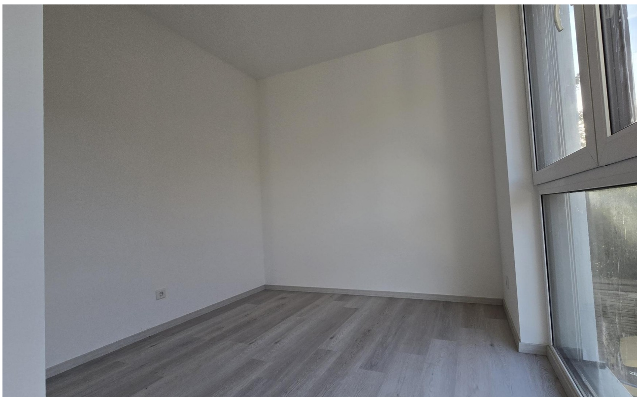
Beg. Kleiderschrank Eltern