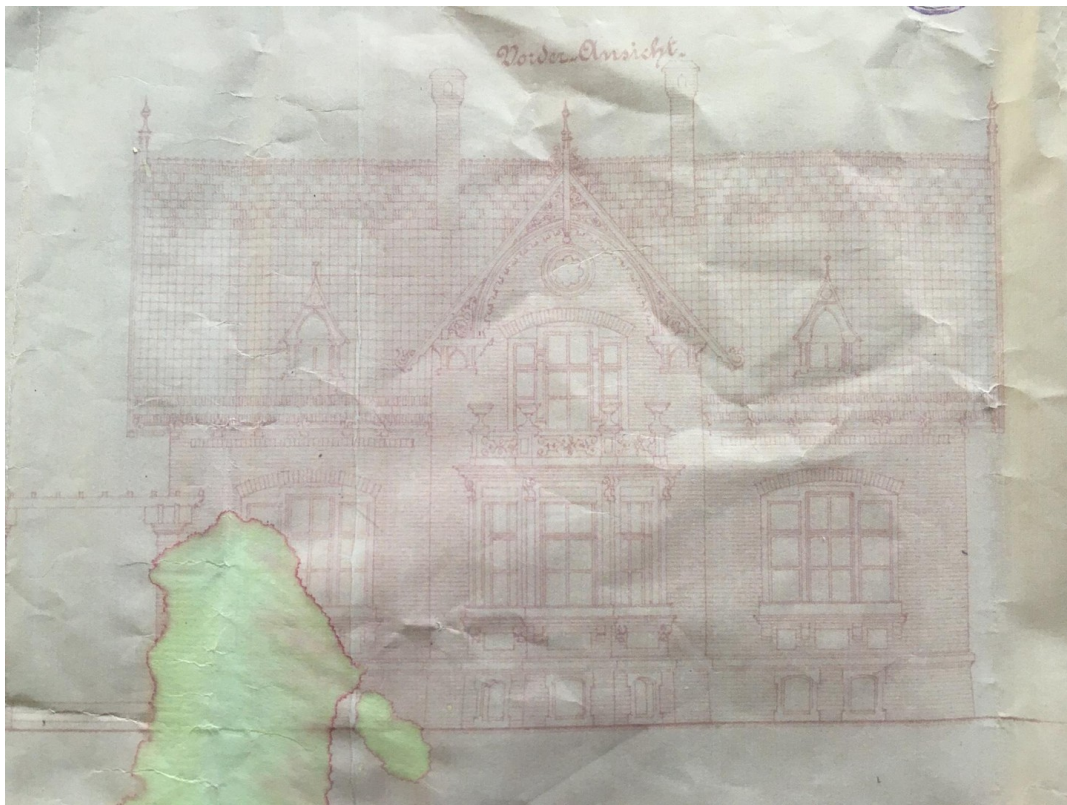
Haus von Vorne