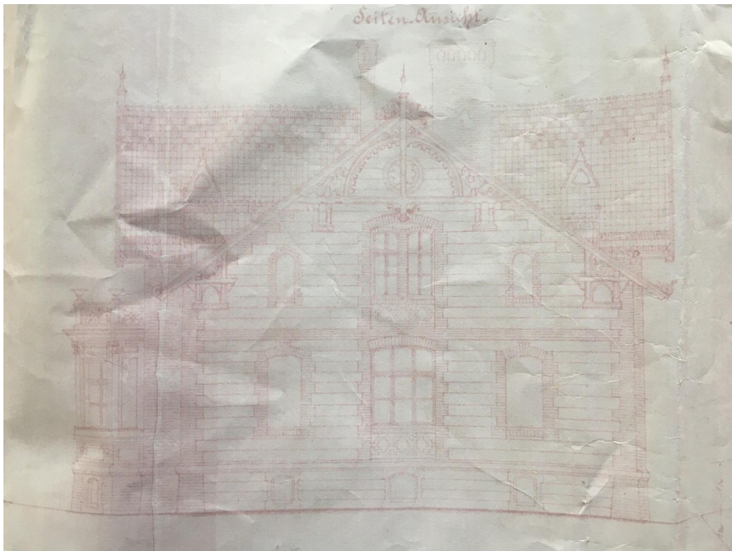
Haus von Seite