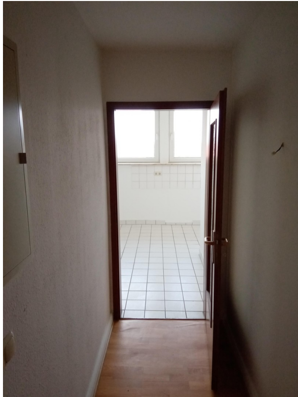
Flur zur Küche