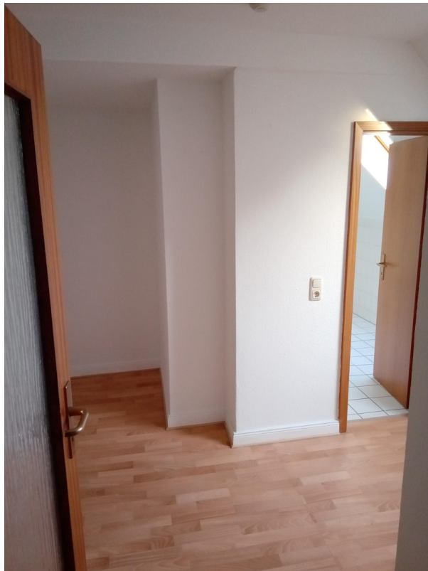
Schlafzimmer zu Bad