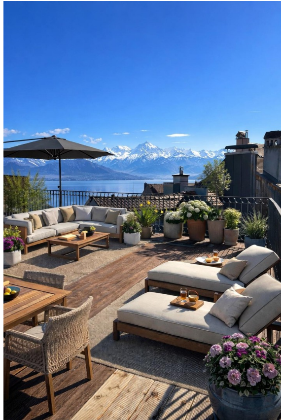
Dachterrasse mit Seeblick