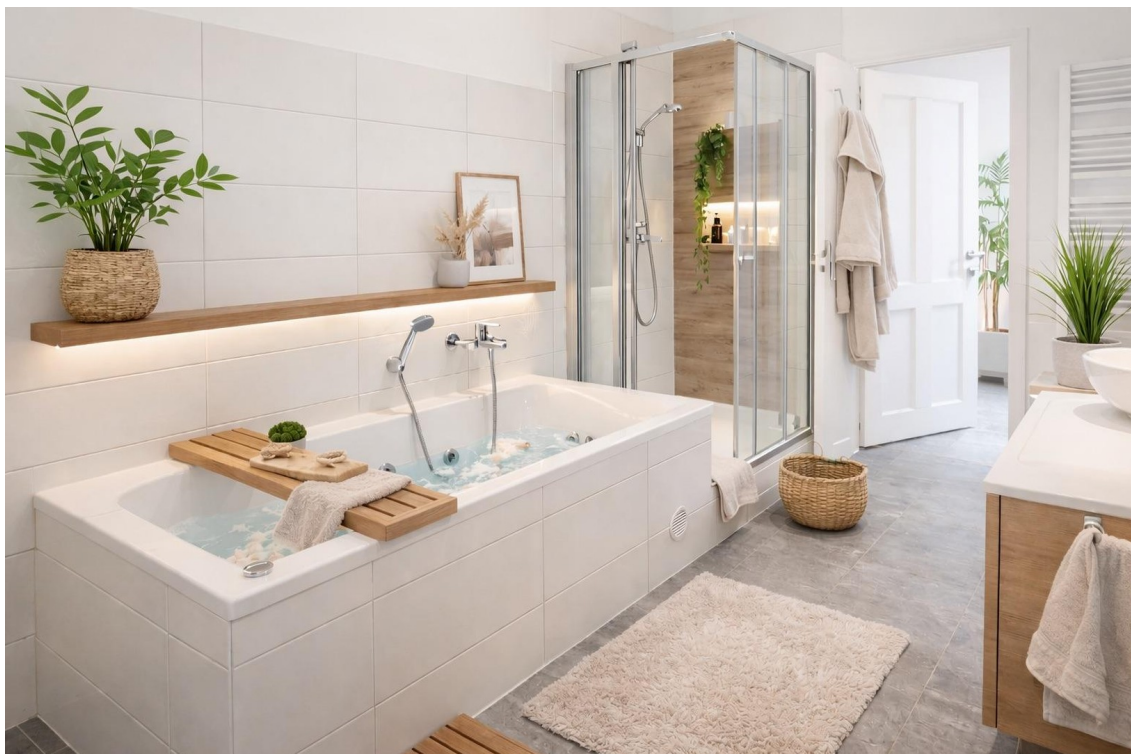
Whirl-Badewanne und Dusche