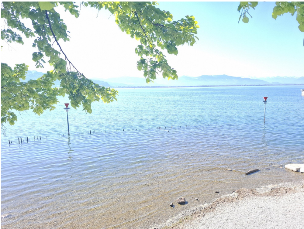
Seezugang um die Ecke