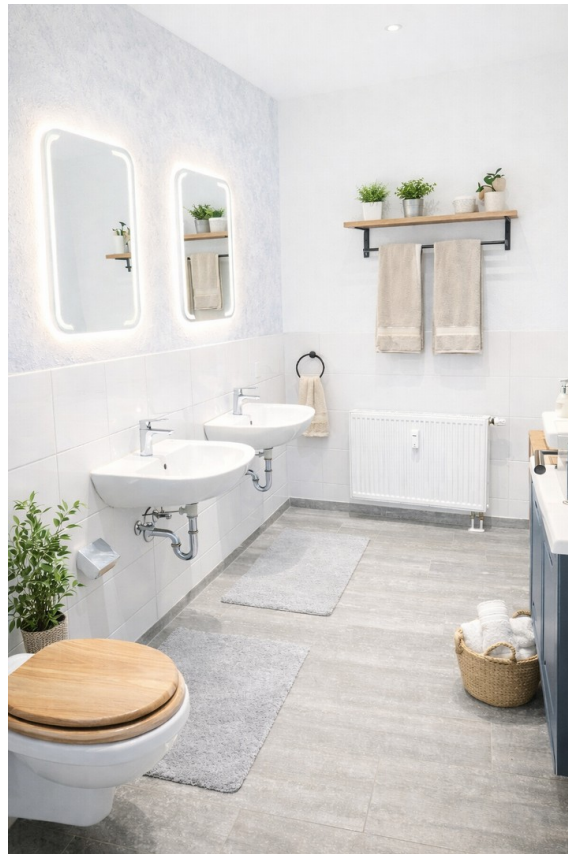
Badezimmer mit 2 Waschbecken