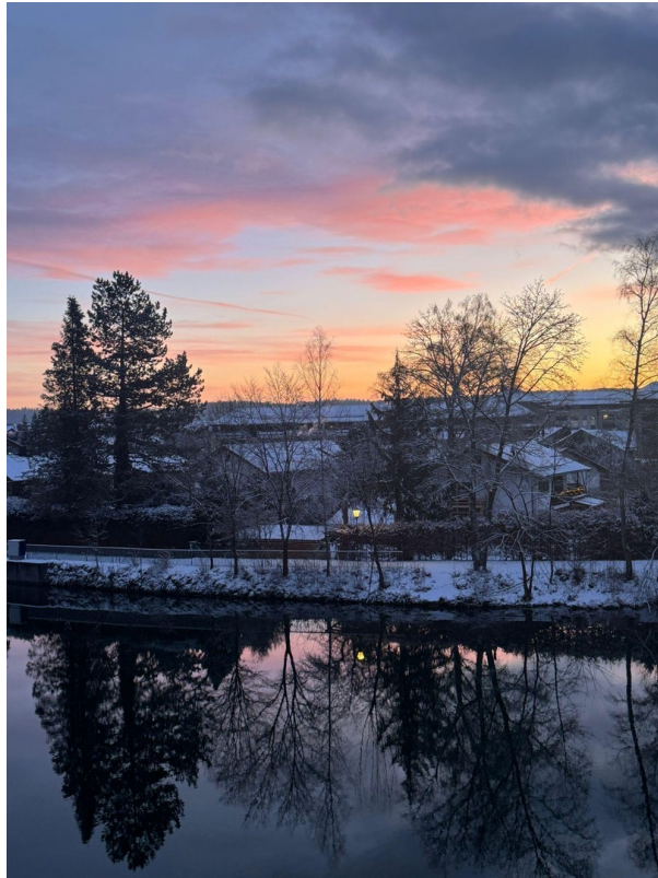
Blick nach Osten (Sunrise)