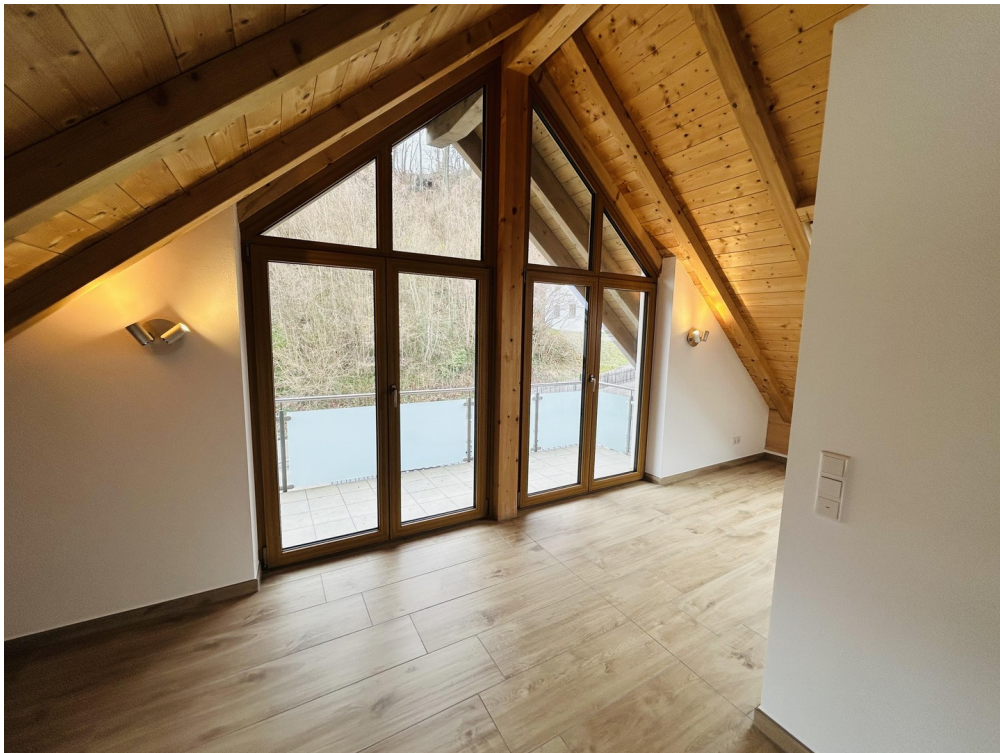
Ess- und Wohnbereich