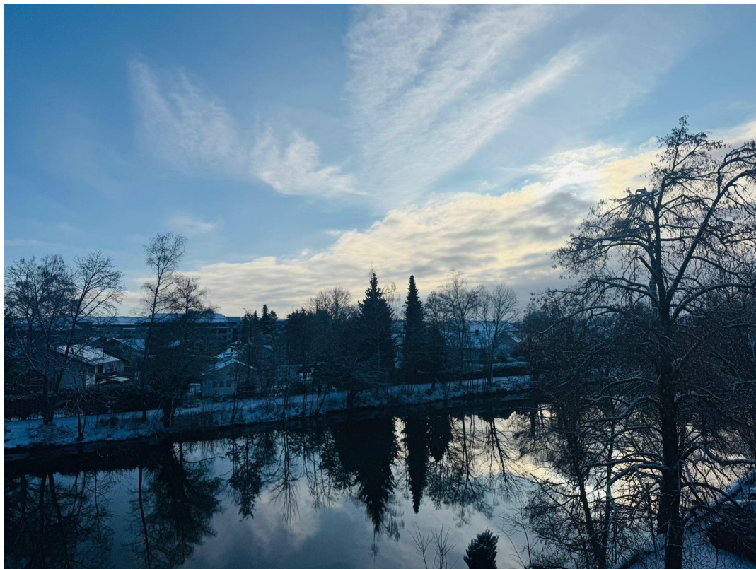
Blick nach Osten