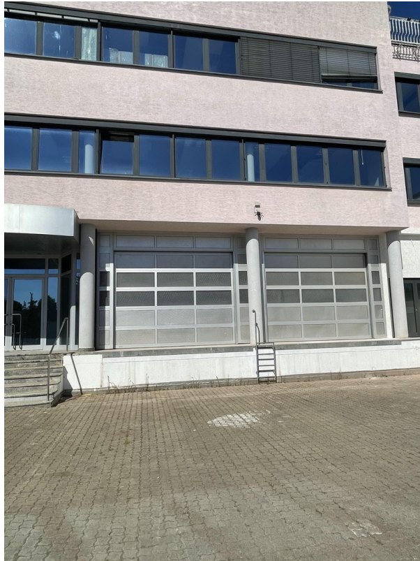
Sektionaltore m. Laderampe