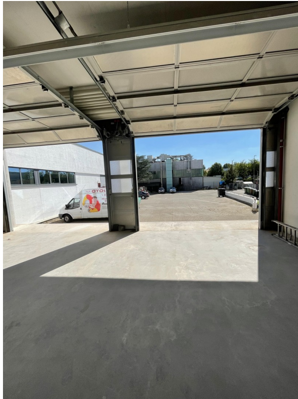
Blick auf den Hof