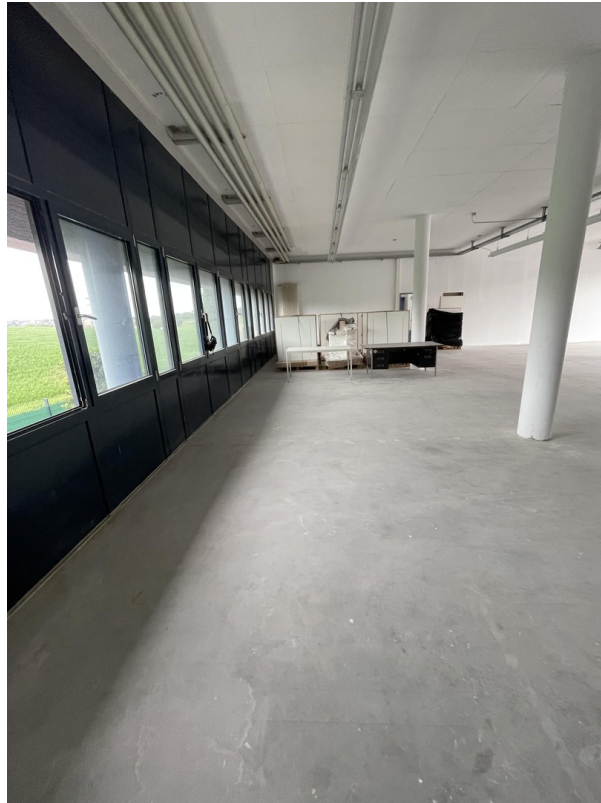
Fensterband mit Ausblick