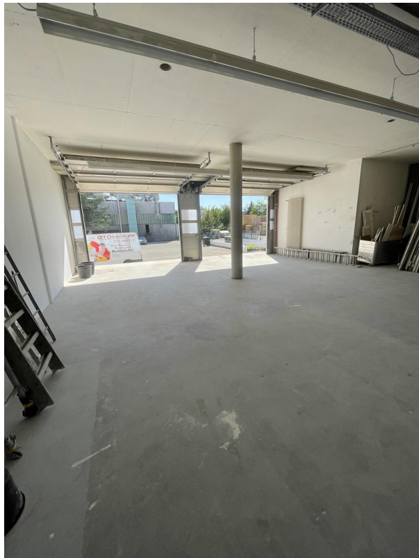
Blick auf den Hof