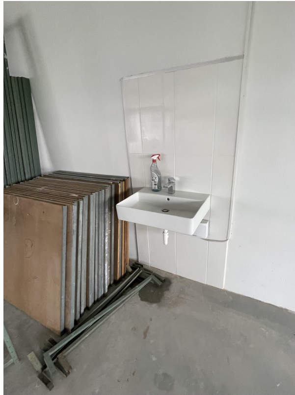
Waschbecken in der Halle