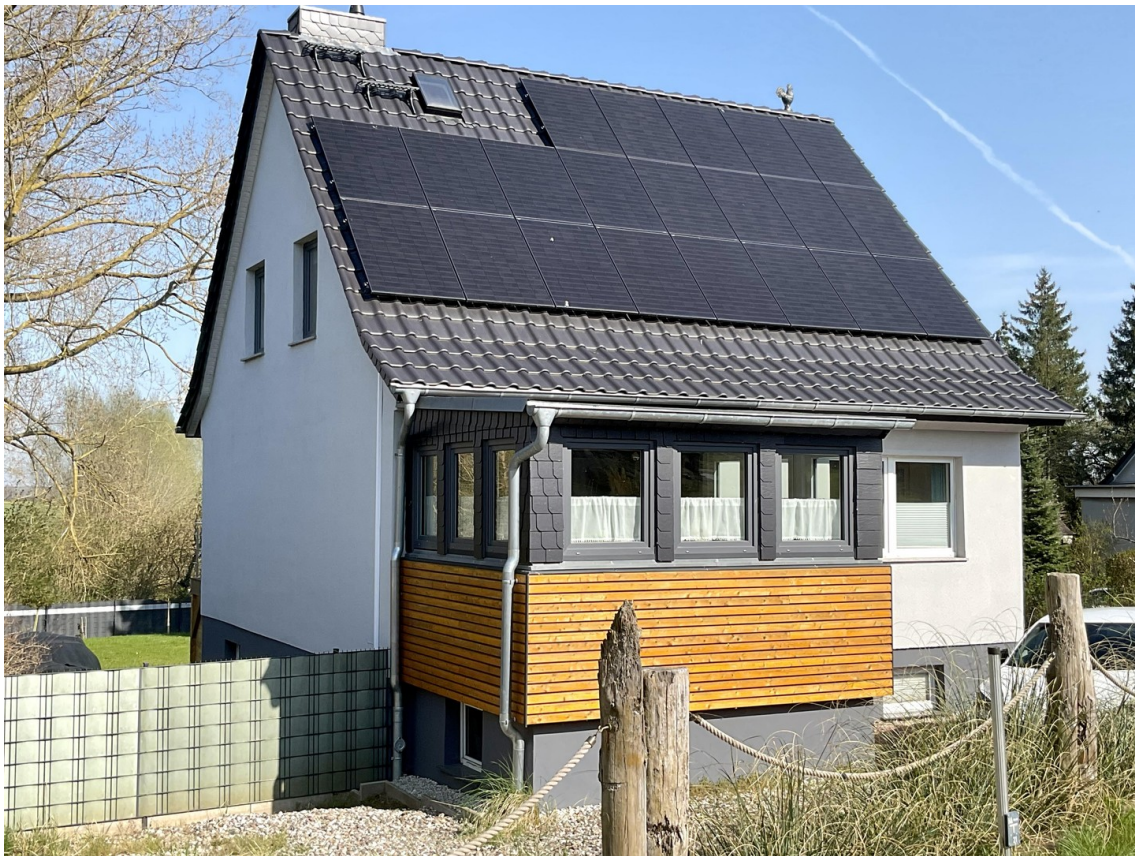
Haus von Straße aus mit PV