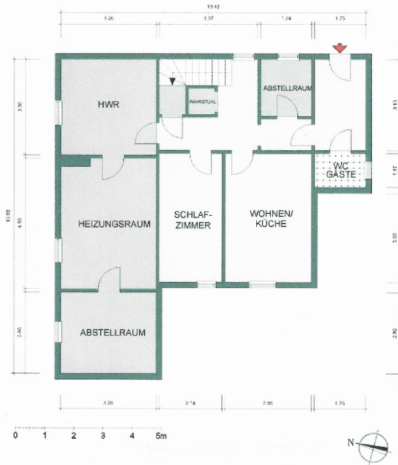
Grundriss zum Souterrain mit Maßen