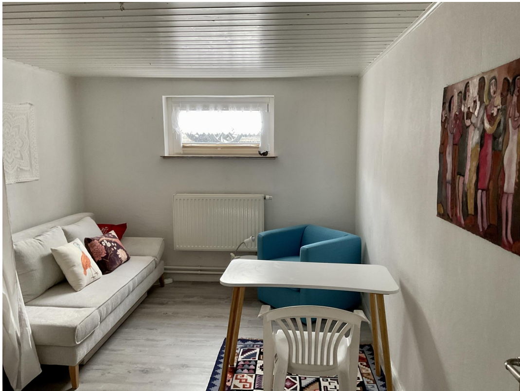
Gäste1 / Kinderzimmer