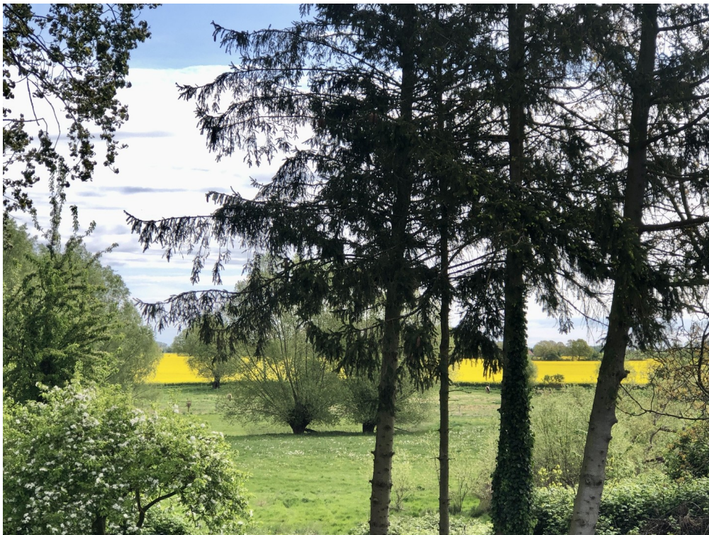
Blick von Terrasse