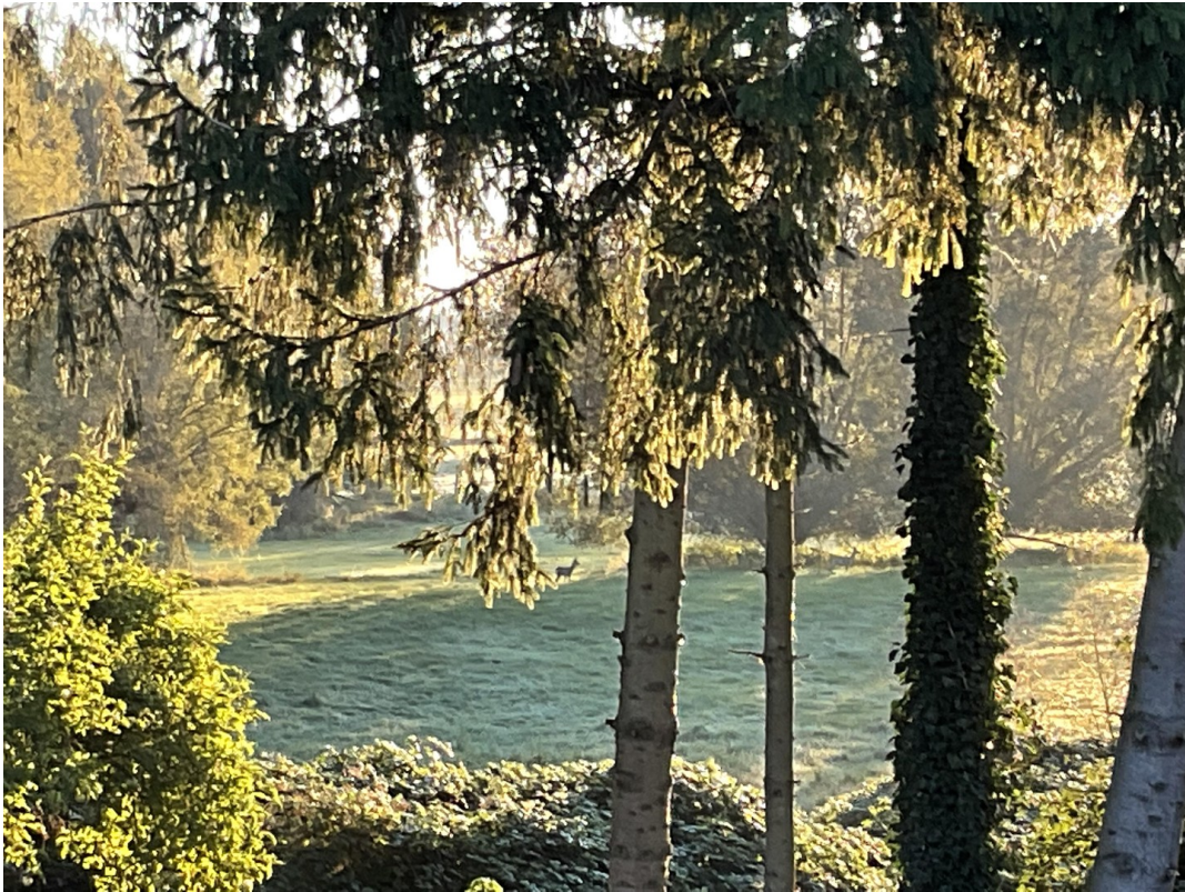
Blick vom Terrasse mit Reh