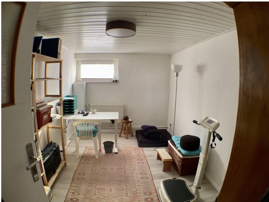
Gästezimmer2 / Büro