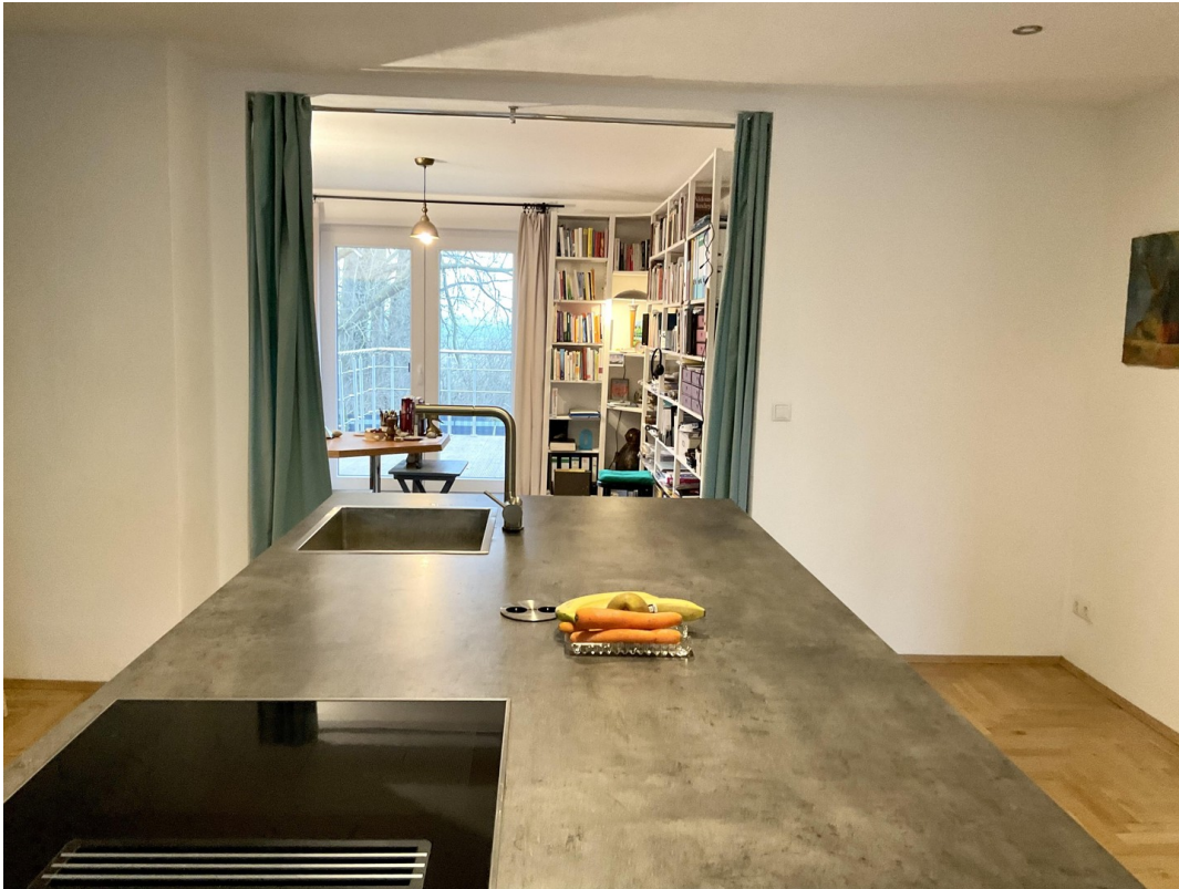
Blick in Arbeitszimmer