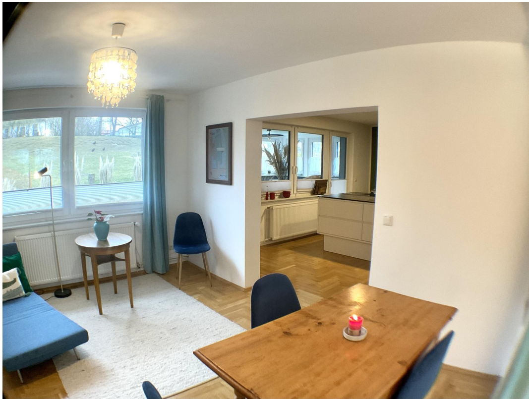
Blick von Wohnzimmer in Küche