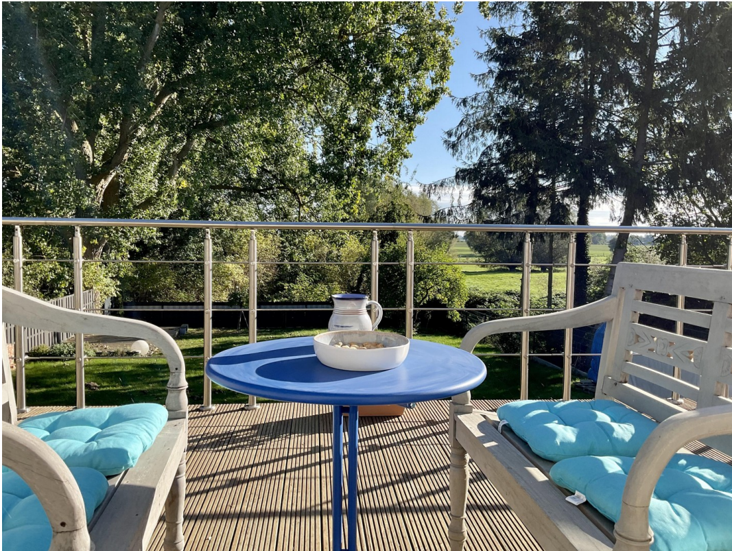
Grosse Terrasse über Carport