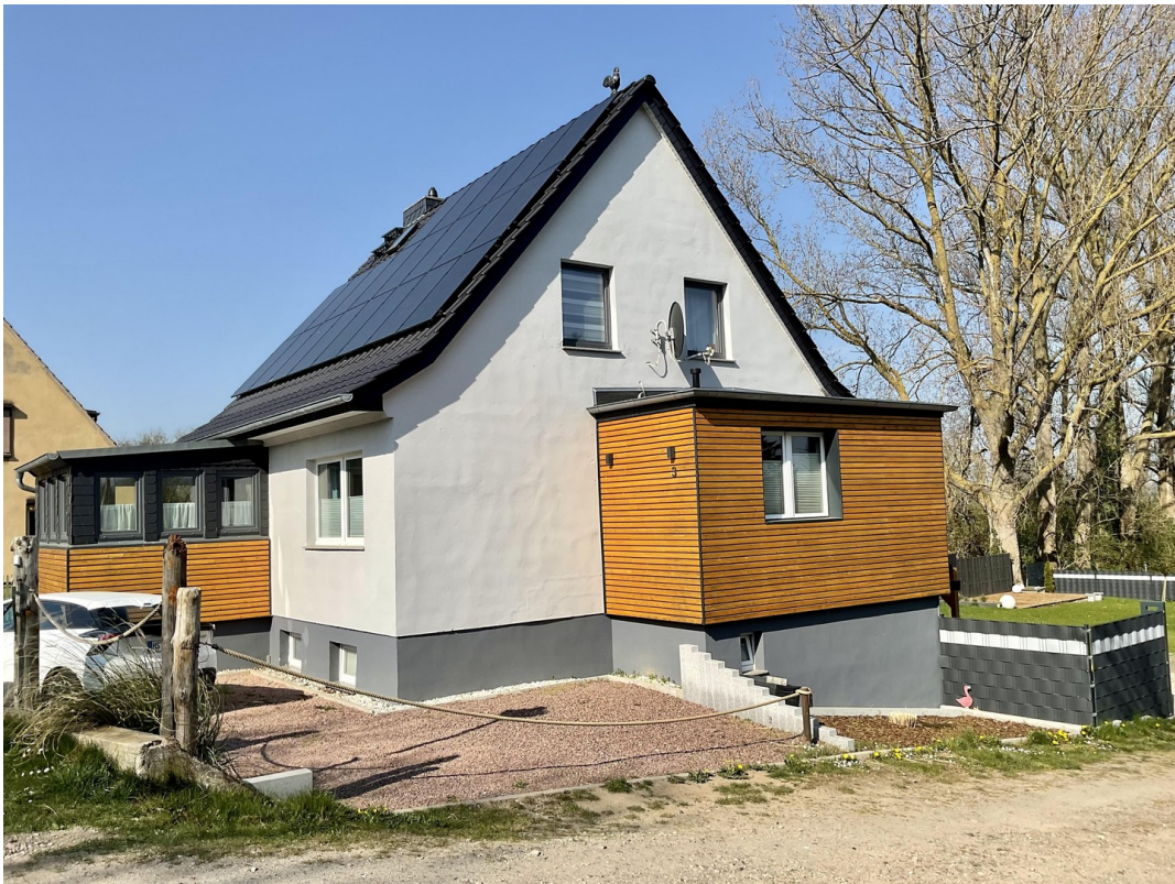
Hausansicht / Seite