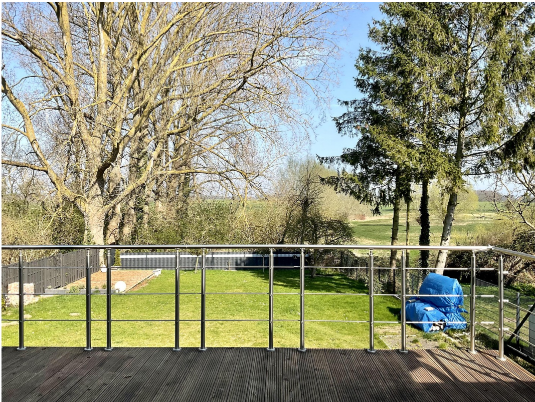
Blick von Terrasse