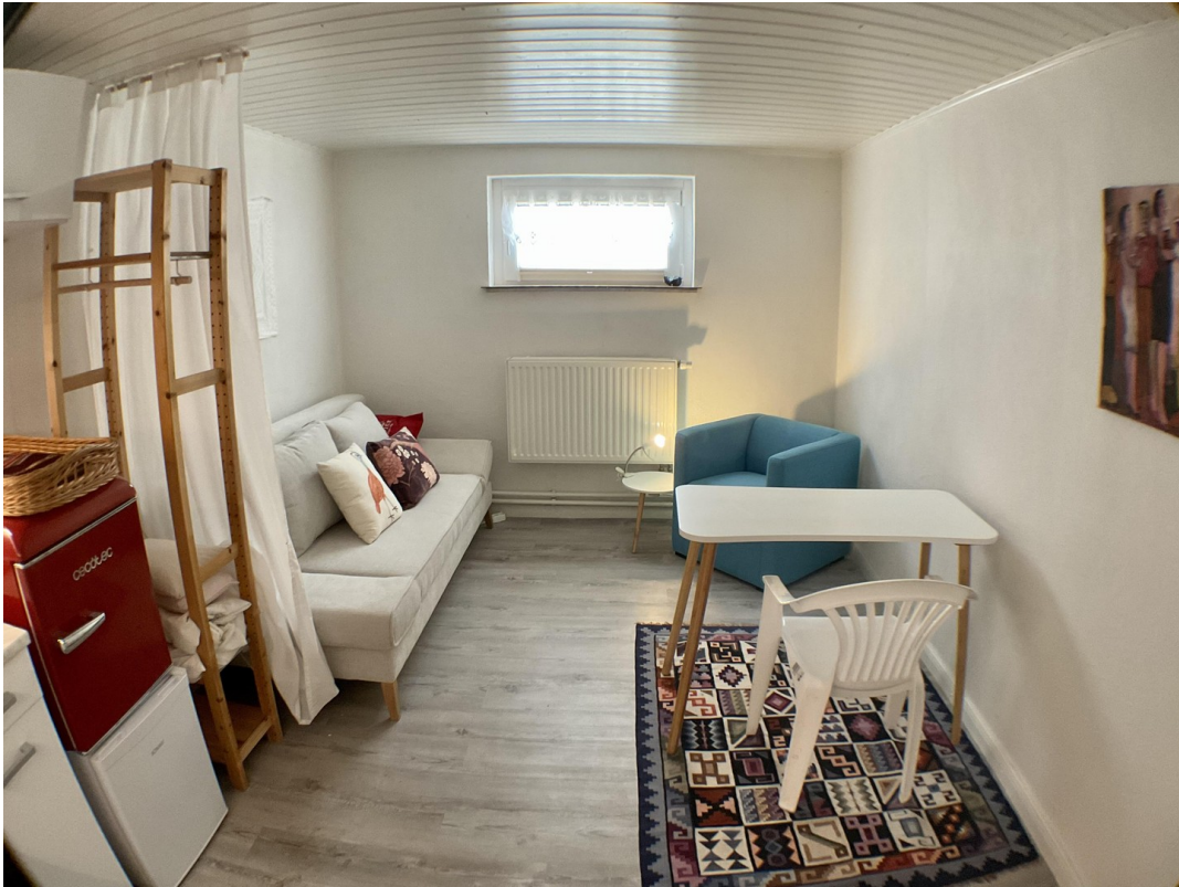
Gäste1 oder Kinderzimmer