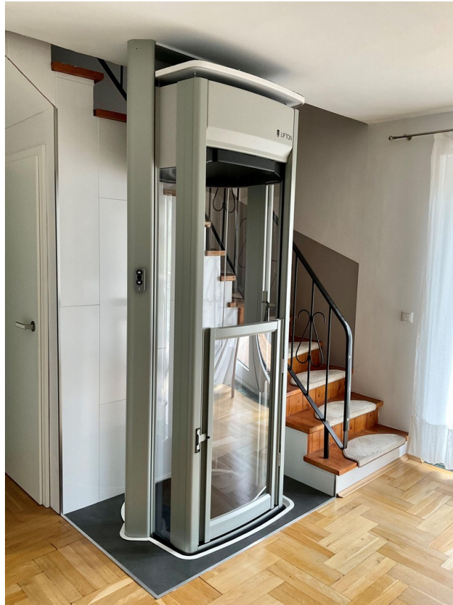
Lift Erdgeschoss zu Hauptgesch