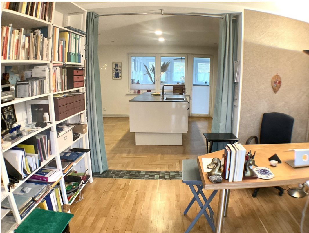
Blick von Büro in Küche