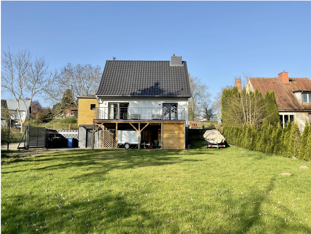
Haus von Garten aus