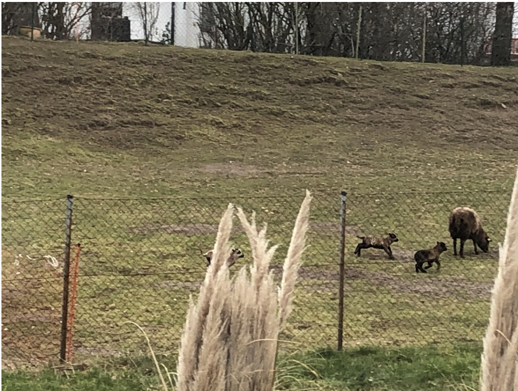
Blick auf kleine Schafweide