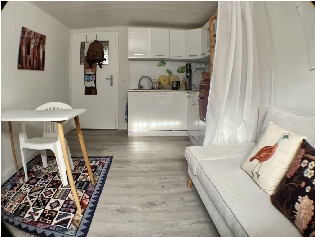
Gäste1 mit Küchezeile