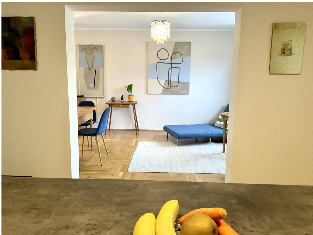
Blick Küche ins Wohnzimmer