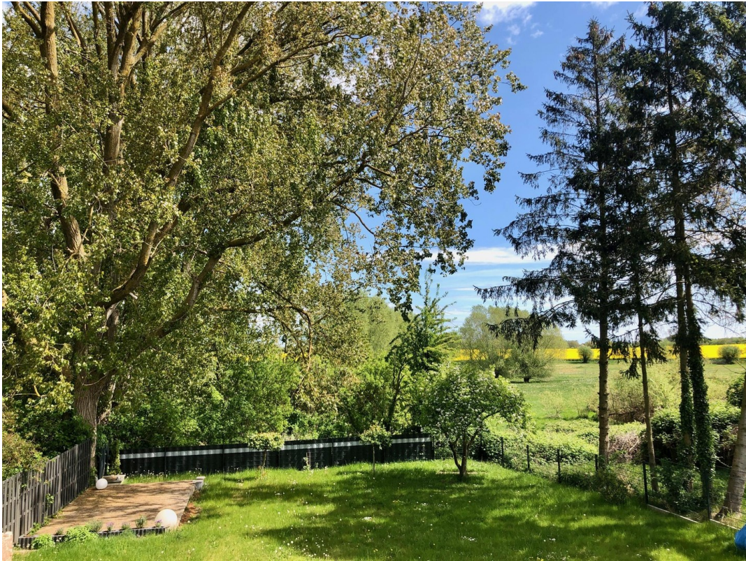
Garten mit Wiesen