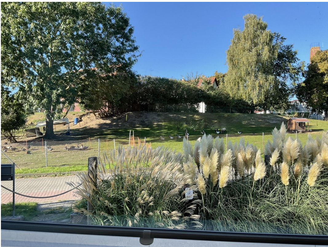
Blick auf kleine Schafweide