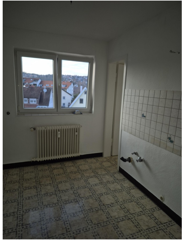
geräumige Küche +Speisekammer