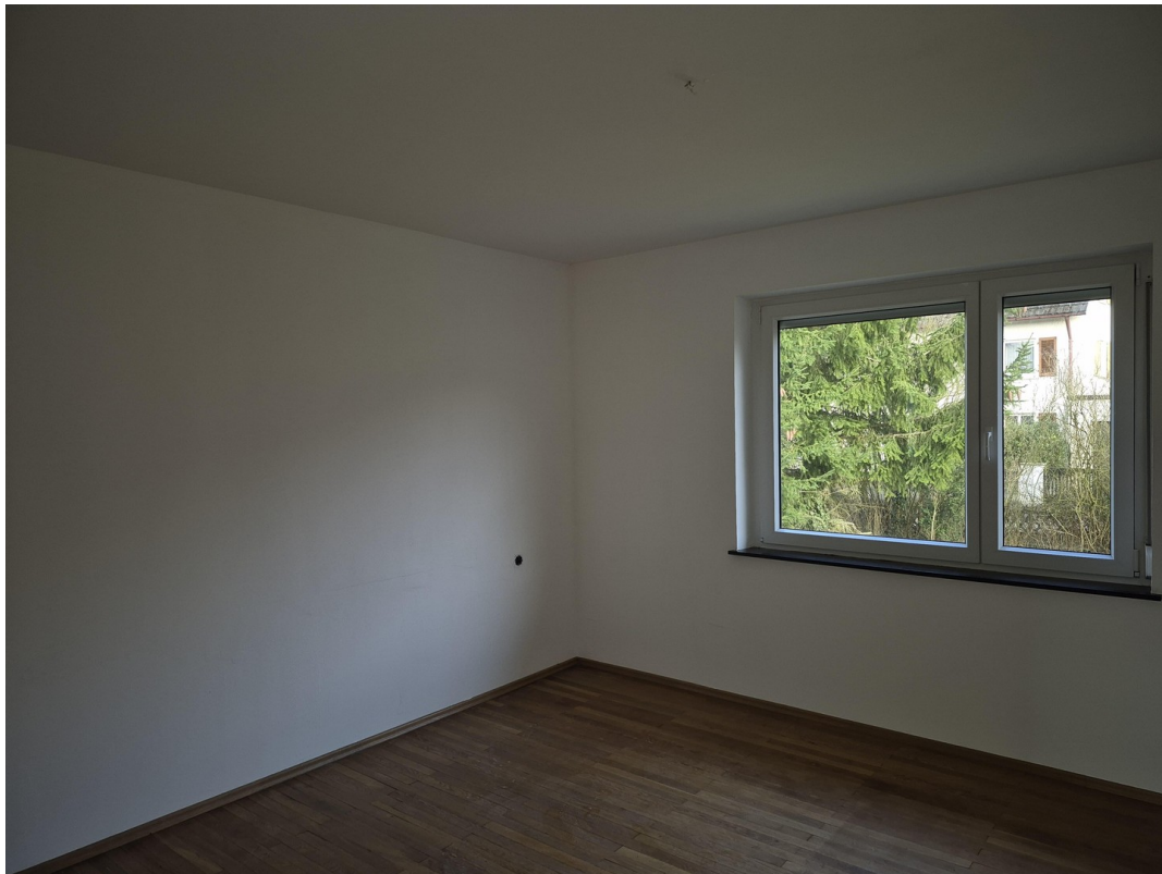
Schlafzimmer ins Grüne